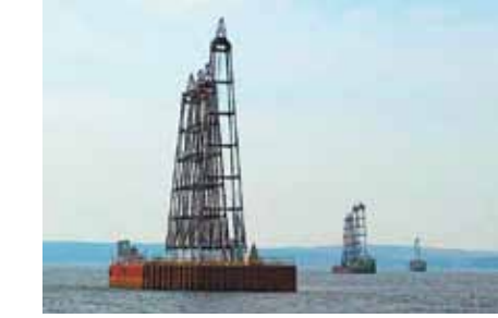
По мнению Минэнерго, России необходимо как можно быстрее начать добычу сланцевого газа. Для этого нам нужно освоить американские технологии, которые вот-вот захватят весь мир. Заодно мы сможем точно узнать, сколько у нас в стране «сланца» вообще. Осваивать технологию предлагают на небольших месторождениях, и заниматься этим должны госкомпании «Роснефть» и «Газпром».

Министерство энергетики предложило с 2014 года начать добычу сланцевого газа. Как считают авторы ведомстве, нашей стране необходимо освоить американские технологии. Аналитики не одобряют эту инициативу: сегодня производство «сланца» нерентабельно и загрязняет окружающую среду.