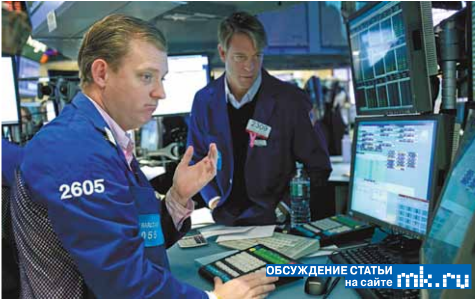
ОБСУЖДЕНИЕ СТАТЬИ на сайте mk.ru

На фоне повышенных рисков начинает возникать больший интерес к инструментам с фиксированной доходностью и защитным активам, отмечает Леонид Матвеев, ведущий аналитик