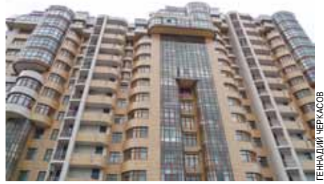
Комитет Госдумы по финансовому рынку рассмотрел ряд поправок, предлагающих сделать обязательным страхование ипотечных кредитов в случае, если сумма займа превышает 70% от приобретаемого жилья. Изменения предлагается внести в законопроект, уточняющий условия выпуска ипотечных ценных бумаг.

В действующем Законе об ипотеке предусмотрено страхование жизни, имущества и ответственности заемщика. Поправками же предлагается добавить ипотечное страхование от имени кредитора. Еще одной поправкой предлагается законодательно ограничить предельный размер ипотечного кредита — не более 90% от суммы приобретаемого жилья. «Зарубежный опыт свидетельствует о том, что многие страны устанавливают более низкое ограничение — 60–70%. Но мы считаем, что возможно установить 90%, учитывая, что это определяет доступность кредита для людей со средними доходами».