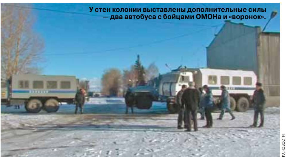
У стен колонии выставлены дополнительные силы — два автобуса с бойцами ОМОНа и «воронки».