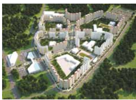
В последние годы москвичи все чаще стали рассматривать квартиры в новостройках ближнего Подмосковья для улучшения своих жилищных условий.

Сегодня более 60% покупателей московских квартир — жители столицы. Это вполне объяснимо: при практически вдвое меньшей цене квадратного метра новостройки ближнего Подмосковья обеспечивают даже самому взыскательному покупателю качество жизни, полностью сопоставимое со столичным. А если подойти к выбору жилья максимально ответственно, то можно найти идеальный вариант с развитой инфраструктурой, удобной транспортной доступностью и хорошей экологией буквально в нескольких сотнях метров от границ Москвы.