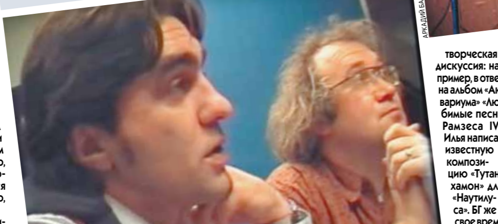
Илья Кормильцев и Вячеслав Бутусов на ВВС у Севы Новгородцева. 1996 год.