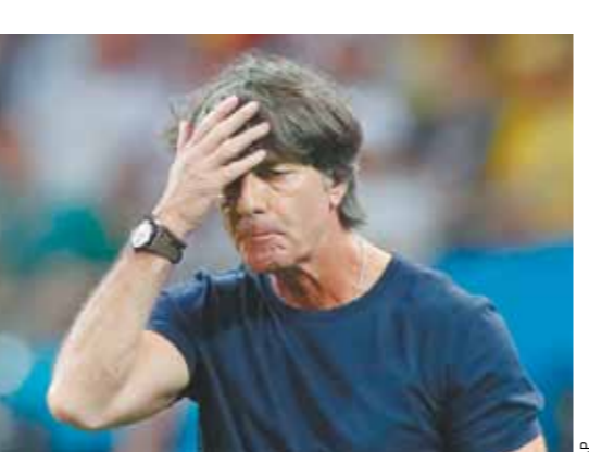
Читайте 6-ю стр.

Вчера в Казани Германия отдала титул чемпиона мира по футболу. Потерпев 2 поражения в 3 матчах на групповом этапе — сначала от Мексики, теперь от, казалось бы, немотивированной Кореи — 0:2 (причем оба гола случились в конце), команда Йоахима Лёва перестает существовать в привычном виде. Нужны перемены. Читайте 6-ю стр.