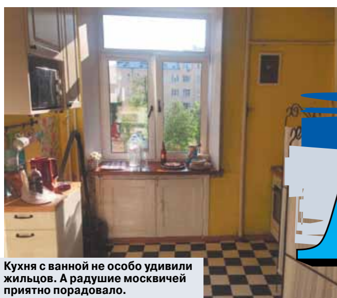
Кухня с ванной не особо удивили жильцов. А радужие москвичей приятно порадовало.