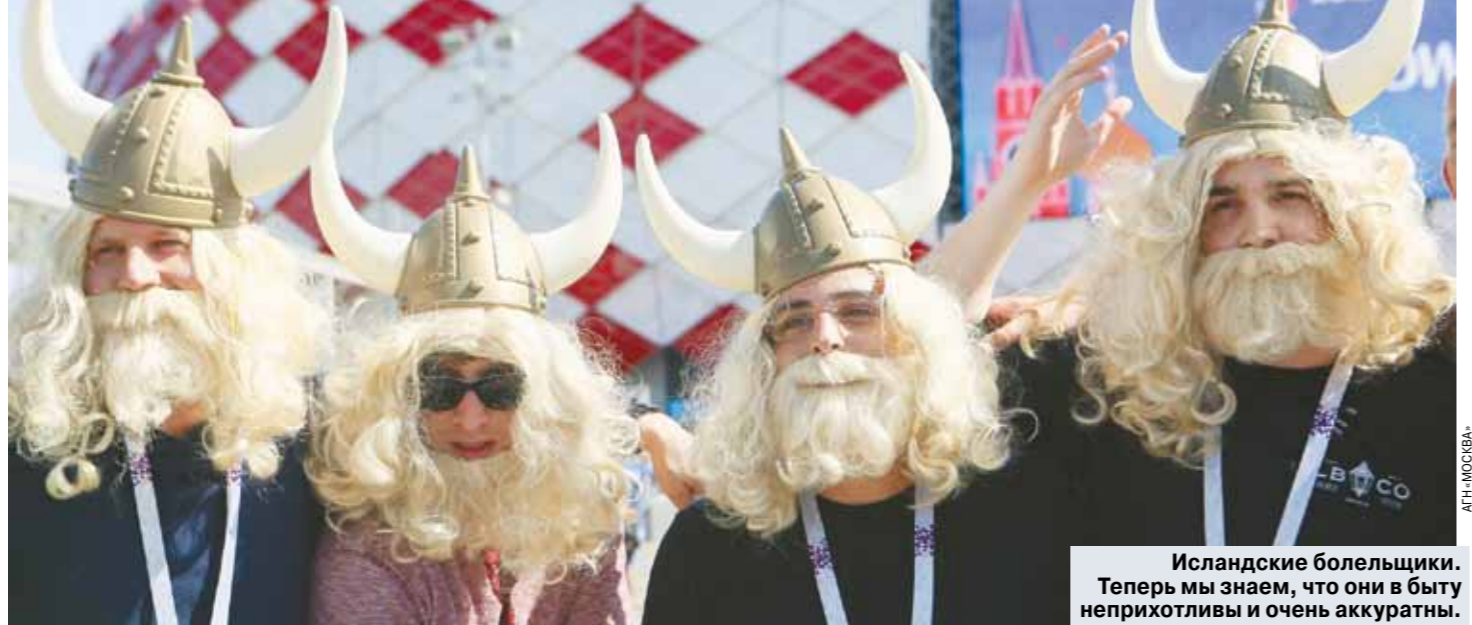
Исландские болельщики. Теперь мы знаем, что они в быту неприхотливы и очень аккуратны.