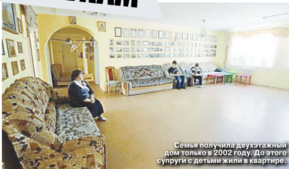
Семья получила двухэтажный дом только в 2002 году. До этого супруги с детьми жили в квартире.

Дети ходят в разные кружки, многие занимаются спортом. У нас прожужо дополнителных