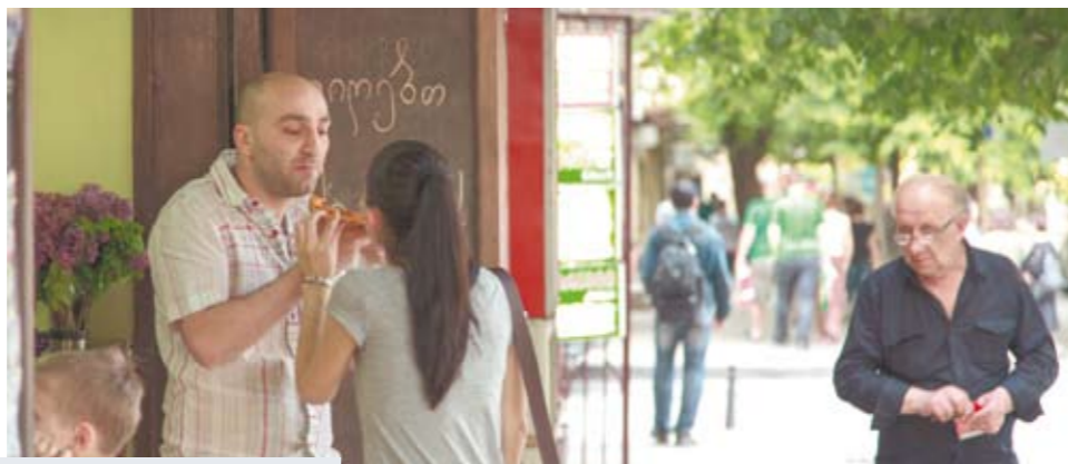
Простые грузины с трудом понимают, кому нужен этот конфликт.

Когда «Грузинская мечта» пришла к власти, мы были уверены, что станет намного лучше. За период ее правления русские школы не закрывались. Однако был уменьшен объем преподавания русского языка. Но проблемы мы решаем в рабочем режиме. Единственно, плохо, что в прошлом году был прекращен набор в университеты на факультет славистики и русского языка как иностранного. К сожалению, того, на что мы рассчитывали в 2012 году, мы не получили. Например, нам култарно обещали русский язык с третьего класса и открытие