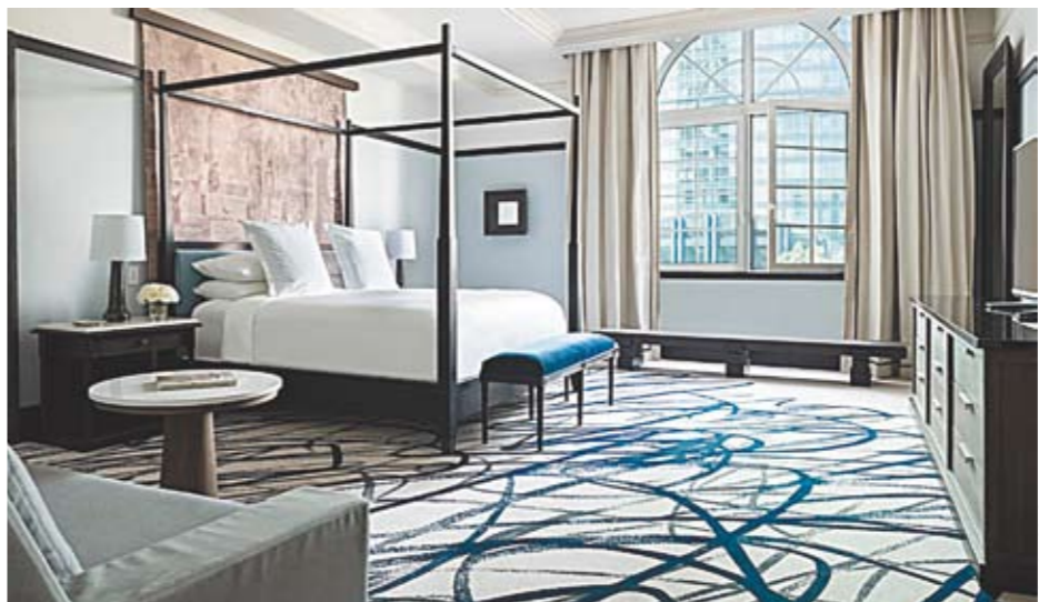
Номер в Four Season Hotel Mexico City в Мехико за 478 782 рубля в сутки.