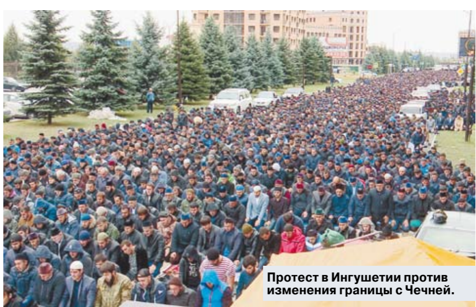
Протест в Ингушетии против изменения границы с Чечней.

— А как быстро разогнается? — интересуются потенциальные покупатели. — До 130 километров в час, — отвечает представитель их разработчика. — И при этом запас хода — не меньше 500 километров.