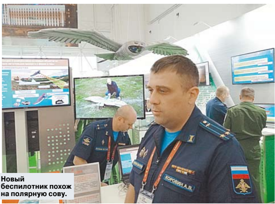
Новый беспилотник похож на полярную сову.

— Солидно! — слышались возгласы одобрения в армянской группе. На «Армии-2019» есть место и околовоенной тематике, которая, впрочем, очень легко превращается в прогрессивные боевые разработки. Например, крохотный космический аппарат «Солнечный парус» от МГТУ имени Баумана.