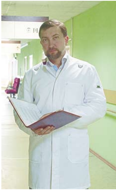
Игорь Владимирович, что такое программа «Стандарт» и чем она отличается от прежнего «Стандарта»?

— Это потребует капитального ремонта. В трех из пяти зданий мы совместно с проектировщиками расписали параметры капитрента с учетом московского «Стандарт+». Наша головная поликлиника начнет