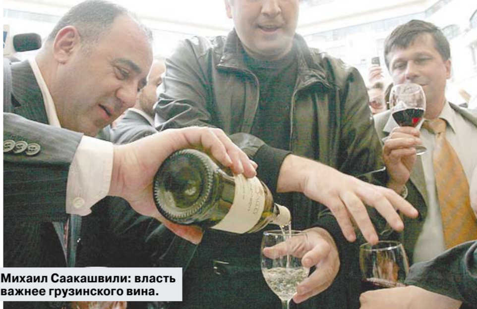
Михаил Саакашвили: власть важнее грузинского вина.

Инициативу, исходившую от фракции «Единая Россия», рассмотрел 8 июля Совет Госдумы. Предложены жесткие экономические санкции: прекращение импорта грузинского вина и воды, а также запрет на денежные переводы в Грузию.