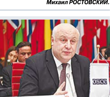
Спикер ОБСЕ Георгий Церетели.