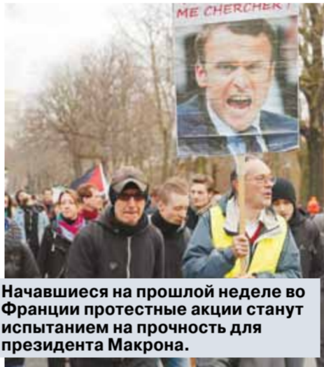
Начавшиеся на прошлой неделе во Франции протестные акции станут испытанием на прочность для президента Макрона.

А главное и первое условие — отдать российско-украинскую границу на территории самопровозглашенных республик под контроль Украины.