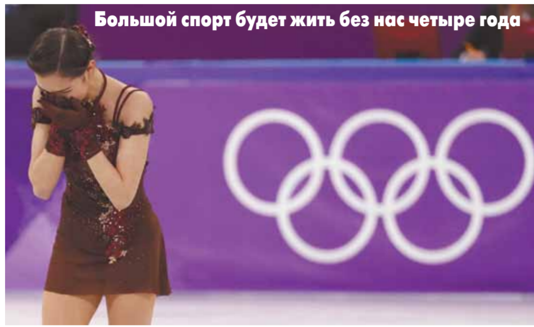
Большой спорт будет жить без нас четыре года

Исполком WADA единогласно одобрил рекомендации комитета по соответствию применить санкции к России: получен бан на чемпионаты мира и Олимпийские игры. Срок — четыре года. Манипуляции с базой данных Московской антидопинговой лаборатории нам не простили. Ближайшие годы не будет флага, гимна, не будет России на чемпионатах мира и Олимпийских играх. Там будут наши спортсмены, но без флага и гимна. Только те, кто докажет свою абсолютную чистоту от подозрений. Не будет и крупных соревнований на территории нашей страны. И, кстати, не четыре года, а больше, потому что в это время России запрещено даже заявлять на проведение турниров по-прежнему, что, как известно, делается заранее.