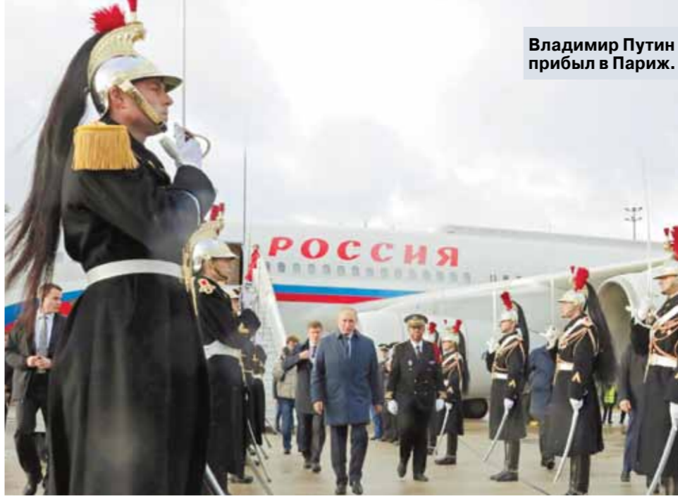
Владимир Путин прибыл в Париж.

Синдром, если уж по-научному, называется обсессивно-компульсивным. Еще можно сказать — одержимости. Алкоголик с утра не понимает, как это он опять нахрался, хотя собирался и обещал себе выпить накануне только одну рюмку.