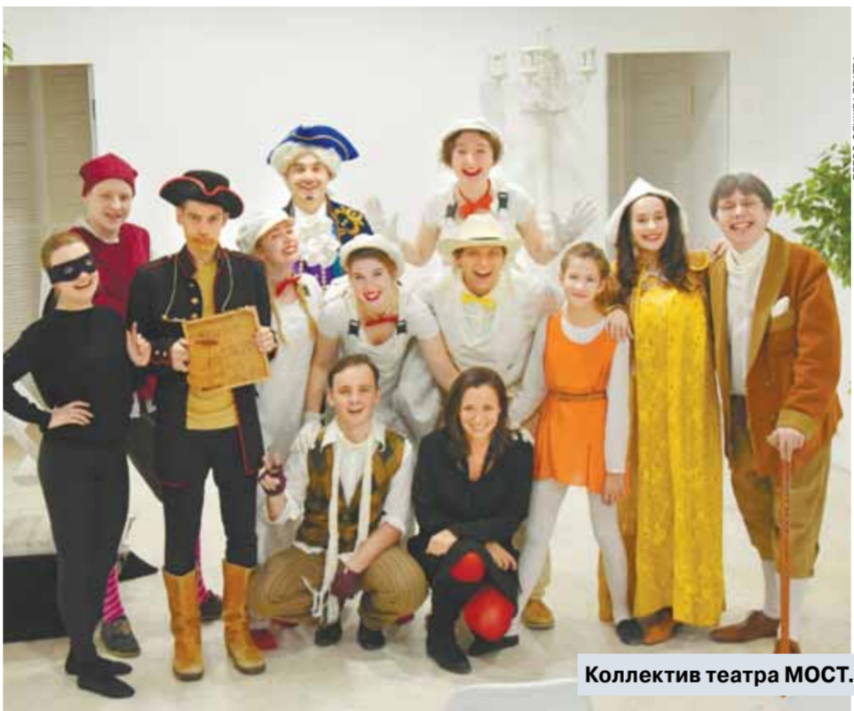
Коллектив театра МОСТ.

— Сцена в здании на Новинском бульваре — очень специфическая, интересная