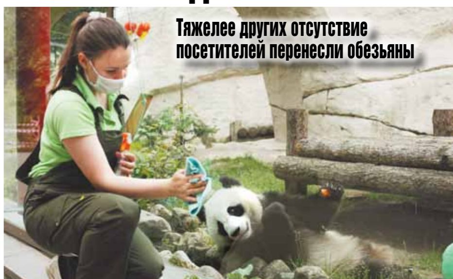
Тяжелее других отсутствие посетителей перенесли обезьяны