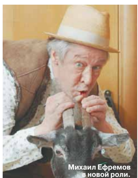
Михаил Ефремов в новой роли.