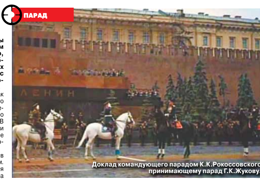
Доклад командующего парадом К.К.Рокоссовского принимающему парад Г.К.Жукову.

Утвержденная на днях президентом Путиным новая дата проведения парада в честь юбилея Победы привлекла дополнительное внимание к его знаменитому предшественнику — Параду Победы 1945-го. Хотя об этом легендарном событии рассказано уже очень много, однако до сих пор некоторые подробности остаются в тени. В числе таких «загадок» — история, связанная с красавцем-скакуном, верхом на котором маршал Жуков принимал парад.