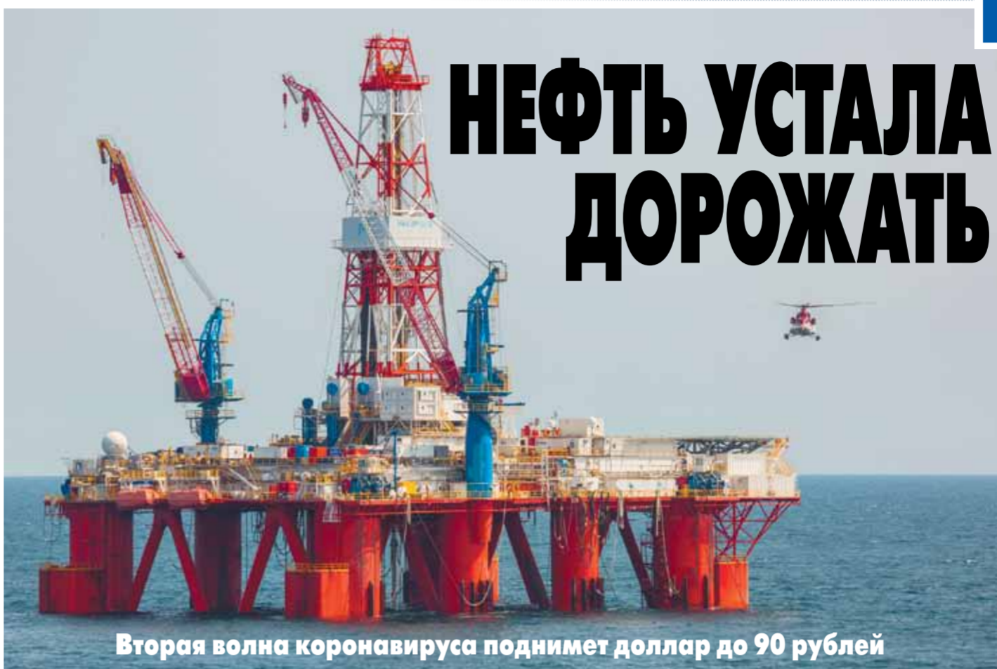
Вторая волна коронавируса поднимет доллар до 90 рублей

Запаса оптимизма от сделки ОПЕК+ о сохранении ограниченной добычи «черного золота» игрокам сырьевого рынка хватило всего на месяц — стоимость барреля снова рухнула. Инвесторы испугались повторной волны пандемии коронавируса, которая захлестнула США и Китай. Кроме того, Саудовская Аравия, недавно настаивавшая на сокращении производства, теперь собирается открыть краны на полную мощность. По мнению экспертов, процесс стабилизации нефтяных котировок затянется надолго и госбюджет РФ столкнется с серьезными убытками. В результа-