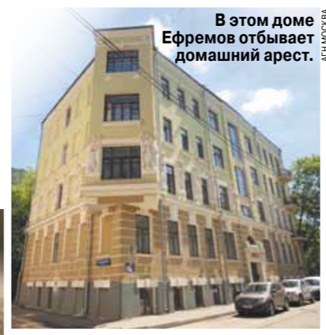
В этом доме Ефремов отбывает домашний арест.