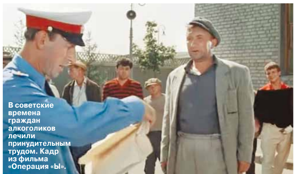
В советские времена граждан алкоголиков лечили принудительным трудом. Кадр из фильма «Операция «Ы»».

«при разговоре об алкоголе непроизвольно сглатывает слюну». Но ни один из них себя алкоголиком не считал. Я пытался вести разговоры в духе: «Ну как вы дошли до такой жизни? С утра вставали и шли за бутылкой в магазин, потом целый день пили?» Он пытался спорить, говорил, что все было под контролем, типа, выпивал, но дозировано. — Все они, по-видимому, до приговора были в СИЗО. Там их лечили? — В СИЗО их никто принудительно не лечил. По закону делать это можно только после решения суда. — А добровольно? Неужели никто не хотел пройти курс? — Из моих «клиентов» — никто. И я сомневаюсь, что в СИЗО бы им это организовали. В то время изоляторы были переполнены, условия содержания плохие. Администрации не до алкоголиков было. Так что они сидели, как все. Только первое время пребывали будто в коматозе. — Через сколько времени подследственный, скажем так, приходил в чувство? — Три месяца. И я просто поражался, когда наблюдал эти изменения (приходил в СИЗО на следственные действия). Человек словно перерождался. Внешне было так — болезненно худые начинали набирать вес, с чрезмерно полных спадали отекли. Лицо приобретало нормальный вид вместо синюшно-красного. Но главное, конечно, — это личностные изменения. Только спустя три месяца можно было нормально разговаривать с человеком. До этого общение было мучкой для всех. Я полагаю, сокамерникам очень сложно приходилось. Наверное, неправильно так говорить,