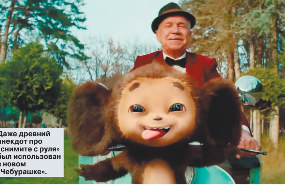
Даже древний анекдот про «снимите с руля» был использован в новом «Чебурашке».

Законопроект о принудительном лицензировании иностранного кино анонсировал депутат Антон Горелкин. «Думаю, в этом году пора ставить точку в спорах о механизме принудительного лицензирования западных фильмов. По моим данным, обсуждается законопроект, который позволит кинотеатрам легально демонстрировать новинки зарубежного кино и не заниматься полуперевадной практикой «предсезонного обслуживания», — написал зампред Комитета Госдумы по информационной политике в своем telegram-канале.