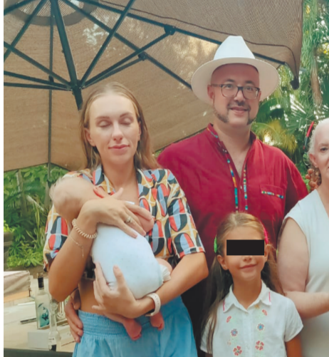
Депутат Максим Васильев на отдыхе в Мексике с семьей.