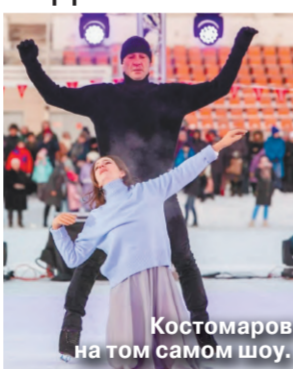
Костомаров на том самом шоу.

Известный фигурист Роман Костомаров госпитализирован в тяжелом состоянии из-за пневмонии. Олимпийского чемпиона 2006 года и двукратного чемпиона мира будут спасать специалисты по коронавирусу.