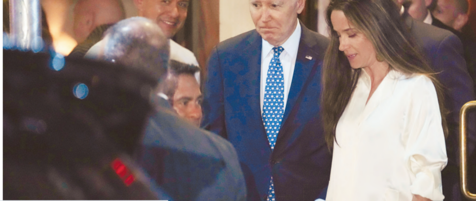
Дочка Байдена Эшли держит папу за руку на выходе из ресторана в Нью-Йорке. 17.09.2023.

Владимир Путин также признал наличие споров внутри правительства по макроэкономическому прогнозу и проекту бюджета. Однако, по его словам, дискуссия пора заканчивать.