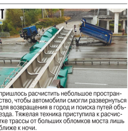
пришлось расчистить небольшое пространство, чтобы автомобили смогли развернуться для возвращения в город и поиска путей объезда. Тяжелая техника приступила к расчистке трассы от больших обломков моста лишь ближе к ночи.

Встреча грузовика с пешеходным мостом во Владивостоке закончилась обрушением последнего. Чтобы расчистить трассу от перекрытых дорожных конструкций, потребовалось несколько часов.