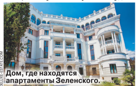
Дом, где находятся апартаменты Зеленского.

Спикер крымского парламента в интервью телеканалу «Россия 24» рассказал о судьбе национализированных апартаментов чети Зеленских в Ливадии.