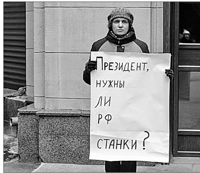
● Одиночные пикеты солидарности в Москве.