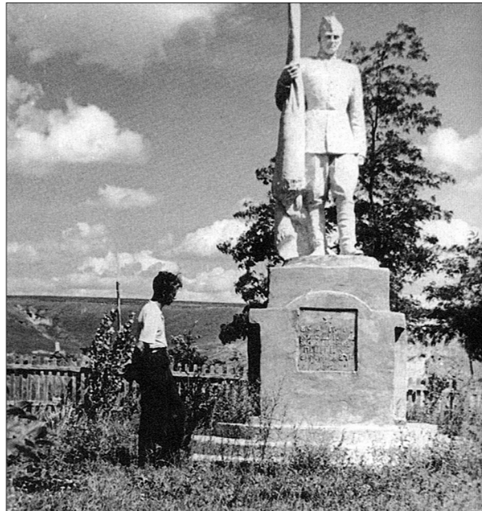
● У могилы брата. Деревня Хильки, Украина. 1956 г.