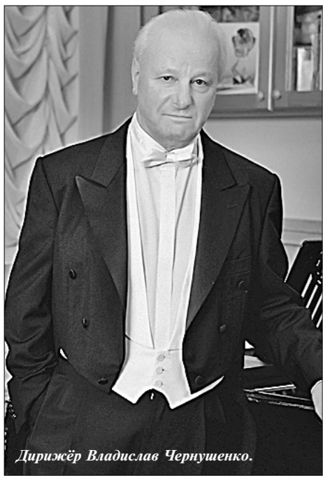
Дирижёр Владислав Чернушенко.

14 января народному артисту СССР Владиславу Александровичу Чернушенко исполнилось 80 лет