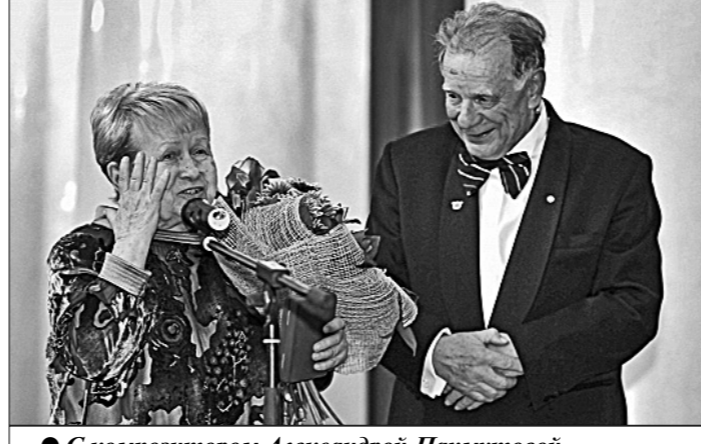
● С композитором Александрой Пахмутовой.