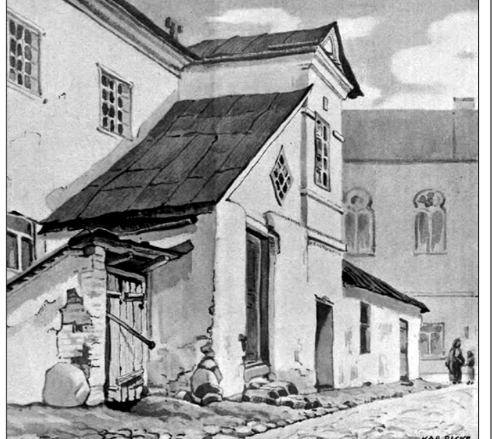
● Белорусский гусарский полк. В Отечественную войну 1812 года полк находился в составе Дунайской армии адмирала Чичагова и участвовал в боевых действиях не участвовал. В зону боёв Белорусский гусарский прибыл поздней осенью 1812 года и успел вступить в схватку с врагом в беле под Вильно. ● Вид на Минск с Троицкой горы. Рисунок неизвестного художника. Конец XVIII — начало XIX в. ● Дом магнатов Сапег на ул. Юрвевской (район современной Октябрьской площади). Рисунок Кароля Биске.