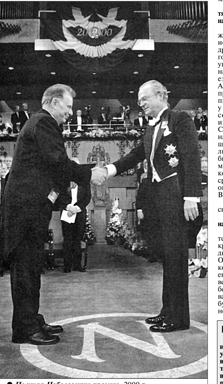
● Получая Нобелевскую премию. 2000 г.

К нашим читателям Напишите нам, с кем ещё из достойнейших и особо уважаемых вами соотечественников хотели бы встретиться в «Правде» под новой рубрикой «Век Октября. Моя революция».