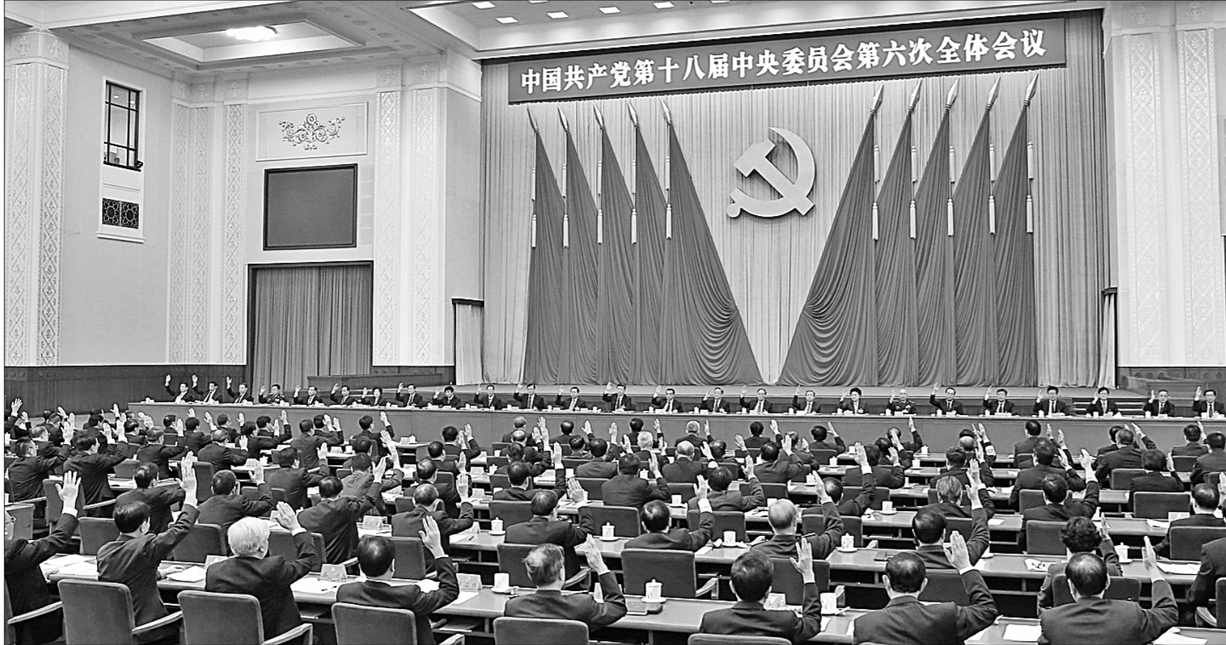
● На Шестом пленуме ЦК КПК 18-го созыва.