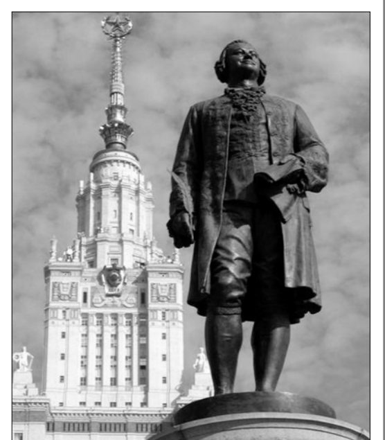
Памятник М.В. Ломоносову перед новым зданием МГУ, установленный в 1953 году. Скульптор Н.В. Томский, архитектор Л.В. Руднев.

В 1949 году на трёх этажах здания Петровской куштакмеры в Ленинграде был открыт музей М.В. Ломоносова. На сегодняшний день собрание музея включает в себя удивительно много вещей первого русского академика.