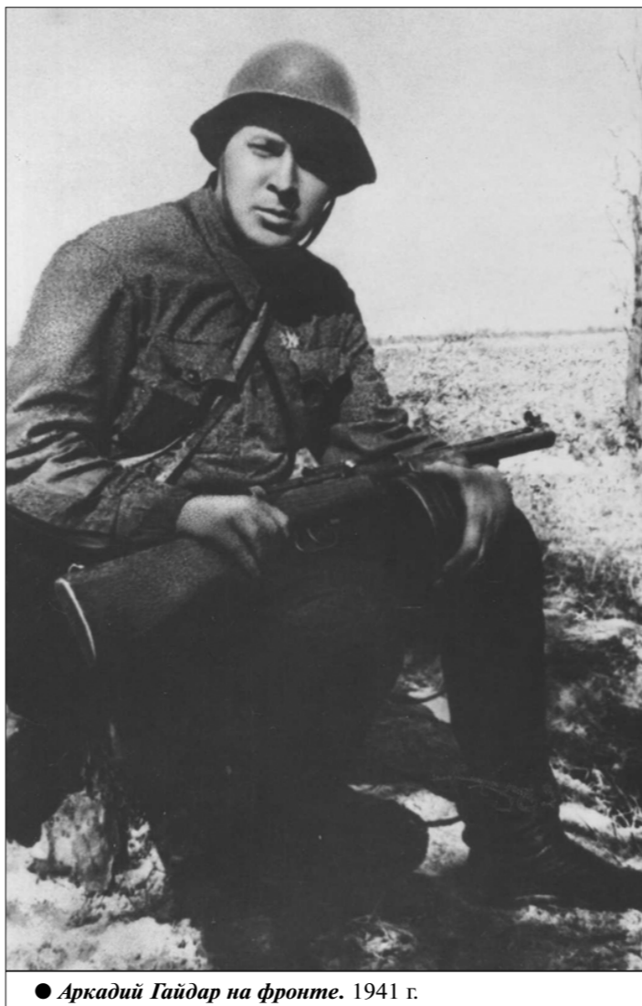
Аркадий Гайдар на фронте. 1941 г.

С НАЧАЛОМ Великой Отечественной войны на борьбу против гитлеровских захватчиков вместе со взрослыми поднялись дети и подростки. Перед первым военным учебным годом, 31 августа 1941-го, к советским школьникам по Всесоюзному радио обратился известный детский писатель Аркадий Петрович Гайдар, автор феноменальной повести «Тимур и его команда».