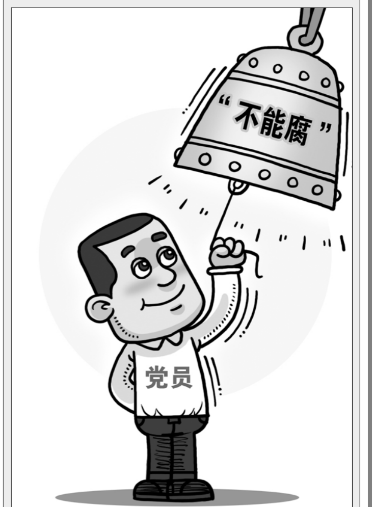
Карикатура: Человек — «Член партии», колокол — «Нет коррупции». Название карикатуры: «Постоянное напоминание». Автор: ДА ЧАО (Синьхуа).