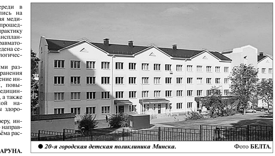
● 20-я городская детская поликлиника Минска.