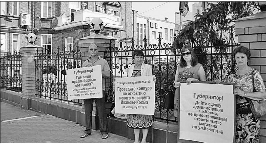
25 июля у здания правительства Ивановской области жители города Кохма при поддержке обкома КПРФ провели пикет, с целью привлечь внимание властей на проблемы, которые не решаются уже длительное время. В акции принял участие кандидат в депутаты Госдумы РФ, член ЦКРП КПРФ Д.Э. Саломатин.

УЧАСТНИКИ ПИКЕТА держали в руках плакаты: «Губернатор! Где ваши предвыборные обещания? Обеспечьте, наконец, возможность навещать могилы родных!», «Требуем от правительства! Проведите конкурс по открытию нового маршрута Иваново—Кохма (по маршруту №123)», «Губернатор! Дайте оценку администрации г. Кохма, не приостановившей строительство магазина на ул. Кочетовой!» Стороннему наблюдателю сразу трудно понять, почему кохочмане вышли к зданию правительства Ивановской области с плакатами. С этим же вопросом обратились к протестовавшим журналисты телеканалов «Барс» и «РТВ Иваново». На что последовал грустный рассказ о равнодушии чиновников. Какой год они своим бездействием препятствуют организации движения автобусов по маршруту Кохма—Иваново с заездом на местные кладбища. 122-го маршрута недостаточно. Раньше был маршрут №123, который давал возможность жителям города посещать могилы родных и близких, но потом перевозчика «выдалили». Для организации движения сделано всё: отремонтирована дорога к кладбищам, сделан разворотный круг на конечной остановке, осталось только пустить автобусы. Но власти и чиновники не спешат удовлетворить требования населения. Складывается впечатление, что это кому-то выгодно. На выборах губернатора Ивановской области в 2014 году господин Козьков, как говорят жители Кохмы, обещал решить эту проблему, но, приняв бразды правления, совершенно забыл о своих обещаниях.