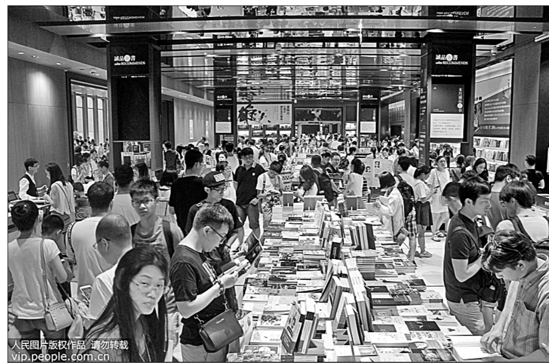
● В книжном магазине города Сучжоу всегда многолюдно. Здесь можно приобрести самую разнообразную литературу, в том числе переводную русскую.

увидел главную сторону социального-исторического хаоса в дезориентации русской интеллигенции. Духовная трагедия её оказалась до катастрофы тяжёлой, трудно преодолимой. Внимательный и прозорливый В. Распутин испытывал социальный и психологический перелом острее и радикальнее. Он тяжело переживал переход