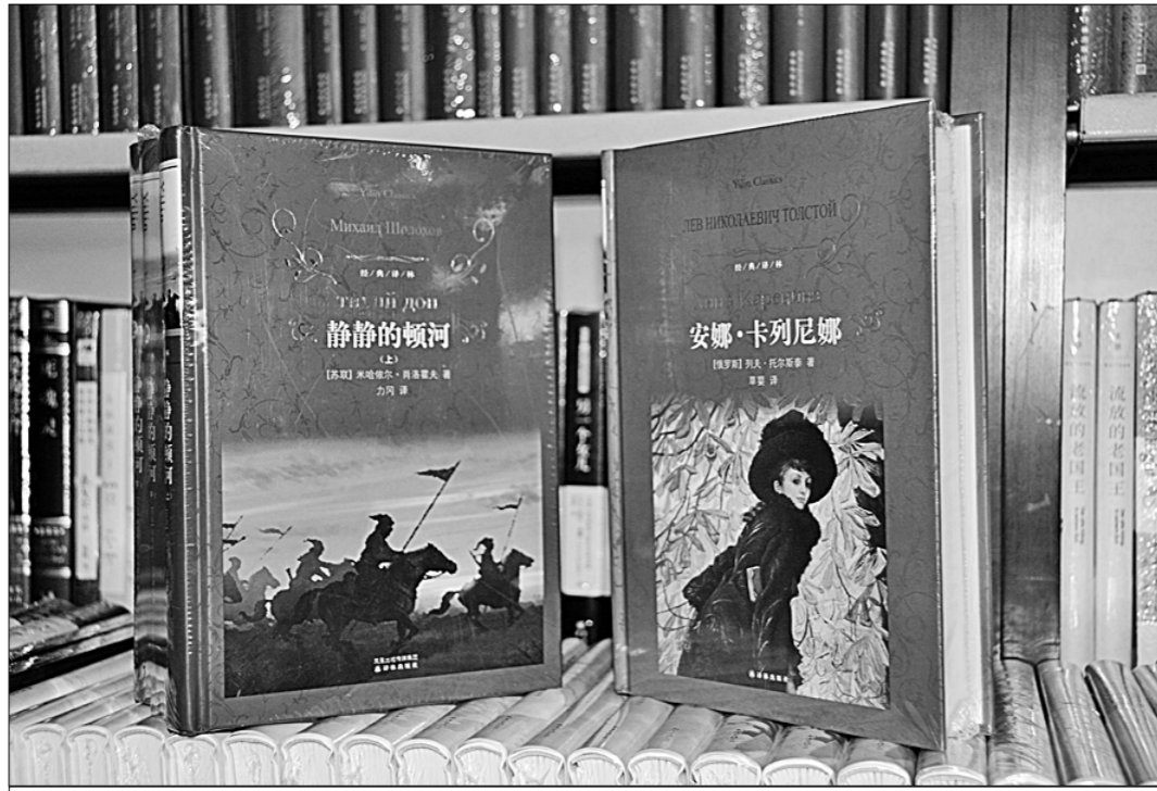
● «Тихий Дон» и «Анна Каренина» на полке китайского книжного магазина.

На протяжении более ста лет многие литературные гиганты Китая оказались под