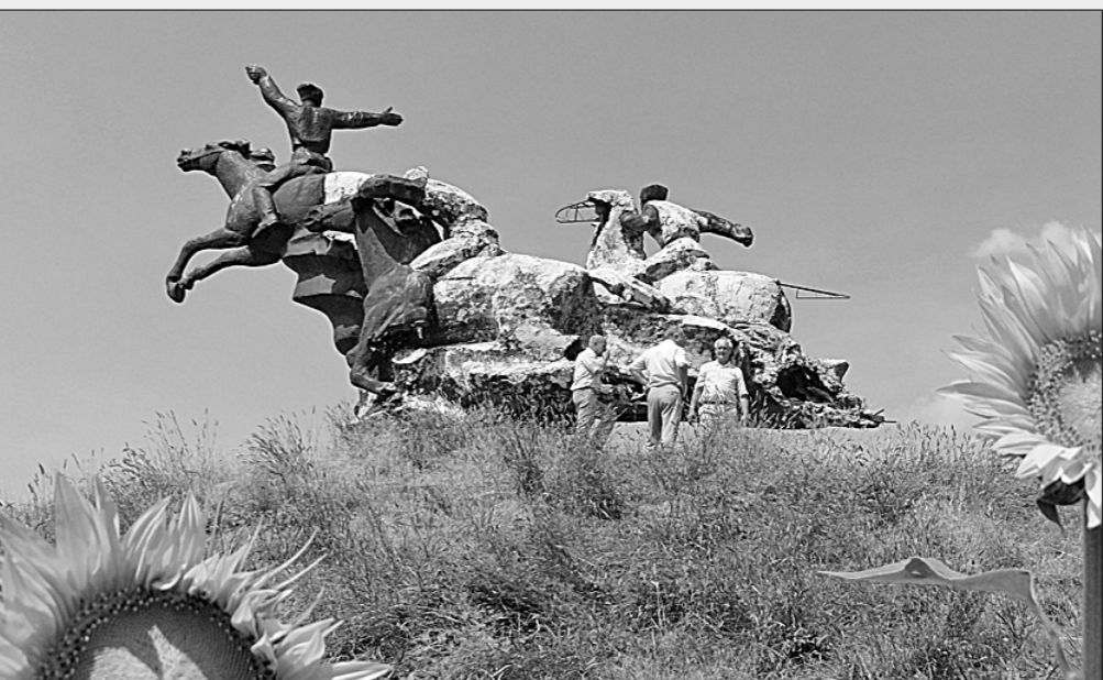
Памятник нужно сохранить.

муниципальной власти, в хорошем состоянии находится и бедняцкий домик семьи Будённых, накрытый стеклянным павильоном. Сохранены также исторические документы и экспонаты. А вот другому создателю красной конницы — командарму Второй Конной Борису Мокоеву Видунскому — не повезло. Монумент, воздвигнутый к 90-летию героя, оказался при новой власти бесчужным.