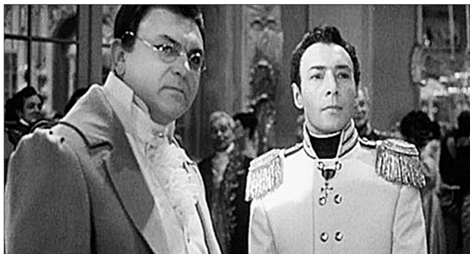
● «Война и мир». Режиссёр С. Бондарчук. 1966–1967 гг.

— В 1967 году в СССР появился Институт конкретных социальных исследо-