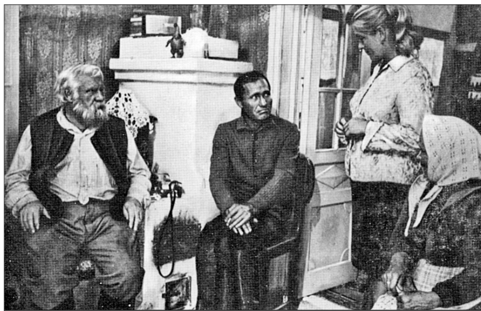
● «Калина красная». Режиссёр В. Шукшин. 1974 г.