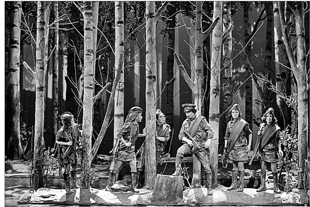
● Опера «А зори здесь тихие...» на сцене Большого национального театра в Пекине.

Концепция и эстетика этих произведений представляют для китайских читателей достаточно сложную и пёструю картину. Русская литература в первое десятилетие нового века, как и век назад, далеко не единообразна, что очень заметно и в отношении писателей к истории и реальности, и в обновлении художественных форм. Однако нельзя не заметить в них и общее, которое выражается в стремлении написать по-своему о России и русском человеке. Ю. Поляков