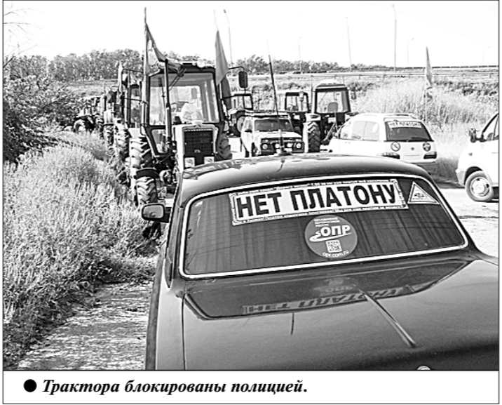
● Трактора блокированы полицией.

Аксайский район, Ростовская область.