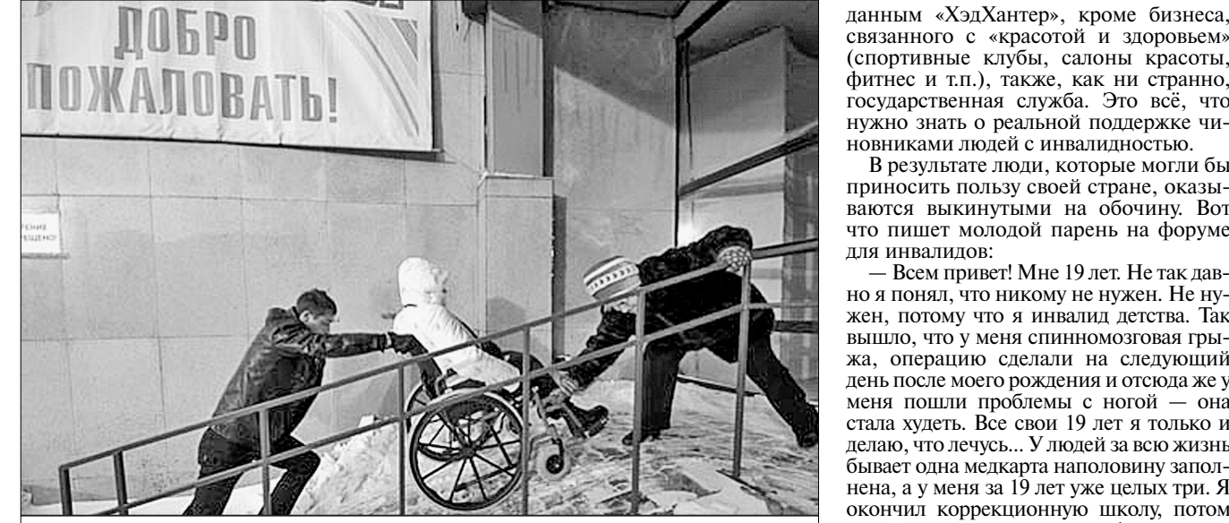
Люди, которые могли бы принести пользу своей стране, оказываются выброшенными на обочину.

ПОХОЖЕ, сегодня нет ни одного уголка в государстве, которое не было бы раздёрнато коррупцией. Казалось бы, ну что можно украсть у такой и без того обездоленной части нашего населения, как инвалиды? А поди ж ты, прокурорская проверка, проведённая в департаменте труда и социальной защиты населения Москвы, показала: 38 работодателей, которые заключили договоры с департаментом на общую сумму более миллиарда рублей, в итоге так и не создали рабочие места для инвалидов. Более того, 22 организации, указанные в документах, и вовсе не существуют в реальности. В этой сфере государство, к сожалению, практически самоустранилось. Однако оно всё-таки сделало два робких шага. Во-первых, для работодателей законодательно закрепило квотирование рабочих мест, предназначенных инвалидам (от двух до четырёх процентов от списочного состава работников). Во-вторых, открыло некоторое количество учебных мест. И не только в специализированных колледжах, но и в таких престижных вузах, как, например, Бауманка, где инвалиды по слуху имеют возможность обучаться по самым перспективным направлениям: информационная безопасность, системы автоматизации производства и т.д.