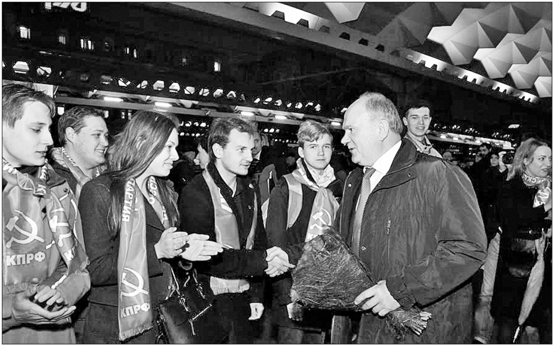
25 апреля начался рабочий визит Председателя ЦК КПРФ Г.А. Зюганова в Санкт-Петербург.

Основные мероприятия визита: посещение ОАО «Кировский завод», где пройдёт встреча с трудовым коллективом предприятия, а также лекция в Балтийском государственном техническом университете «ВОЕНМЕХ» имени Д.Ф. Устинова.