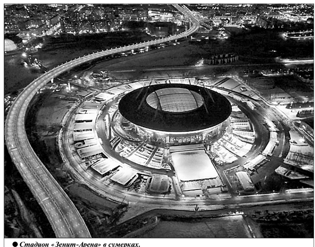
● Стадион «Зенит-Арена» в сумерках.

Всё это лишь известные и подтверждённые факты, связанные со строительством многоэтапного стадиона. Безусловно, существуют и другие, которые не получили широкой огласки и по сей день остаются в поле зрения лишь узкой группы лиц.