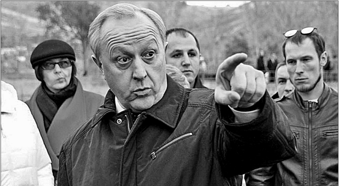
● Саратовский губернатор показывает дорогу на выход.

галереях, оплачивает коммунальные и прочие расходы. И на прокорм оставляет даже меньше, чем предлагает Соколова. Всё это пишется и печатается не для забавы, а чтобы вбить в головы девяностысячный бюджет как оптимальный. Тогда и пенсия можно будет порезать до этого уровня, и зарплату работникам поубавить. А то слыш- ница да саратовский губернатор показывает дорогу на выход.