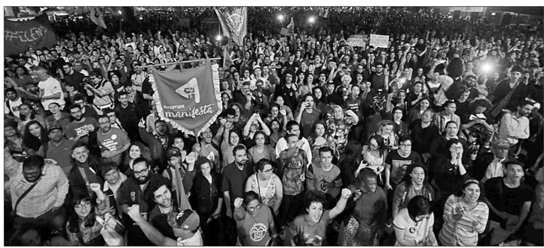
В САН-ПАУЛУ, крупнейшем мегаполисе Бразилии, прошла очередная массовая акция протеста против Жаира Болсонару — ультраправого кандидата в президенты страны, лидирующего после первого тура выборов. С транспарантами «Только не он!» демонстранты, в большинстве своём сторонники левых партий, критиковали яркого сторонника военной диктатуры и репрессий за его профашистские, националистические, расистские и женоненавистнические взгляды.