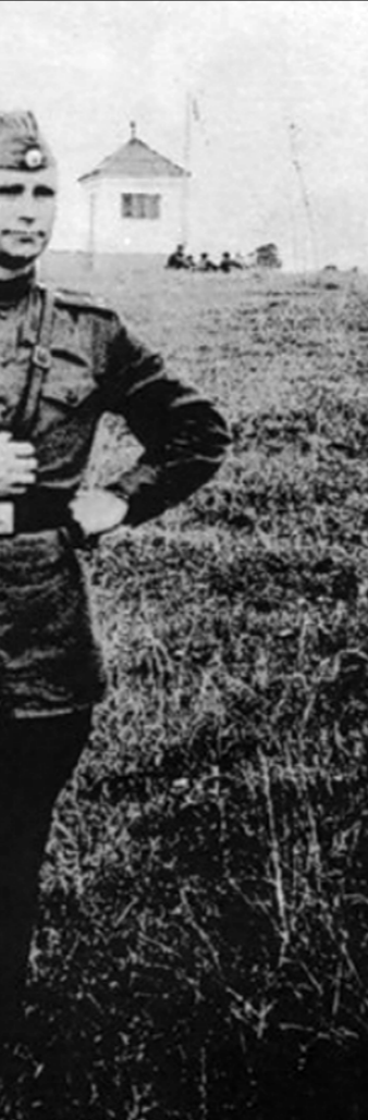
Мым «ЛУ» противопоставила и продолжает противопоставлять себя украинскому народу: водам, солнцу, селам победных, их памяти о родственниках, павших в борьбе с фашизмом. А также противопоставляет себя всем живым, чудом уцелевшим воинам Великой Отечественной. Что это? Наглость или крайний цинизм?..

Много ли найдётся сегодня на Украине людей, способных заметить и пронести эти важнейшие тонкости? Боюсь, что после принятия Верховной Радой 4 октября этого года законопроекта «Об обеспечении функционирования украинского языка как государственного» наших русскоязычных поэтов вообще станут штрафовать, а то и хуже... Поэтому с уходом Александра Александровича осиротела вся, кто творит «на стыке» украинской и русской культур.