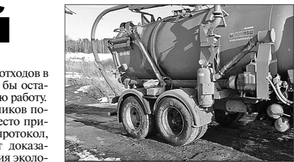
К сливу нечистот готов...

Масштаб экологической катастрофы, которая происходит здесь, просто поражающая. Если с осени прошлого года за дневную смену вывозилось по 25–30 цистерн, то можно представить, какая беда нависла не только над Задонским районом, но и над