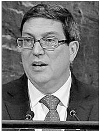
Бруно Родригес, представитель МИД Кубы.

На интернет-портале Cuba Informacion появилась видеозапись 10-минутного выступления представителя МИД Кубы Бруно Родригеса на Саммите Америк в столице Перу — Лиме, где на днях собрались представители всех государств континента.