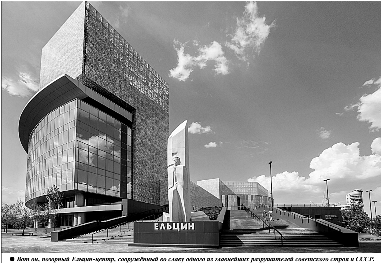
● Вот он, позорный Ельцин-центр, сооружённый во славу одного из главнейших разрушителей советского строя и СССР.

Беловежское проклятие остаётся над теми, кто продолжает идеологию и политику душителей социализма, уничтоживших двадцать лет назад нашу великую Советскую Родину. Лучше всего понять смысл и значение произошедшего под укрытием глухой декабрьской ночи 1991 года в заповедной Беловежской Пуще помогают слова из Обращения И.В. Сталина к народу светлым победным майским днём 1945-го: «Три года назад Гитлер всенародно заявил, что в его задачи входит расчленение Советского Союза и отрыв от него Кавказа, Украины, Белоруссии, Прибалтики и других областей. Он прямо заявил: «Мы уничтожим Россию, чтобы она больше никогда не смогла подняться». Это было три года назад. Но сумасбродным идеям Гитлера не суждено было сбыться — ход войны развеял их в прах». Разве не заветную гитлеровскую мечту осуществили беловежские заговорщики, подписав документ о ликвидации Советского Союза? В их оправдание сегодня говорят, что Советская держава к тому моменту фактически уже перестала существовать. Тогда зададим ещё один вопрос: а кто и как довёл державу до этого?