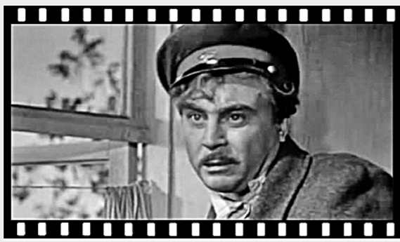
Кадр из фильма «Поднятая целина».

Действие второго романа Михаила Шолохова «Поднятая целина» также происходит на Дону и также посвящено драматическим, меняющим судьбы и многовековой уклад жизни событиям. Автор вспоминал: «Я писал книгу по горячим следам, в 1930 году, когда ещё были свежи воспоминания о событиях, происходивших в деревне и коренным образом перевернувших её: ликвидация кулачества как класса, сплошная коллективизация, массовое движение крестьянства в колхозы».