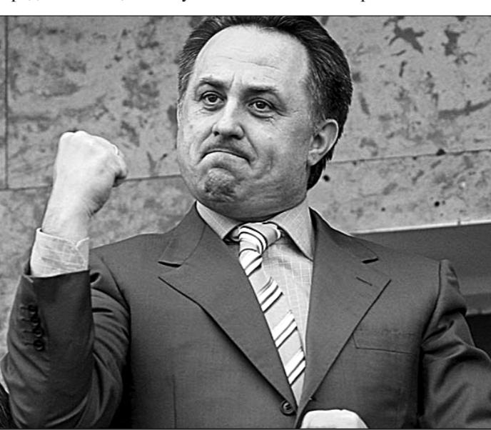
● Ну я вам теперь понастрою!

Но главное даже не в этом. В результате разразившихся после Олимпиады в Сочи допинговых скандалов Виталий Мутко оказался среди тех ответственных за российский спорт чиновников, которых международное сообщество публично