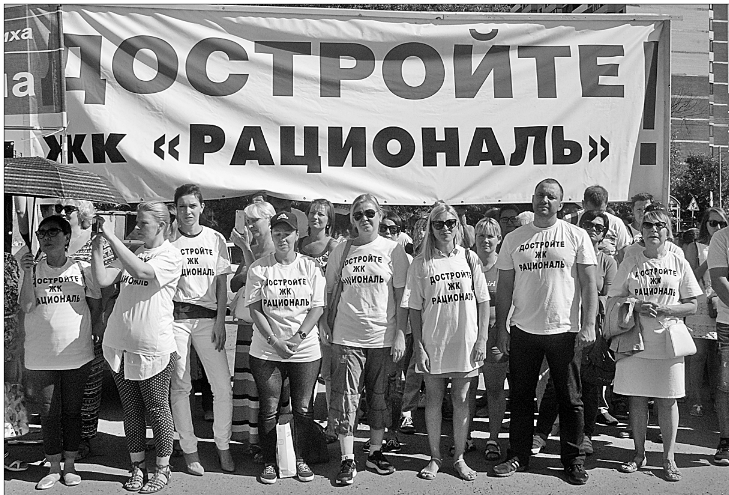
В подмосковной Балашихе в субботу, 25 августа, состоялся крупный митинг обманутых дольщиков Подмосковья. На акцию прибыли люди, вложившиеся в строительство 37 жилищных комплексов Московской области, но так и не получившие своего жилья.

ПЛОЩАДКА митинга пестрела плакатами, в которые вложили всю свою боль: «Достройте ЖК «Рациональ», Реутов рвётся в чемпионы по достройкам», «ЖК «Король», бездействие властей превратило нас в бомжей!», «МАРЗ Балашиха. Главный достройщик Подмосковья. Наш дом по адресу: Балашиха, д. Федурново строится уже 5 лет. Мы не можем больше ждать». Власть, разрешила строить — неси ответственность», «ЖК «Малая Истра». Дольщики устали от пустых обещаний», «Бездомный полк. Сходня. Вишневая, 31», «Долгострою Сходня, Вишневая, 31», «16 лет», «ЖК «Эстет», г. Подольск, мкр. Климовск. Нам нужны квартиры в этой жизни!... И многие-многие другие плакаты, свидетельствующие о небывалом размахе этой проблемы.