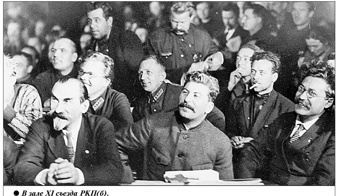
● В зале XI съезда РКП(б).

го сохранить и укрепить единство партии.