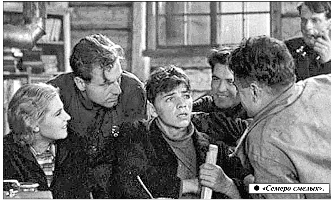
● «Семеро смельчак».

Жорж Садуль во «Всеобщей истории кино» отметил: