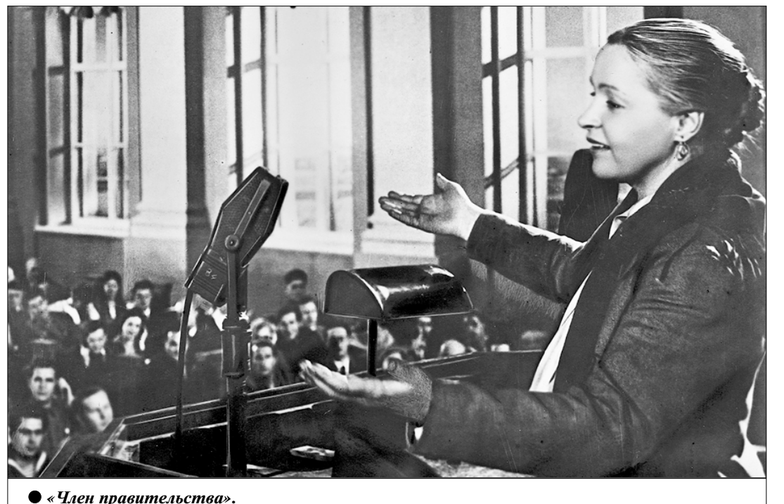
● «Член правительства».