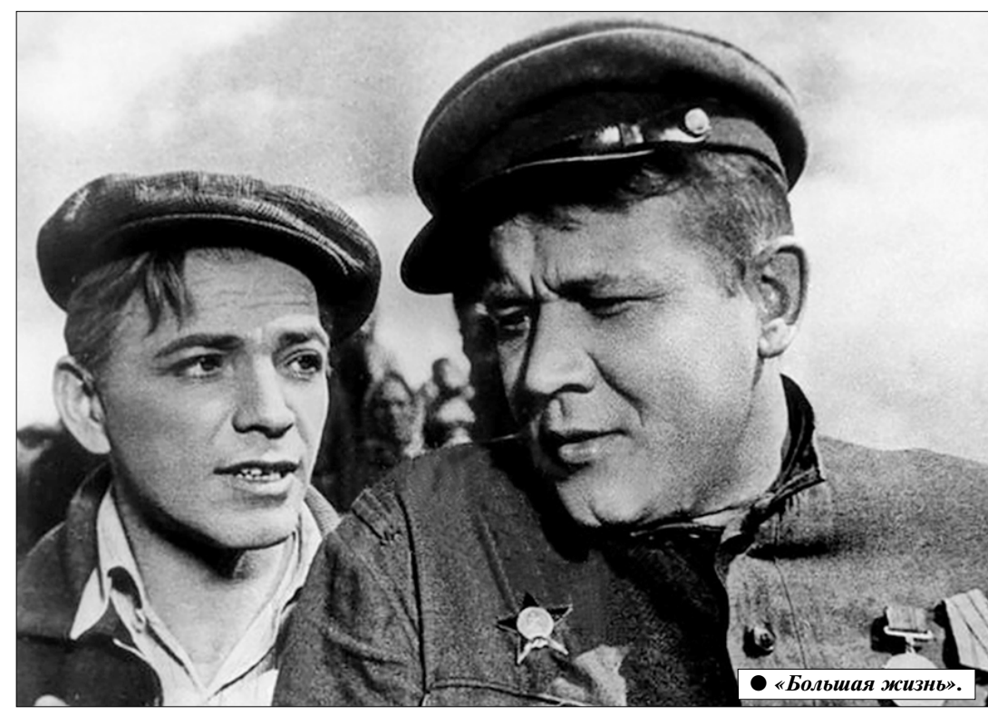
● «Большая жизнь».

Многие известные советские деятели кино — киноактёры, кинорежиссёры, киносценаристы, композиторы, пишущие музыку к фильмам, были участниками Великой Отечественной войны. Сначала перечислим фамилии тех, чьё фронтное прошлое известно большому числу зрителей: Анатолий Папанов, Юрий Никулин, Сергей Бондарчук, Владимир Басов, Михаил Пугачин, Владимир Этуш, Иннокентий Смоктуновский, Алексей Смирнов, Георгий Юматов.