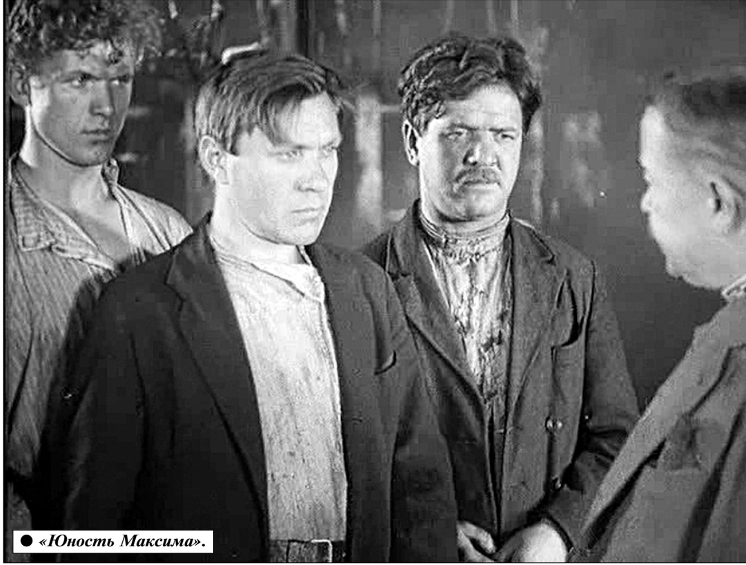
● «Юность Максима».