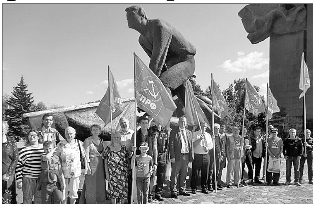
В г. Иваново прошёл митинг, посвящённый памяти расстрелянных рабочих 10 (23) августа 1915 года. Это день глубокого траура для ивановского пролетариата, дня трудового народа текстильного края.

ЭТОТ ДЕНЬ в 1915 году на улице Кокуй (ул. 10 Августа) у Приказного моста была безжалостно расстреляна войсками царя Николая II мирная демонстрация иваново-вознесенских рабочих. Вся вина рабочих заключалась только в том, что они просили хлеба у своих хозяев-капиталистов и сказали открыто и честно властям: война измучила и разорила трудовую массу. Но царские сапёрки встретили тачкой Приказного моста пролетарской кровью. 30 человек убитых и более 50 раненых остались лежать на каменной мостовой.