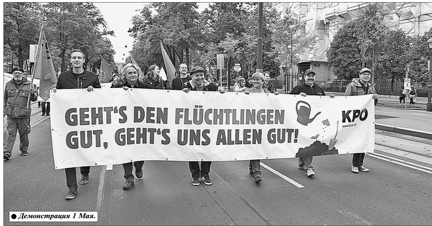
Демонстрация 1 Мая.