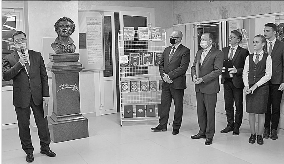
Вряд ли найдётся в Белоруссии ещё один город, где с таким уважением относятся к великому русскому поэту А.С. Пушкину, как Брест. Имя классика мировой литературы носят университет, городская библиотека и лицей №1. В каждом из этих учреждений проводятся многочисленные мероприятия по популяризации творческого наследия поэта.