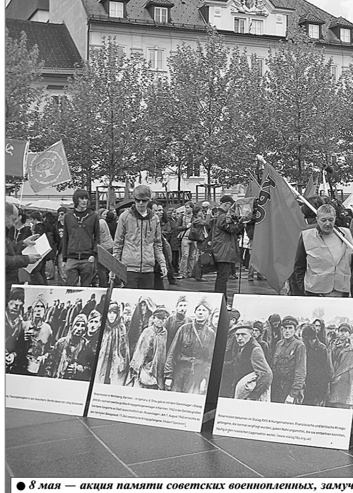
8 мая — акция памяти советских военнопленных, замученных в нацистских лагерях.