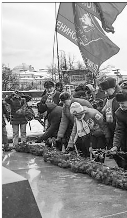
Ненецкий Автономный округ

В Чебоксарах в честь Дня Советской Армии и Военно-Морского Флота коммунисты вместе с комсомольцами возложили цветы к Вечному огню в мемориальном парке «Победа». В церемонии участвовали врио первого секретаря рескома КПРФ, руководи-