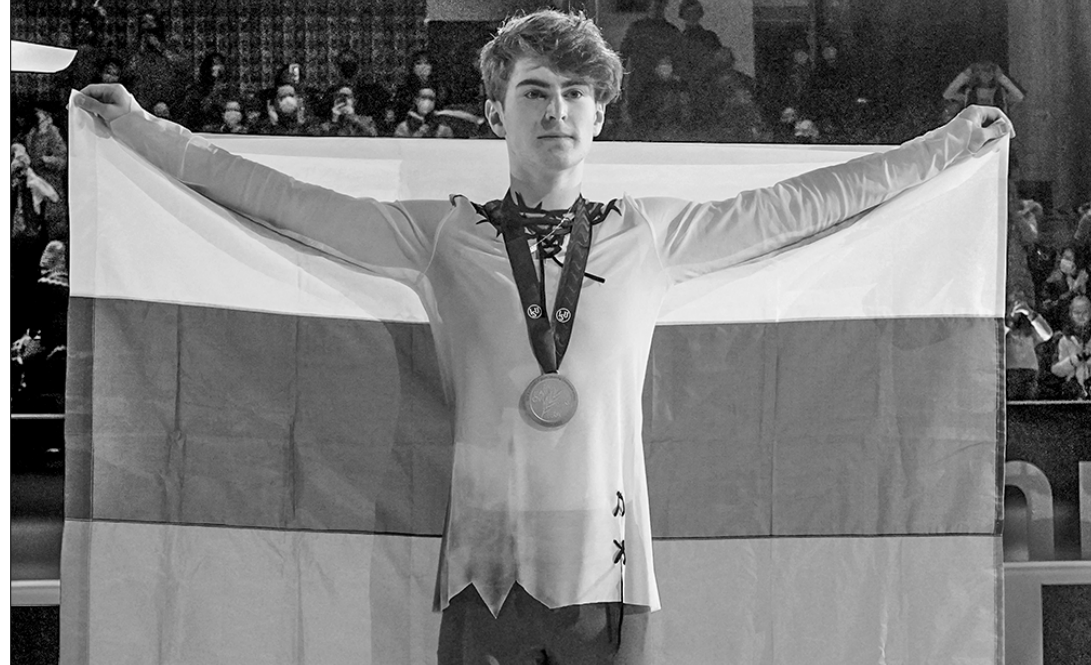
Новый европейский король Марк Кондратюк.