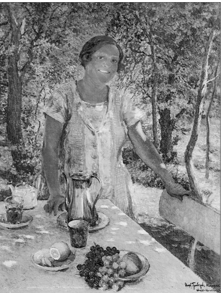
Портрет жены художника. 1927.