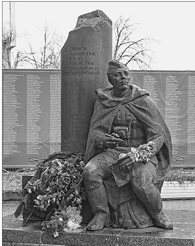
Журналисты КПРФ — продолжатели великого дела советских журналистов. На снимке — памятник в честь военкоров Великой Отечественной перед зданием Центрального Дома журналиста в Москве.