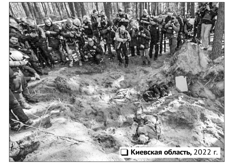
Киевская область, 2022 г.

на чистую воду этого антисоветского мифа уже в наше время приложила группа депутатов-коммунистов, возглавляемая Виктором Илюхиным. К расследованию были привлечены учёные и общественные деятели, получены новые свидетельства, выявлены новые обстоятельства фальсификации. В рамках этой кропотливой работы были вскрыты чудовищные факты деятельности в 1990-е годы целой команды фальсификаторов истории, совершавших преступные подлоги в архивах. Примечательно, что группа, рисовавшая фальшивки, которые потом вводились в оборот как исторические источники, была под крылом первого президента современной России В. Ельцина. И вот 79 лет спустя последователи Геббельса организуют новые «преступления». На месте большевиков теперь оказались российские войска, но