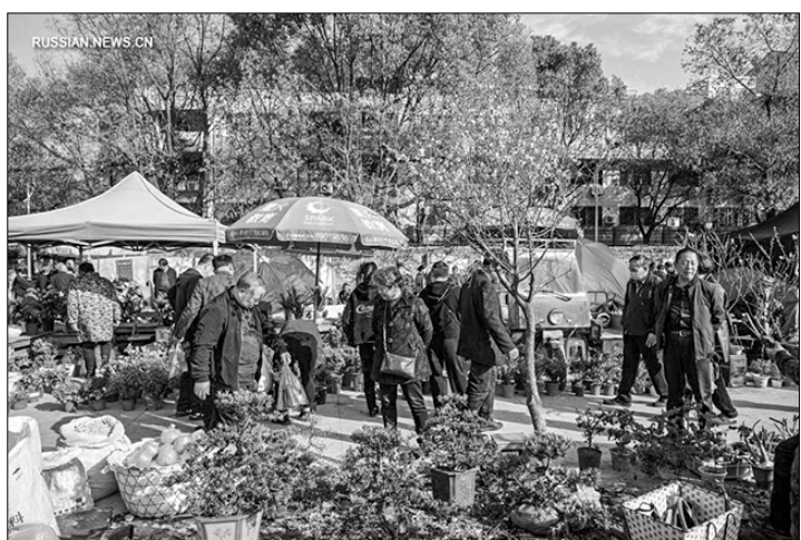
Весна, и время для полевых работ. На территории Китая оживились различные рынки, полные местного колорита. Саженцы, сельскохозяйственные инструменты, цыплята и прочее — всё это ходовые товары на таких рынках.