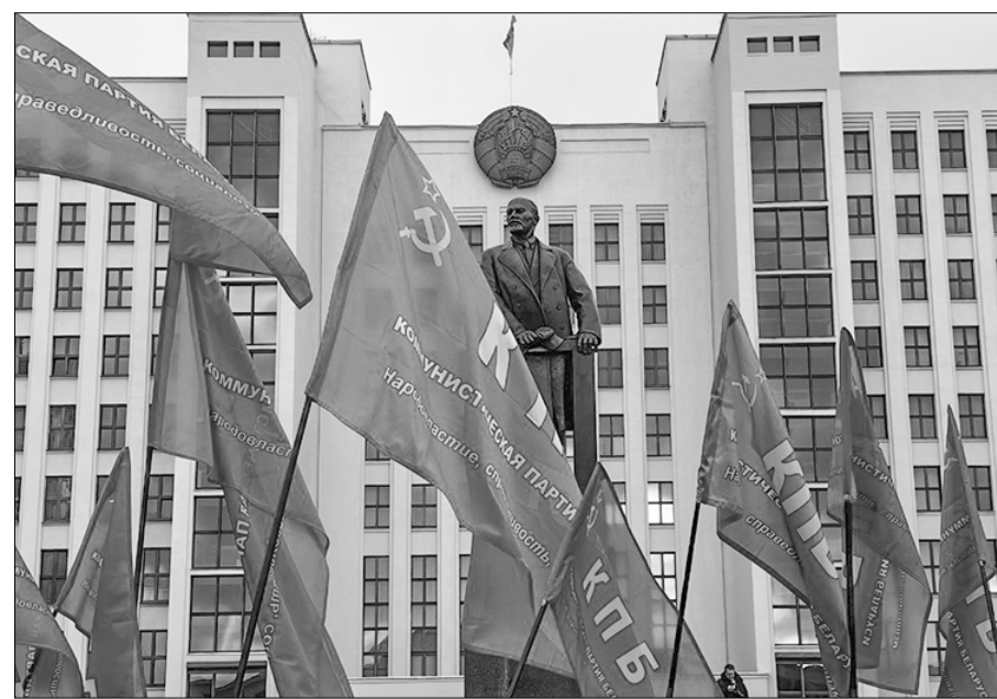
Без большого размаха, как в советские времена, но с не меньшим уважением и торжественностью в Белоруссии отметили 107-ю годовщину Великой Октябрьской социалистической революции.

7 ноября в стране до сих пор является государственным праздником и выходным днём, учреждённым указом президента А. Лукашенко. Ежегодно по этому случаю проходят митинги, концерты, выставки, спортивные соревнования, просветительские акции, диалоговые площадки и научные конференции. Вместе с тем в республике накануне важной исторической даты по доброй советской традиции реконструируют и вводят в строй новые дороги, мосты, учебные заведения, спортивные, медицинские и производственные объекты... В преддверии праздника А. Лукашенко торжественно открыл в Минске бассейн международного стандарта, построенный в рамках гуманитарного сотрудничества Белоруссии и Китая. Благодаря дружбе двух стран в столице вскоре появится и футбольный стадион. В планах и другие крупные социальные объекты. Выступая перед собравшимися, президент подчеркнул, что белорусский и китайский народы роднят уважительное отношение к истории социалистического движения. «Сегодня о социализме говорят всё больше и больше, хотя ещё в середине 1990-х годов о него буквально вытирали ноги», — заметил А. Лукашенко. — Мы этим путём не пошли. И что видим? Европа ориентируется на социализм, не называя, может,