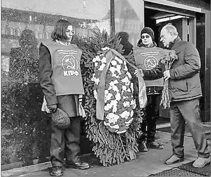
21 января, в 101-ю годовщину со дня кончины В.И. Ленина, коммунисты, комсомольцы, союзники и сторонники партии возложили венок и цветы к Мавзолею на Красной площади.

Перед участниками акции выступил Председатель ЦК КПРФ Г.А. Зюганов: — Сегодня — день памяти Владимира Ильича Ленина. Тогда, в 1924 году, перестало биться сердце этого великого человека. Но его мысли, идеи, дела были настолько велики и могучи, что они осветили не только прошлый век, но и сегодня являются путеводной звездой для всех честных, умных, мужественных и волевых людей.