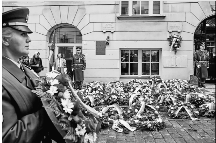
Прага. Мемориал в честь студентов, погибших от рук нацистов в ноябре 1939 года.

Приглашение Компартии Чехии и Моравии (КПЧМ) почитать память студентов, убитых гитлеровцами в ноябре 1939 года. На листочке изображён Ян Олплетал — символ сопротивления фашистам.