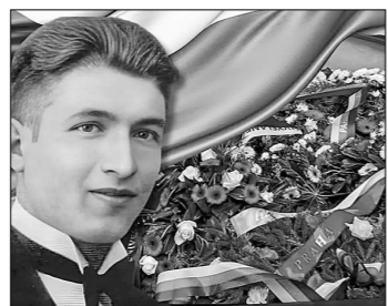
MEZINÁRODNÍ DEN STUDENTSTVA 17. LISTOPADU, 11.00 HLÁVKOVA KOLEJ V PRAZE

По данным на 10 ноября, в Чехии насчитывалось 397400 граждан Украины со статусом временной защиты. Год назад эта цифра составляла 384600, причём число детей уменьшается, а молодых мужчин,