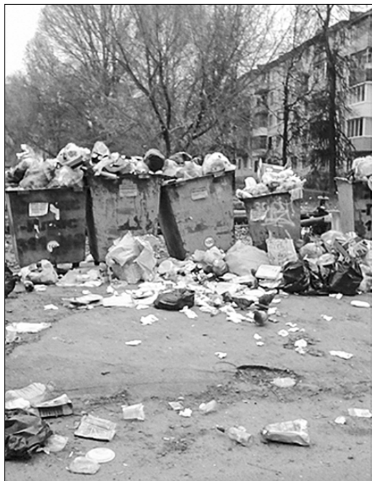
г. Брянск. Мусорные баки в Брянске.