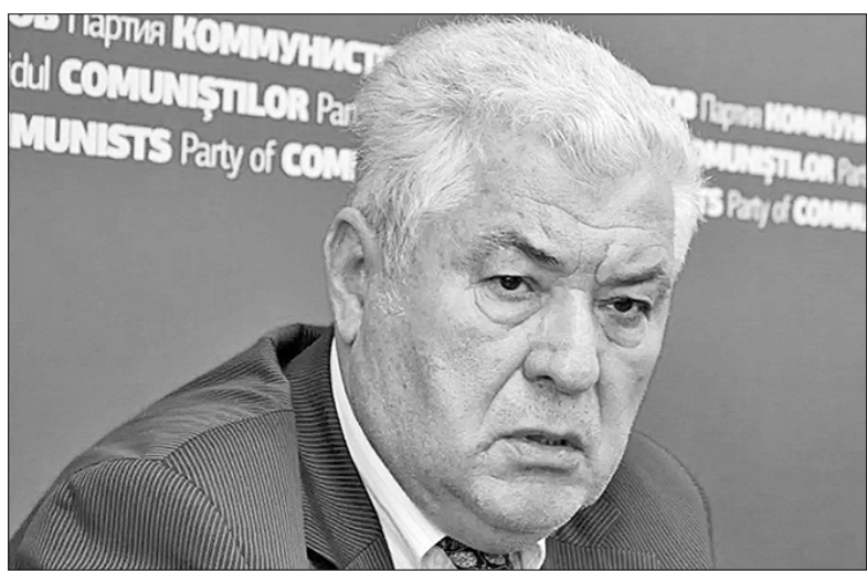
Поздравляем с юбилеем лидера коммунистов Молдовы В.Н. Воронина