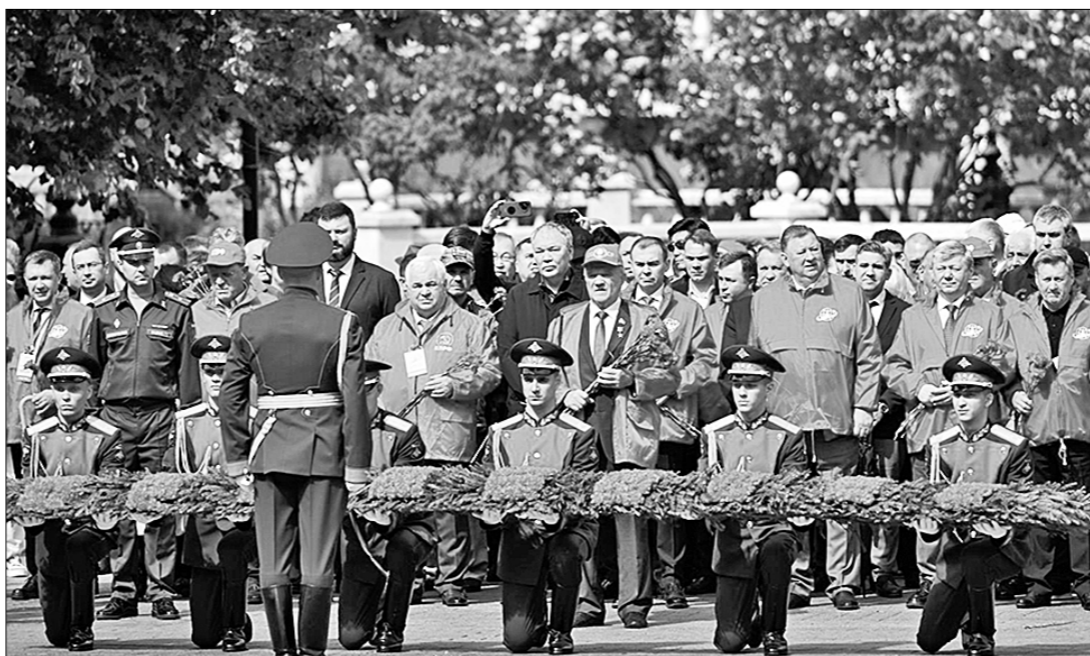
Во вторник, 26 мая, в рамках состоявшегося в Москве Международного антифашистского форума его участники во главе с лидером КПРФ Геннадием Зюгановым возложили цветы к могиле Неизвестного солдата у Кремлёвской стены.