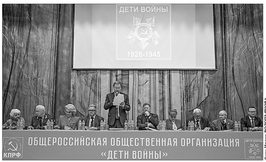
Общероссийская общественная организация «Дети войны».

Уже в 1942 году СССР производил в 4 раза больше танков, артиллерии, кораблей и самолётов, чем Германия и все её сателлиты. При этом в годы войны некоторые дети, несмотря на юный возраст, отправились на фронт, становились сывальками полков, дивизий и боролись плечом к плечу со взрослыми воинами против фашистских захватчиков.