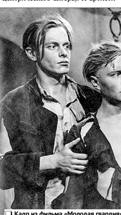
Кадр из фильма «Молодая гвардия».

тельную актрису, народную артистку СССР Тamarу Макарову. К 1936 году, когда Герасимов поставил фильм «Семеро смель», он прошёл уже немалый путь в кинематографе. Приехав с Урала в Ленинград, он начинал как актёр в фильмах Г. Козинцева и Л. Трауберга, был одним из самых активных участников ФЭКСа (Фабрики экспериментального актёра). И артисти-