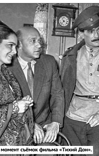
Рабочий момент съёмки фильма «Тихий Дон».

нельзя было работать в искусстве по-старому. И, естественно, родилась потребность экранизировать роман. Впрочем, слово «экранизировано» в данном случае мало что выражает. Надо бы, пожалуй, сказать: возникла потребность и необходимость экранно приблизиться к миру Михаила Шолохова, проложить в нём кинематографическую дорожку, чтобы каждый его осваивать, изучать, пользоваться его несравненными богатствами... В «Тихом Доне» меня привлекала и увлекла грандиозная картина классового боя и революционного переустройства мира, картина, в которой с великим мастерством было сплавлено социальное и психологическое, идеологическое и интимно-личное, потаённое, раскрытое с необыкновенной, какой-то пронзительной правдой. Конфликты социальные и