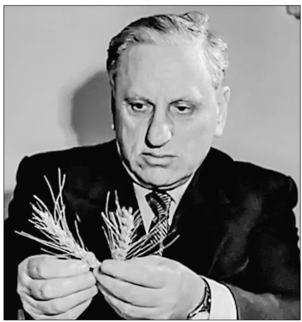
«Ой, на гори та й женцы жнуть...»