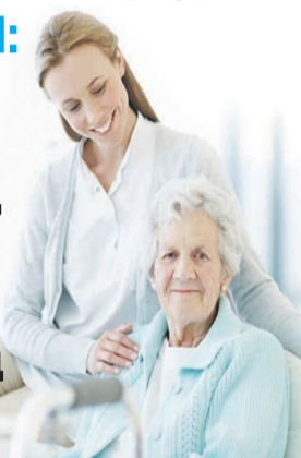
график работы: вахта