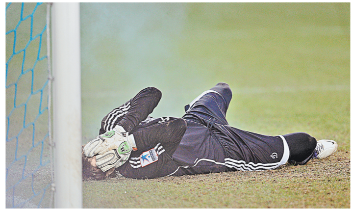
...и доигрались до того, что вратарь «Динамо» оказался в больнице.