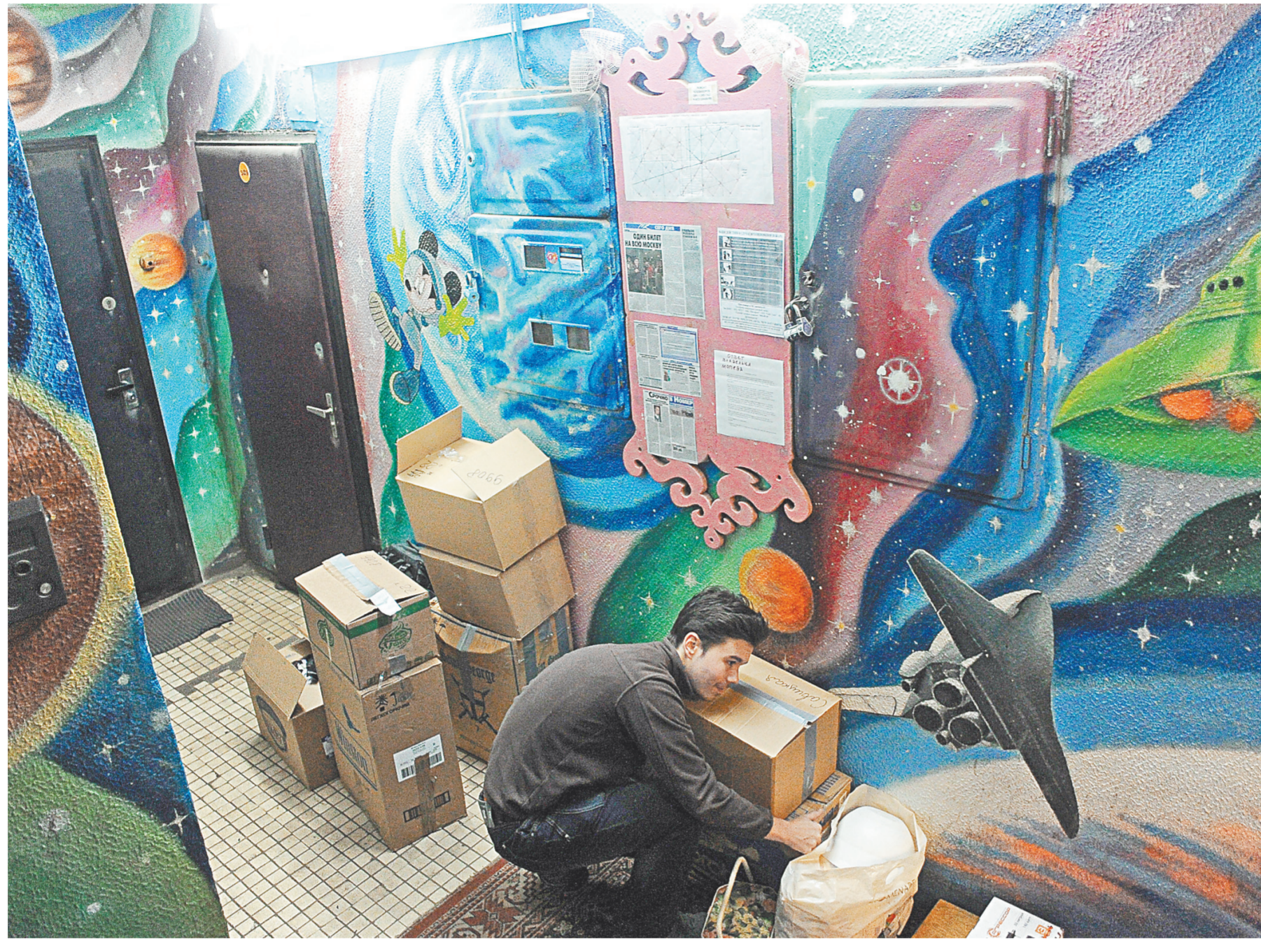
Самый обычный подъезд самого обычного жилого дома может выглядеть как художественная галерея — нужны лишь талант и фантазия. На фото — фрагмент росписи художника Дмитрия Бочарова в подъезде дома на улице Медынской в Москве.