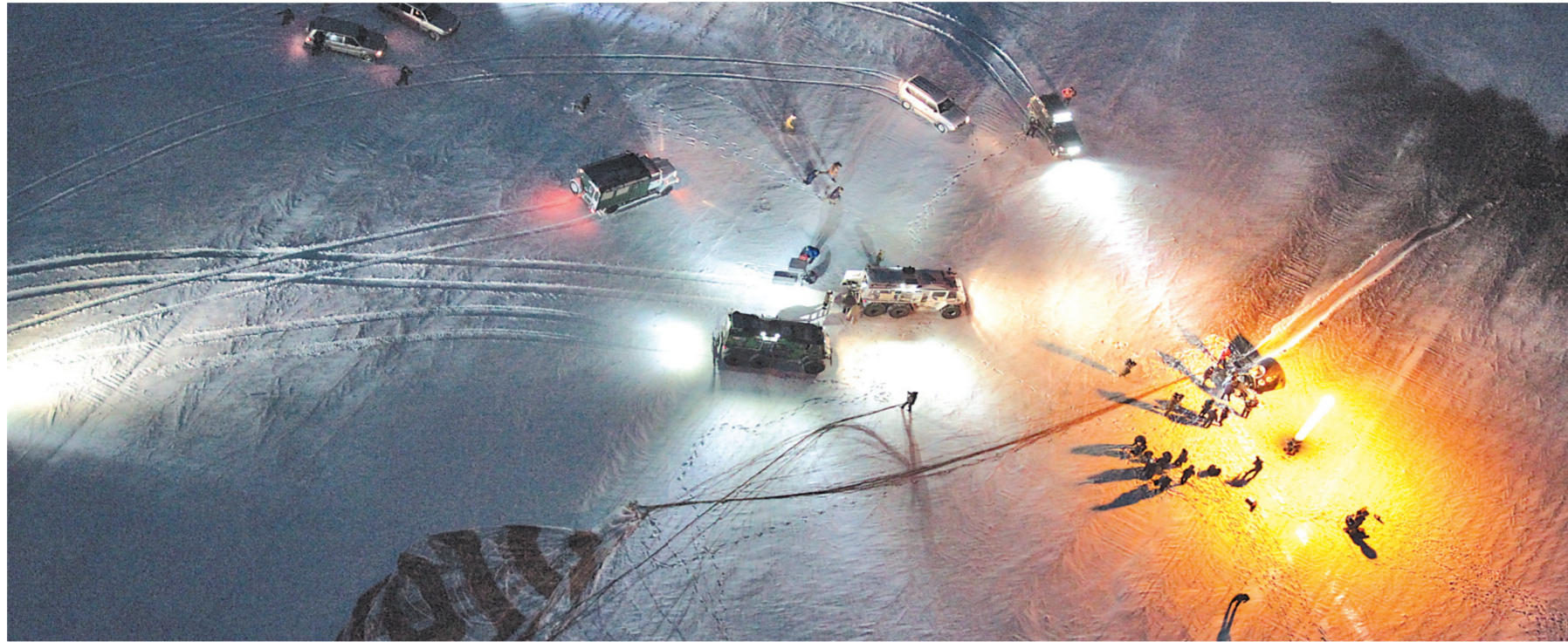
Посадку спускаемого аппарата корабля «Союз ТМА-05М» обеспечивали три самолета, 12 вертолетов и шесть поисково-эвакуационных машин.