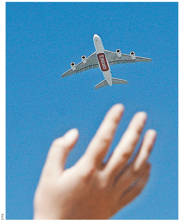
Стандарты для обучения авиаторов не потеряют унификации ни с железнодорожными, ни с речными нормами.

В общем, приехали! А точнее — приземлились. Надо сказать, это не первая попытка разоб-браться с вузами гражданской авиации: несколько лет назад их уже пытались забрать у Росавиации и передать под крышу Минобрнауки. Но тогда все-таки хватило понимания, что передача в общий «котел» учебных заведений, готовящих «штучных» специалистов — пилотов, авиационных инженеров и диспетчеров — может привести к катастрофическим последствиям. И это не пустые слова.