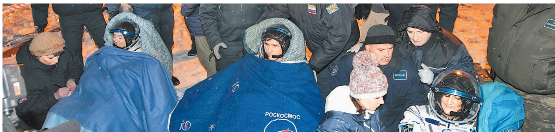
Улыбки — лучшее подтверждение, что экипаж, отработавший в космосе 127 суток, чувствует себя хорошо.