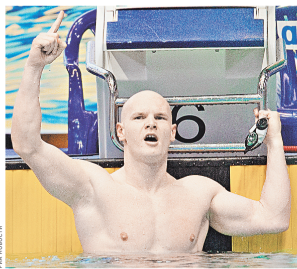
Призер Олимпиады в Лондоне Евгений Коротышкин хорошо помнит, как пришел в бассейн четырехлетним мальчишкой.

ЕВГЕНИЙ КОРОТЫШКИН: Форма не идеальная, но я совершенно точно буду бороться за призовые места на обеих дистанциях: на 50 и 100 м баттерфляем. Надеюсь, что и в эстафетах мы будем конкурентоспособны. Так что даже больше переживаю за команду. Мы ведь едем молодым составом. Для недавних юниоров чемпионат Европы будет достаточно серьезным стимулом показать себя. Надеюсь, кто-то сделает это с запасом на следующие Олимпийские игры. Сейчас молодежи надо вытравиться вперед, занимать правильное место в рейтинге.