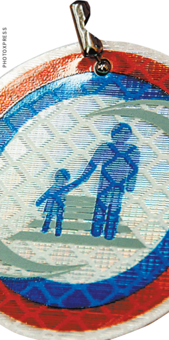
В ГИБДД считают, что световозвращающие элементы на одежде снизят количество наездов на пешеходов.