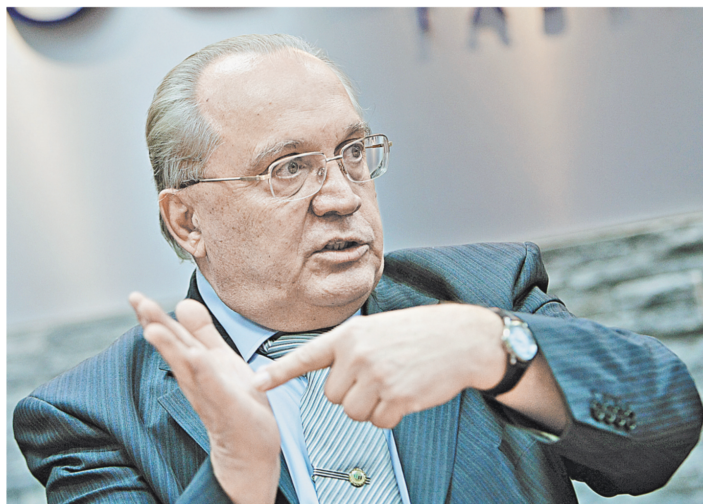
Виктор Садовничий: Реорганизация филиалов — правильная тенденция.