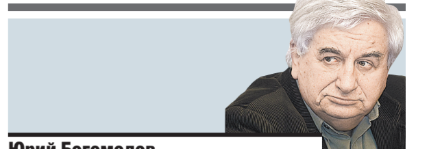
Юрий Богомолов Обозреватель