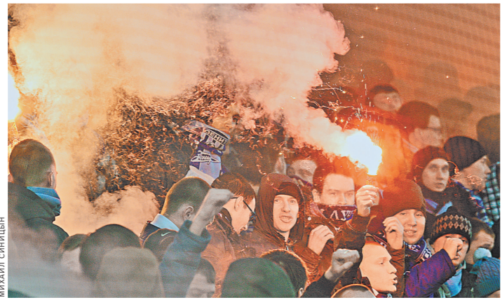
Болельщики питерского «Зенита» в Химках пиротехники не жалели...

Украинской прессе фигурирует несколько фамилий. Есть варианты и с иностранцами. Один из вероятных кандидатов Николай Павлов от перспективы работать со сборной уже отказался. Поэтому пока самой перспективной выглядит кандидатура Александра Заварова, который после ухода в киевское «Динамо» Олега Блохина и занимает вакантный пост с приставкой «и.о.».