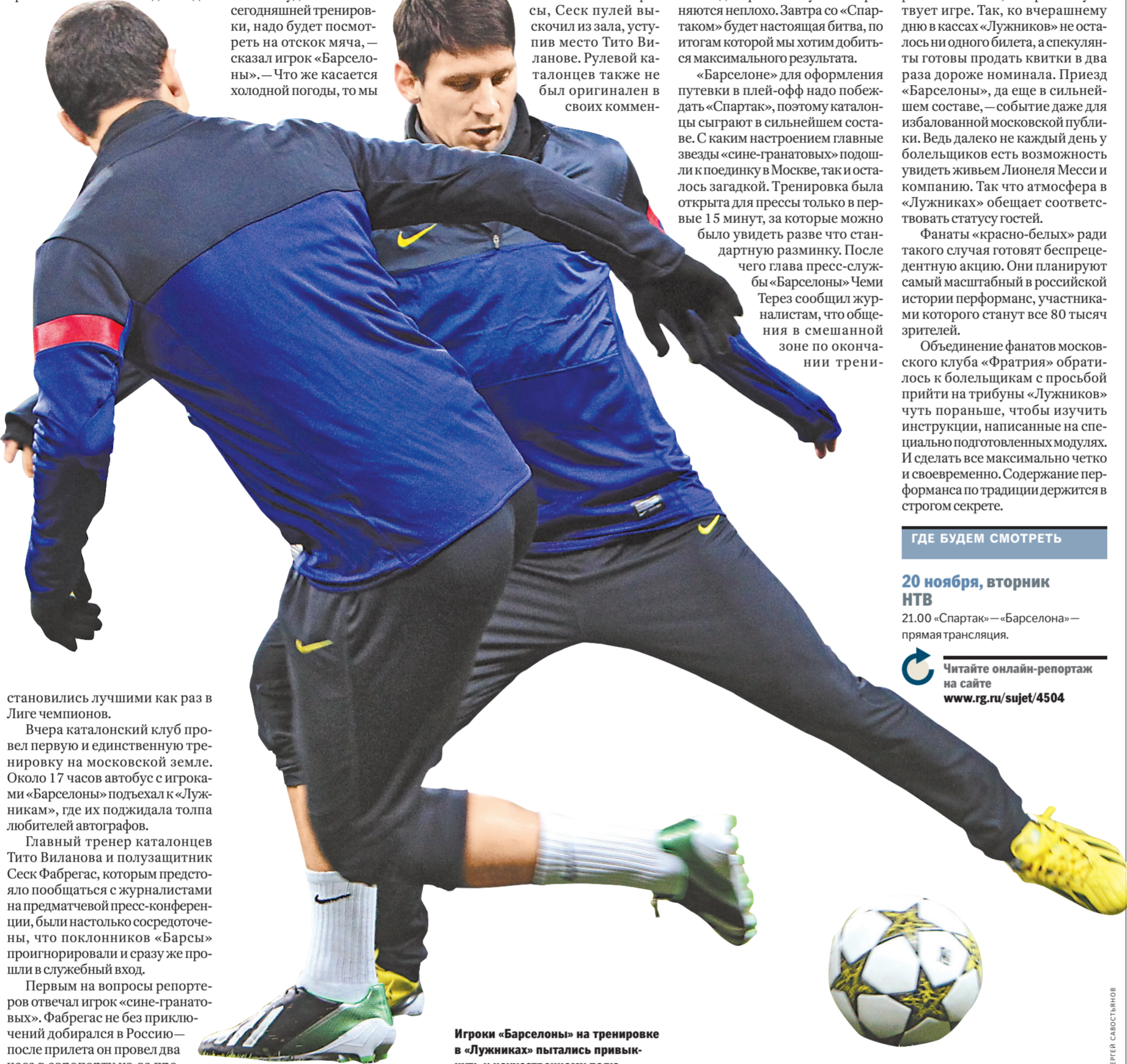
Игроки «Барселоны» на тренировке в «Лужниках» пытались привыкнуть к искусственному полю.

становились лучшими как раз в Лиге чемпионов.