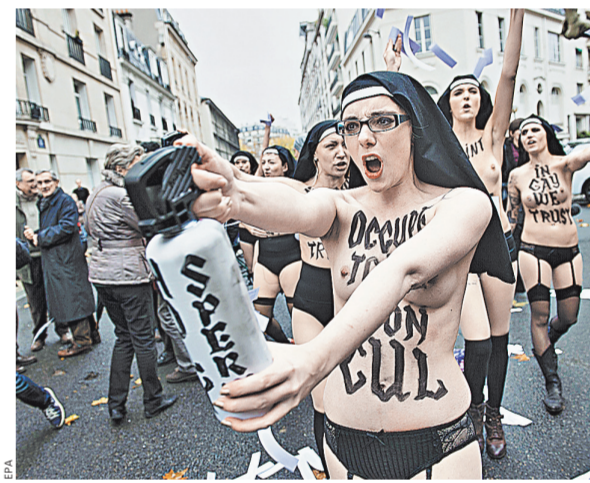
На провокации активисток FEMEN возмущенные французы отгнали кулаками.

Femen здорово досталось от не на шутку обозленных католиков