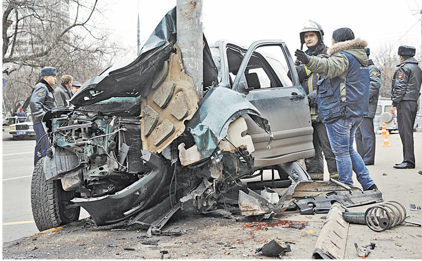
В катастрофе погибли три пешехода. Женщина-водитель тоже попала в больницу — из салона «Хонды» ее извлекали спасатели МЧС. Для этого специалистам пришлось разрезать полавтомобиля.