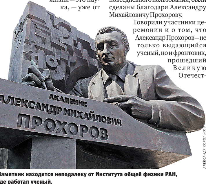
Памятник находится неподалеку от Института общей физики РАН, где работал ученый.