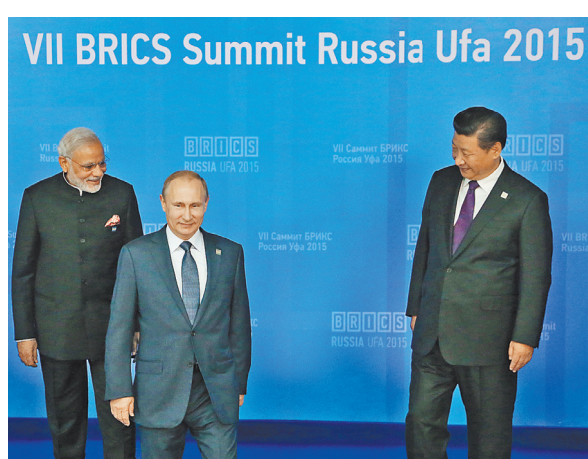
В Уфе состоялся седьмой саммит БРИКС.