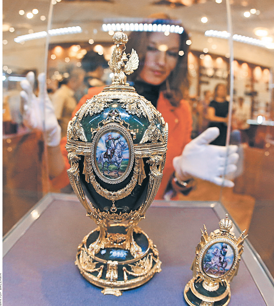
Современные ювелиры работают как минимум не хуже Карла Фаберже, говорят эксперты.