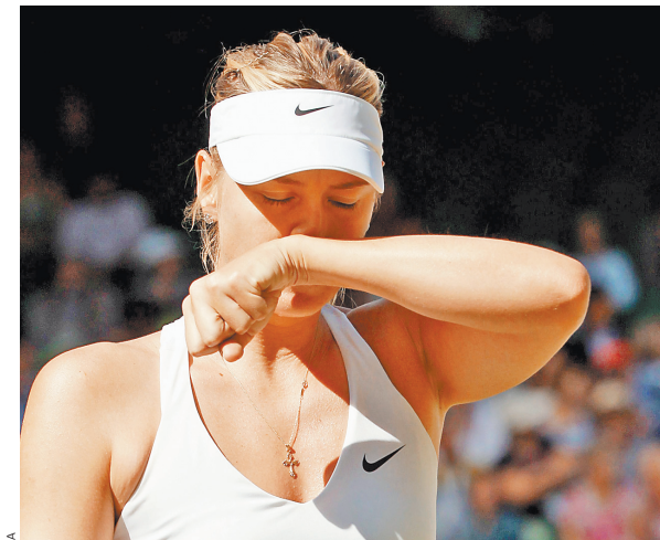
Мария Шарапова вновь не смогла справиться с мощью Серены Уильямс и проиграла американке в 17-й раз подряд.

Надо отметить, что Серена уже пять раз побеждала на Уимблдоне. Последний ее триумф датирован 2012 годом. И мало кто сомневается, что в этот раз титул также достанется Уильямс. В финале ее ждет молодая испанка Гарбин Мугуруса, которая в тяжелой встрече одолела полячку Агнешку Радваньскую — 6:2, 3:6, 6:3.