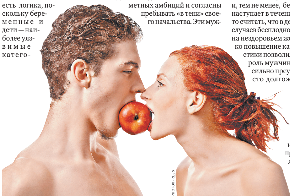
Мужчина и женщина равны на весах демографии.

8 (499) 257-52-47 www.biblioteka.rg.ru biblioteka@rg.ru