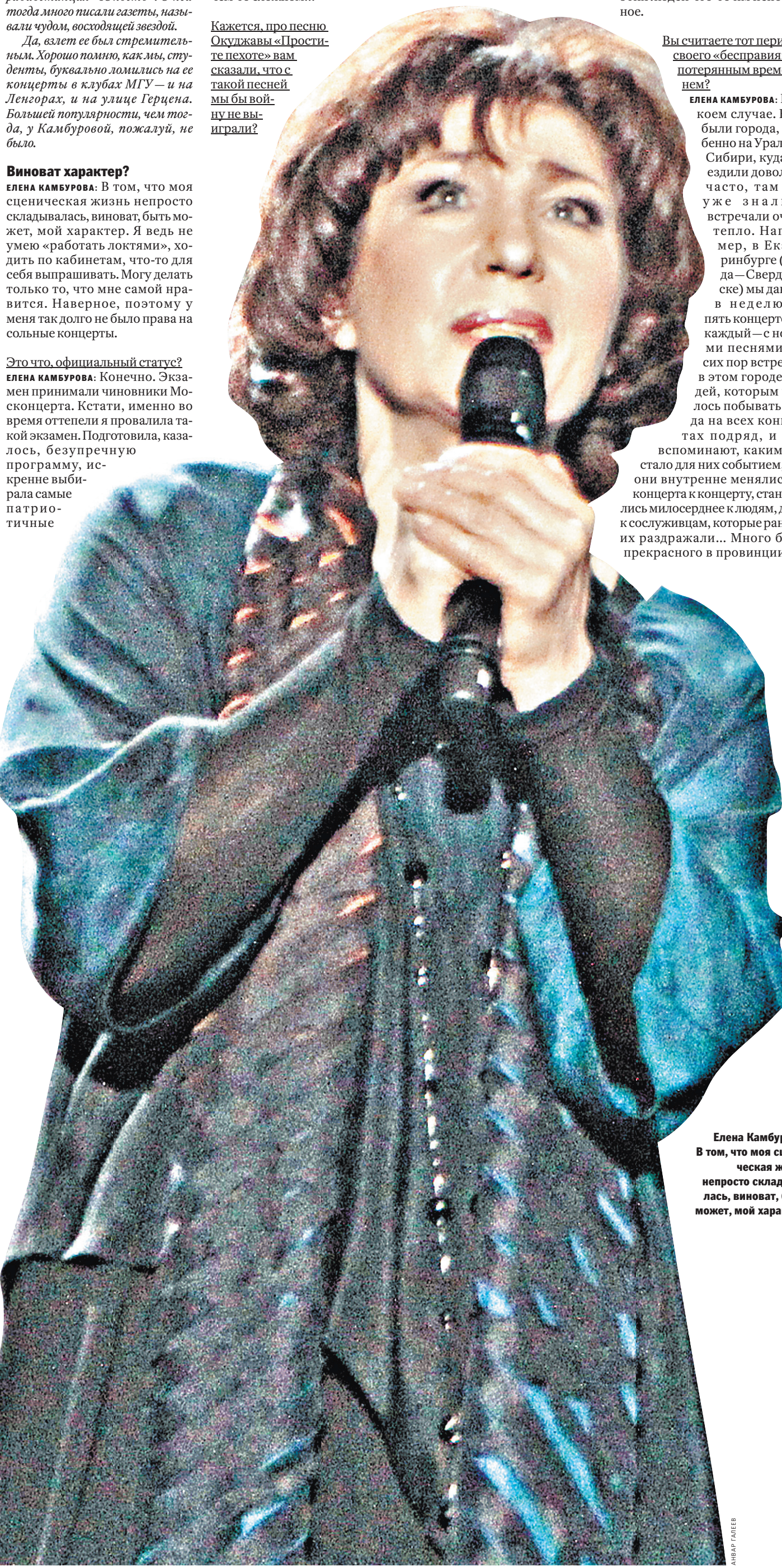
Елена Камбурова: В том, что моя сценическая жизнь непросто складывалась, виноват, быть может, мой характер.