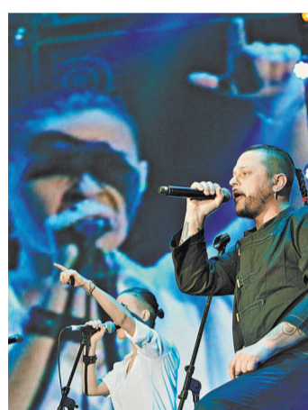
Группа «Пилот» уже готовит следующий альбом с рабочим названием «Пандора».

Программа, которая будет исполнена в Stadium Live, именуется «#пилоту»