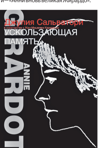
«Ускользящая память» — воспоминания, написанные дочерью знаменитой актрисы.