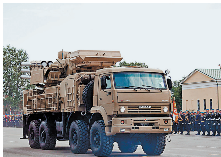
Сегодня тульская «оборонка» представляет собой мощный комплекс, выпускающий самые современные виды вооружения.

Вместе с ростом доходов казны меняются и социальные показатели. О ситуации в регионе принято судить по зарплатам бюджетников. В Тульской области средняя зарплата врачей и работников медицинских организаций, имеющих высшее медицинское образование, в первом полугодии этого года превысила 42 тысячи рублей — это составляет 169,7 процента к показателю 2011 года. Зарплата педагогов за четыре года выросла почти вдвое. Сегодня средний заработок тульского учителя составляет 27,5 тысячи рублей, что на шесть процентов больше средней зарплаты в экономике области.