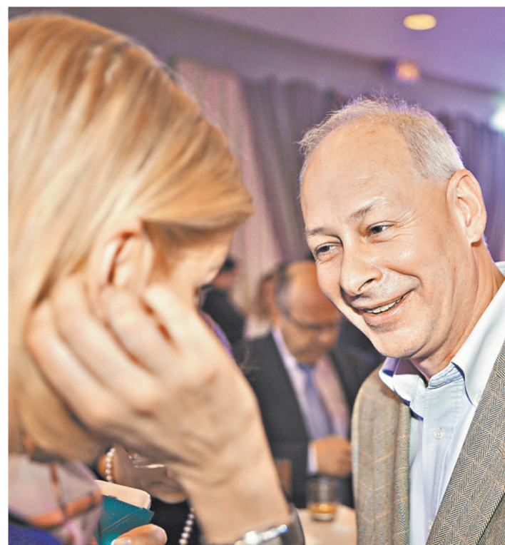
Замминистра связи и массовых коммуникаций Алексей Волин.