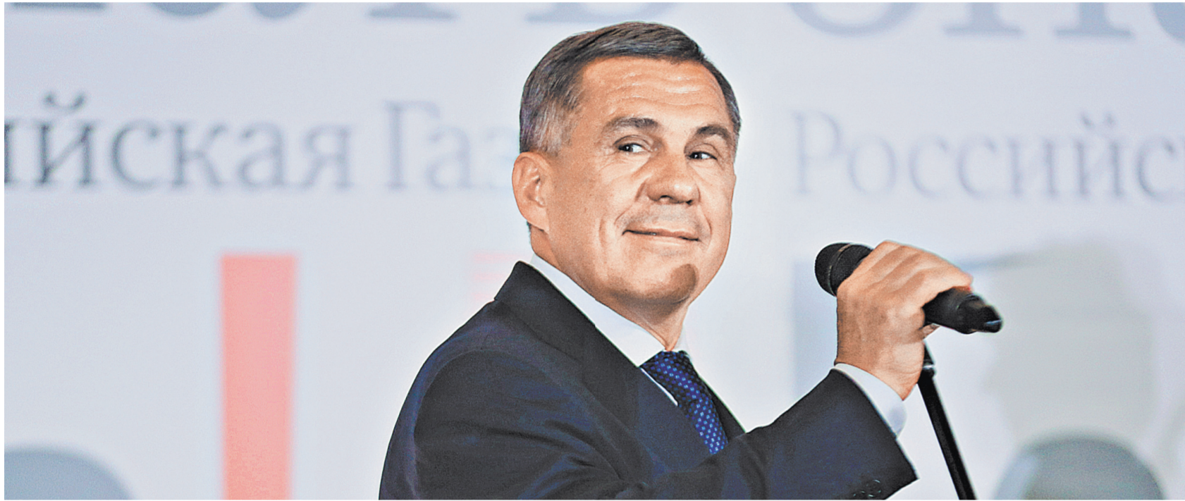
Президент Татарстана Рустам Минниханов.