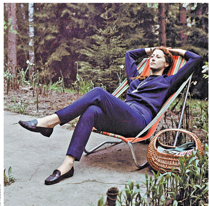
«Не люблю суесть. Ни на сцене, ни в жизни...»