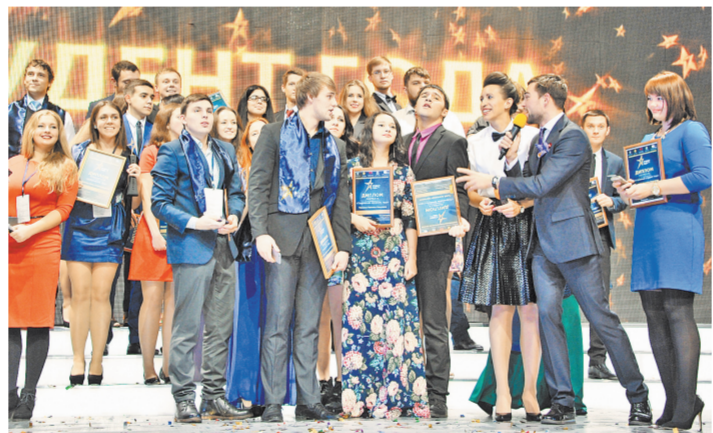
За престижную награду боролись 420 студентов со всей страны.

Стоит отметить, что чествование лучших молодых умов прошло в рамках II Общероссийского форума «Россия студенческая». Его организаторами выступили Российский союз молодежи и Ассоциация студентов и студенческих объединений России при поддержке Министерства образо-