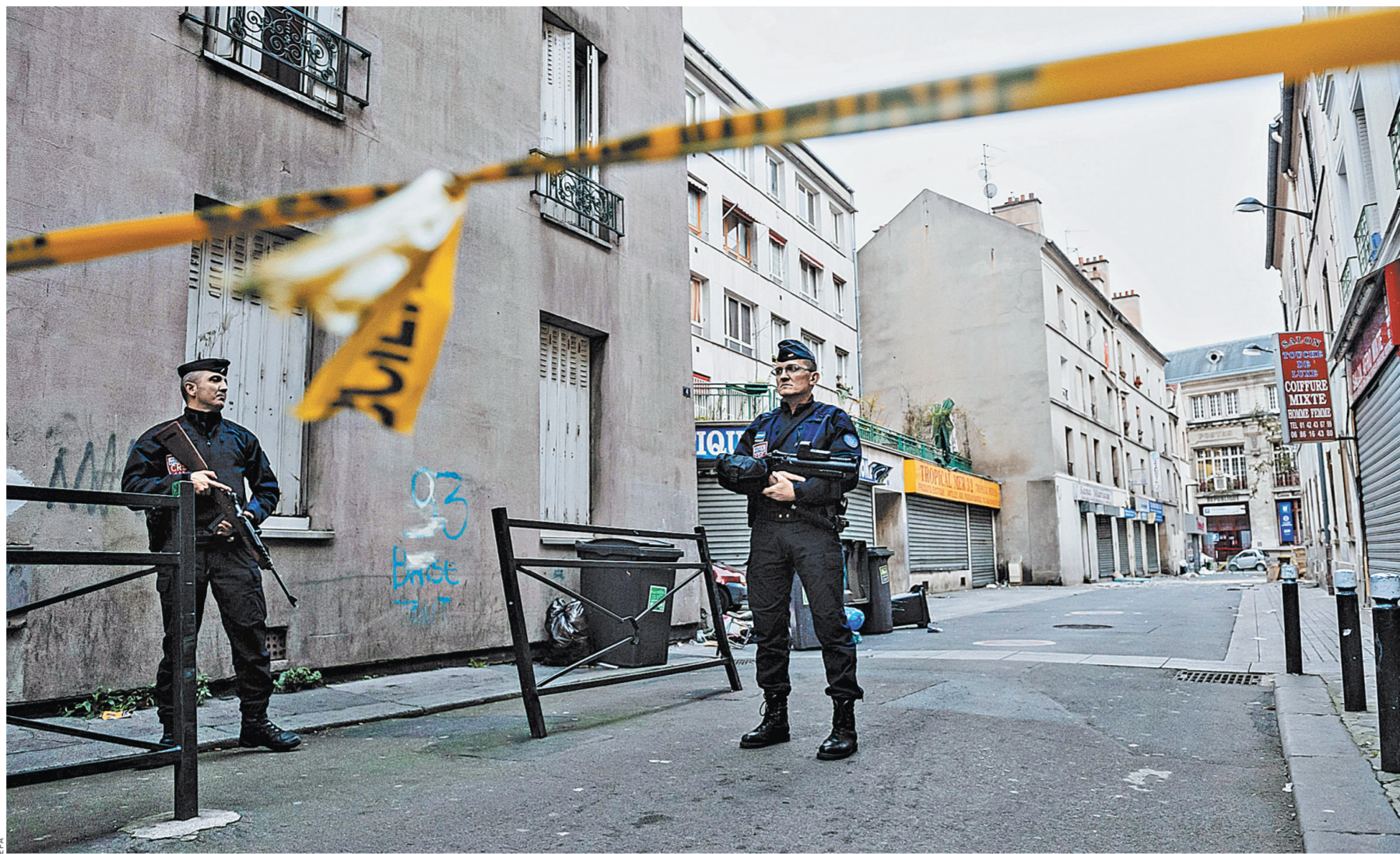
Силовики во Франции арестовали часть сообщников террористов, взяли штурмом квартиру с боевиками и продолжают операцию по ликвидации радикалов при поддержке соседних стран.