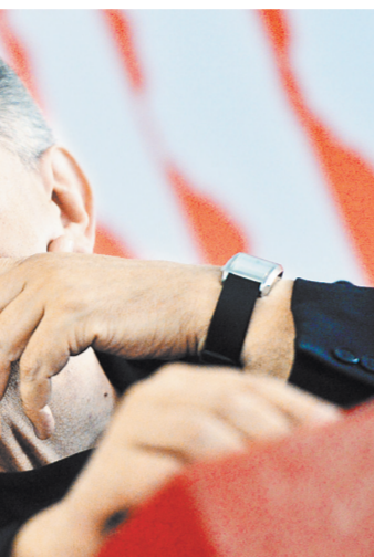
Первый выпуск программы посвящен режиссеру Александру Сокурову.