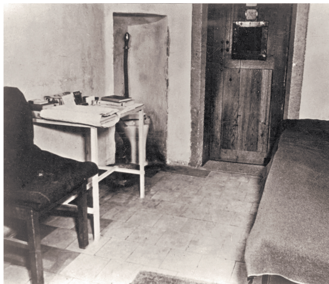
Типовая одиночная камера для подсудимых. Нюрнберг.