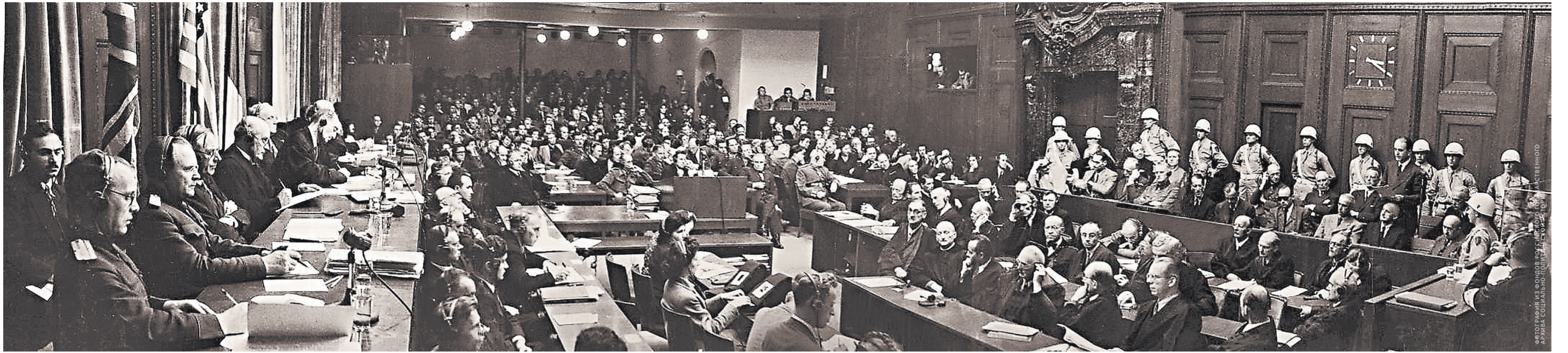
Трибунал был сформирован из представителей четырех держав-победительниц, которые направили в Нюрнберг своих главных обвинителей: от СССР — прокурор УССР Роман Руденко, от Великобритании — прокурор Хартли Шоукросс, от США — судья Верховного суда Роберт Джексон, от Франции — генеральный прокурор Франсуа де Ментон.