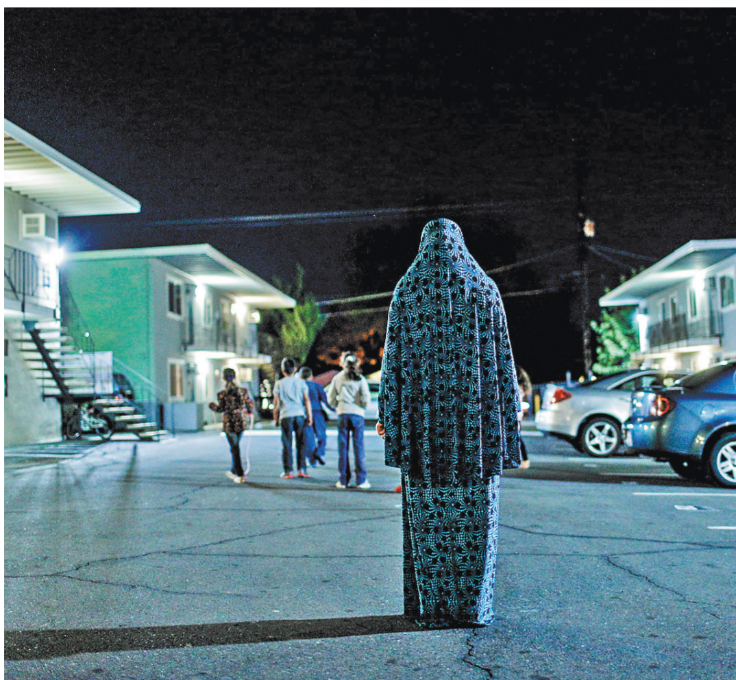
В США за 4 года въехало всего 1,5 тысячи сирийских беженцев, а теперь перед ними и вовсе хотят закрыть дверь.

Игорь Дунаевский, «Российская газета», Вашингтон, Анна Федякина