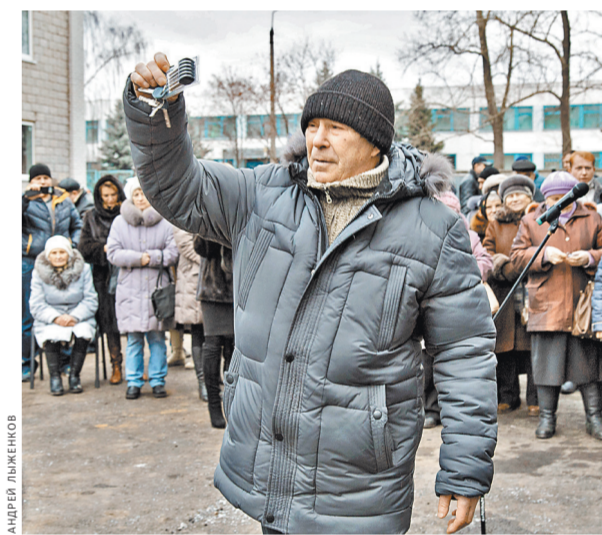
Счастливые новоселы из города Донской получили ключи и переехали в благоустроенное жилье.

В прошлом году площадь вводимого жилья была удвоена по сравнению с 2011 годом и составила 580 тысяч квадратных метров. В плане этого года — сдать в эксплуатацию 650 тысяч «квадратов» (за десять месяцев уже построено 640 тысяч). При этом средняя стоимость жилья экономикласса составляет 32,5 тысячи рублей. Всего же за четыре года введено 1,6 миллиона квадратных метров жилья. Темп роста — 146,9 процента.