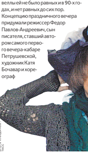
Людмила Петрушевская читает эрза и поражает своей неискраемой энергией.

В Театре Маяковского будет шумно — туда заглянет развеселое кабаре Людмила Петрушевская с программой «50 лет на сцене и за пишущей машинкой». Живой классик русской литературы, прозаик, драматург, мультипликатор, поэт, художник и певица ровно 50 лет назад написала свой первый рассказ. Правда, впервые напечатала авторгораздо позже — в 1972-м в журнале «Аврора» — вышел рассказ «Через поля», а дальше — тишина, автор числилась в списке запрещенных. Как признается писательница, ее прадед, который «был персонажем Серебряного века», в детстве почему-то запрещал ей читать, а сама она мечтала стать оперной певицей. Теперь Людмила Стефановна выходит на сцену, только не на оперную — поет песни собственного сочинения, — пусть ее за это многие и ругают, запросто читает эрза и поражает своей неискраемой энергией. Журнал The New Yorker совсем недавно назвал Петрушевскую «современным Эдгаром По». О ее литературе можно говорить бесконечно долго — одновременно мрачная и притом сентиментальная проза затягивает, порабощает и всегда находится отклик. В жанре мистической новеллы ее было равных и в 90-е годы, и нет равных до сих пор.