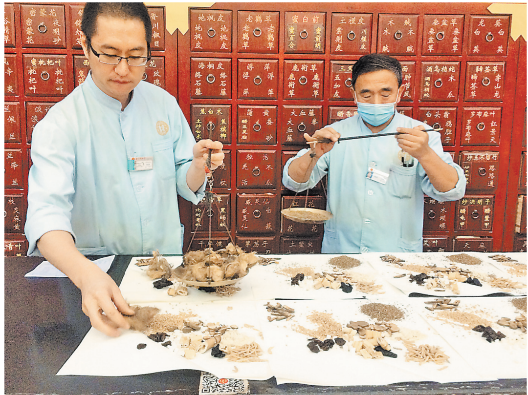
Традиционные китайские аптеки удивительно красивы и снаружи, и внутри. В аптеке «Тунжыань» продают травы и лекарства китайской медицины. Можно не отрываясь смотреть, как аптекарь на весах, но современных электронных, а на веревочках, взвешивает крохотные горстки разных трав — создает лекарство, которое прописано пациенту. Узнав, что я из России, аптекарь радостно приветствует: «Россия! Путин!». Покупаю обезболивающий пластырь: влудит снимет боль в колене? Потом разглядываю витрину, за стеклом которой красная баночка, а в ней что-то похожее на червяков. Мне объясняют: «Это кордицепс. Спасает от рака». Готова купить. Спрашиваю цену. 32 500 юаней. В переводе на рубли — 320 500. Ничего себе! Попробую с покупкой.