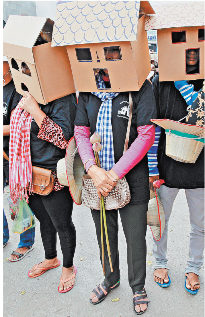
Строить доходные дома мешает отсутствие спроса на доступное арендное жилье, а неприглядность таких проектов для инвесторов.

Эксперты назвали регионы с самым доступным жильем — узнайте на сайте www.rgu.ru/art/1179498