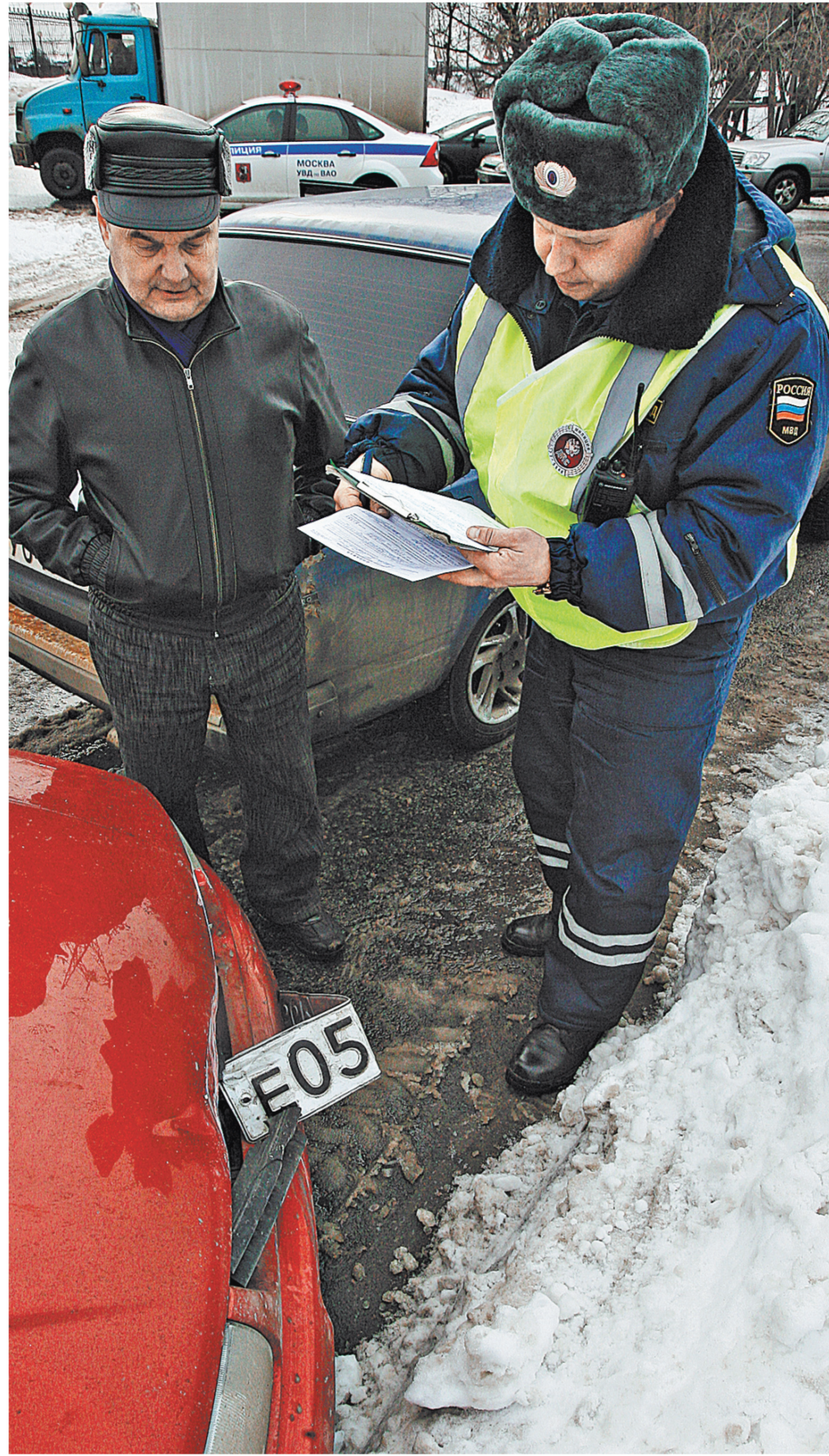
Поправки в КоАП принесут удовольствие от встречи с инспектором ГИБДД на дороге. Раньше были три дырки в правах, чтобы лишиться права управления на год. Теперь достаточно трех нарушений в течение срока действия предыдущего наказания.

Поэтому и предлагается внести в КоАП поправки, альтерна-