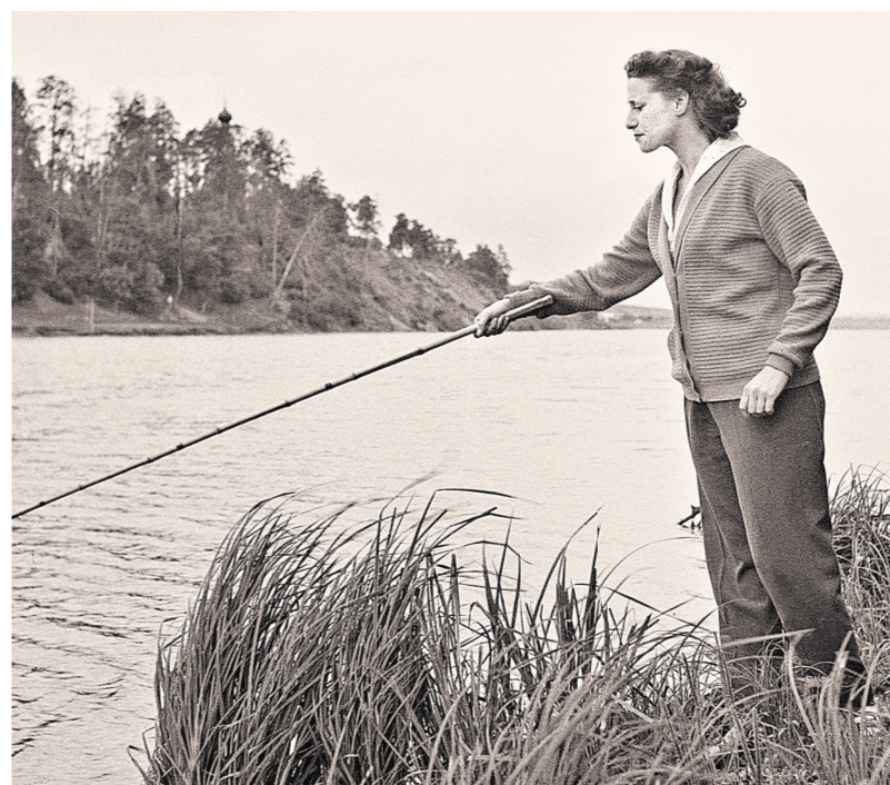
Она была фанатом футбола и рыбакки