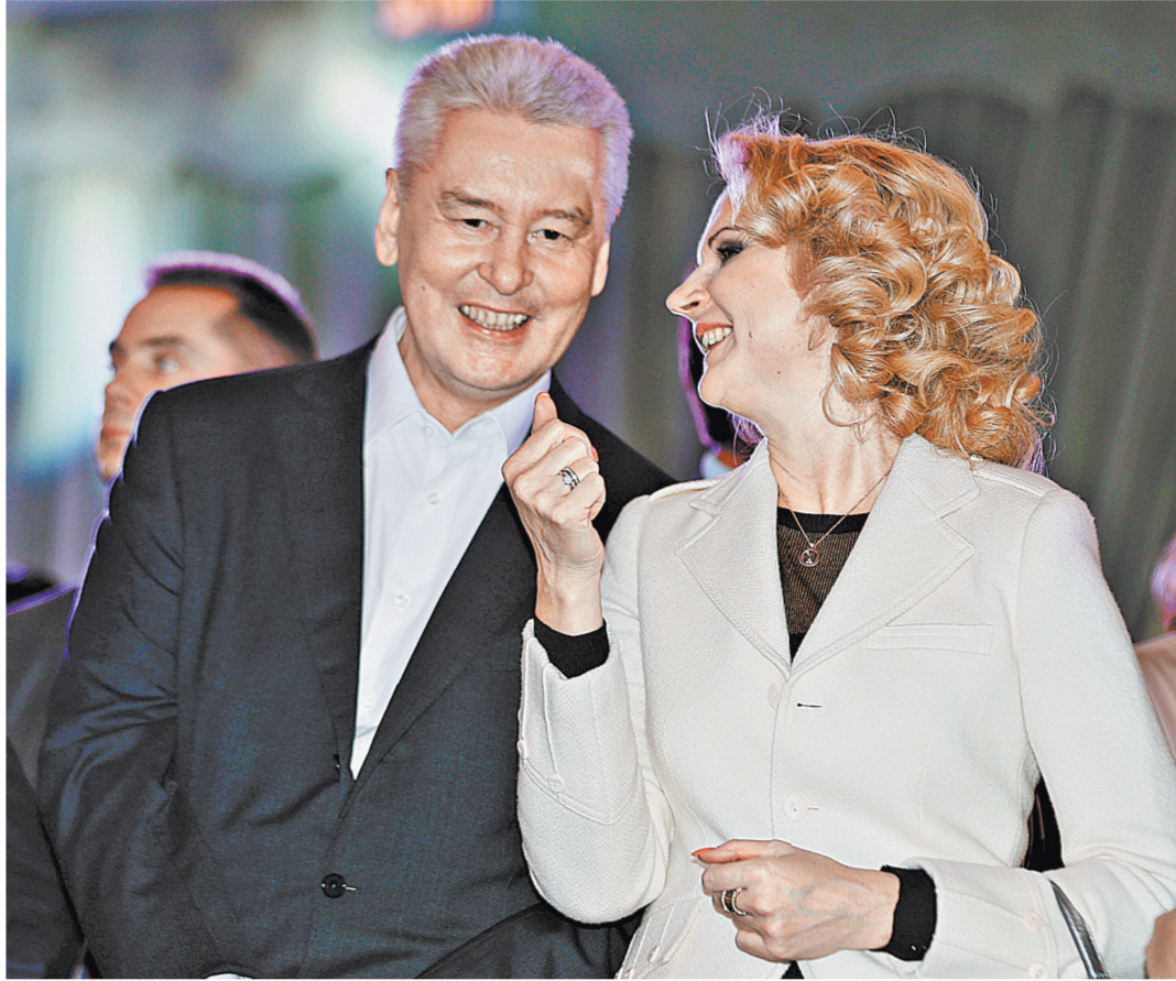
Сергей Собянин и Татьяна Голикова.