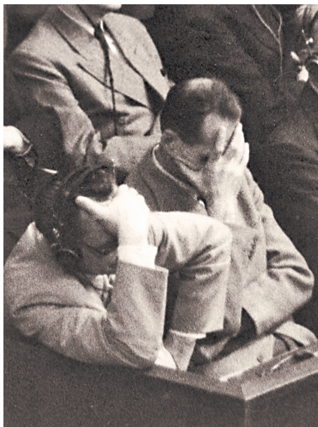
Нюрнберг, здание суда присяжных, «Зал 600». 30 сентября — 1 октября 1946 года.

Помимо юридической стороны дела, включение в список трибунала вопроса о Пакте не было продиктовано опасностью, что вину за развязывание войны уже в 1945 году попытаются переложить на СССР?