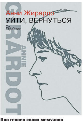
Про героев своих мемуаров Жирардо рассказывает с теплотой и нежностью.

Эти книги не случайно выходят одновременно. Говорить о них стоит как об одном целом. В серой обложке «Уйти, вернуться» — воспоминания одной из