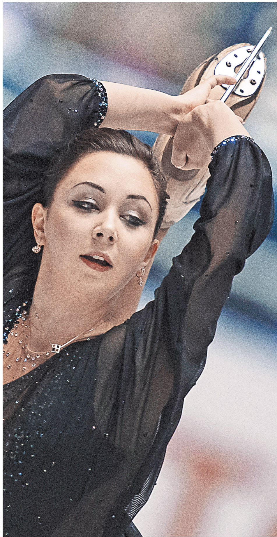
Елизавета Туктамышева вошла в десятку лучших спортсменов страны 2015 года по результатам традиционного опроса, проведенного Федерацией спортивных журналистов России (ФСЖР).