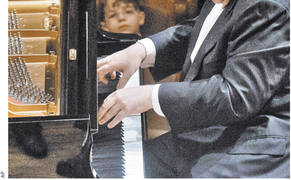
Ефим Бронфман: Не люблю быть одиночкой. Работать с композиторами для меня очень важно.

Как вы формируете свои концертные программы?