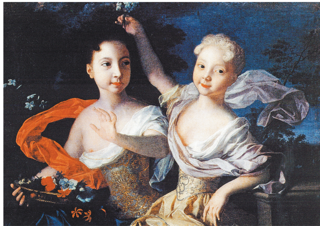
Такими увидел дочерей Петра, Анну и Елизавету, художник Луи Каравак, служивший при дворе.