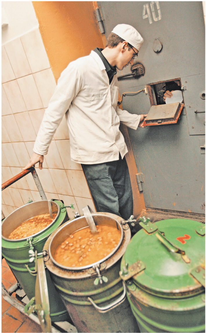
По проекту минюста, беременным женщинам и кормящим матерям, попавшим за решетку, в камеру будут доставлять свежие фрукты.

заключенных, которых по ряду причин нельзя накормить горячим. Речь идет о тех, кто в пути.