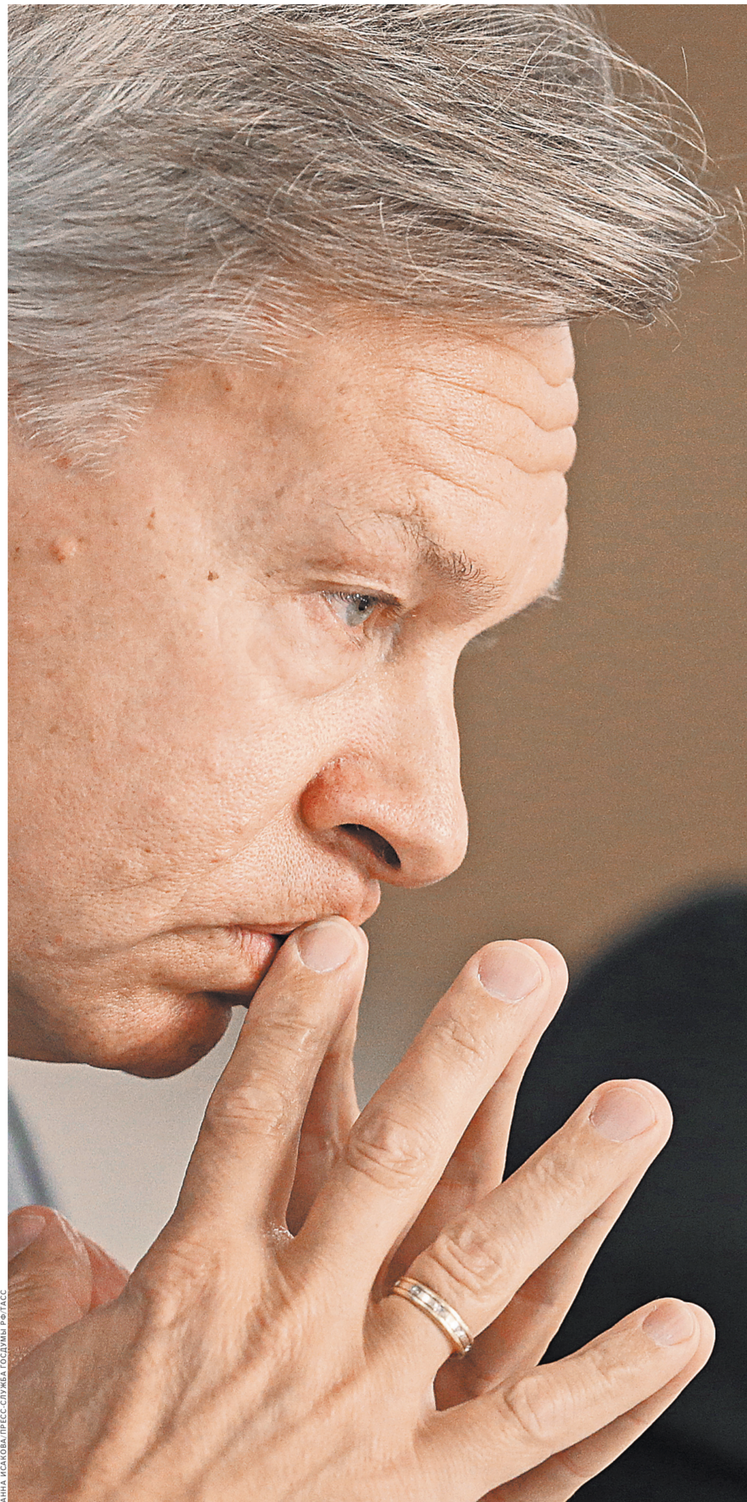
Алексей Пушков: Москва и Вашингтон уже готовы слушать и информировать друг друга.

Не будем заблуждаться. Политика «изоляции» и сдерживания России была провозглашена президентом Обамой весной 2014 г. Не помню, чтобы он от нее публично отказался. Допускаю, что лично госсекретарь Керри скептически относится к политике изоляции и прекрасно понимает, что ее осуществление невозможно. Но как официальная доктрина нынешней администрации она не отменена. США пытались изолировать нас по Сирии, пытались заставить вступить в американскую коалицию. У них не получилось. И поэтому теперь Керри как опытный дипломат делает хорошую мину при плохой игре. Пока налицо активизация ограниченного диалога между Москвой и Вашингтоном на высшем политическом уровне, но не видно перехода российско-американских отношений в новое качество. Это диалог, в котором позиции сторон во многом не совпадают. Но стороны уже готовы слушать и информировать друг друга и начать согласовывать позиции. Эта активизация политического диалога, во многом вынужденная для США, дает некоторые основания рассчитывать на то, что наиболее острая фаза противостояния позади. Но нельзя исключать новых серьезных обострений. Расширение санкций против России со стороны администрации Обамы накануне нового года — еще один признак того, что США по сути свою политику по отношению к Москве не изменили. Сколько бы Джон Керри ни гулял по Арбату и ни покупал матрешек, иллюзий быть не должно: США применяют санкции только к тем, кого считают своими противниками.