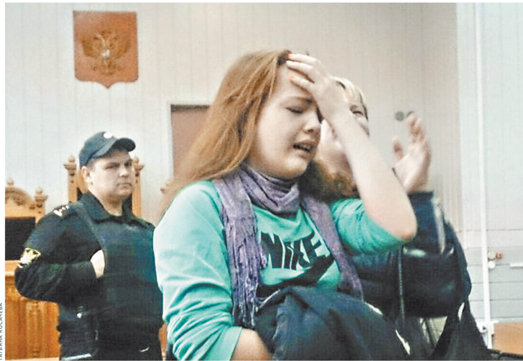
Семья Ганчара продолжит бороться с несправдливостью в суде.