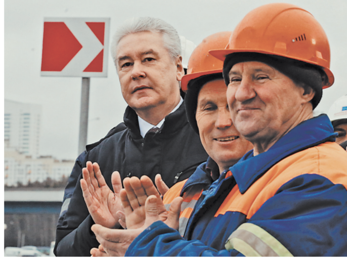
Сергей Собянин оценил трудоемкую работу строителей на этом сложном объекте.