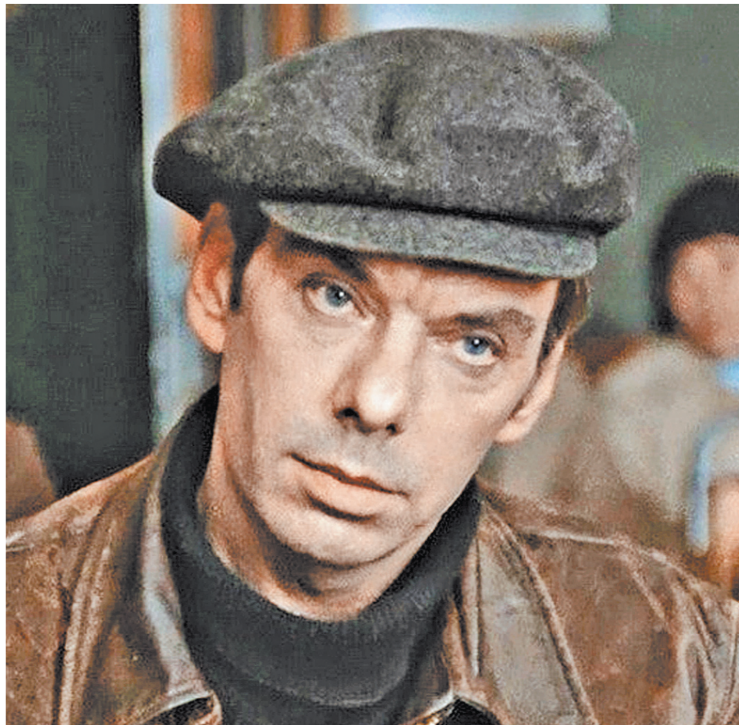
«Москва слезам не верит», но поверила герою Алексею Баталову.