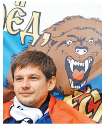
Болельщики российской сборной выбрали девиз для нашей команды путем голосования на сайте ФИФА.

Кроме слогана для сборной России, любители футбола выбрали девизы для других команд — участниц Кубка конфедераций: Австралия: Soccergoos: pride of nation (Сборная: гордость нации!); Германия: 11 players — 80 million hearts — Die Mannschaft (11 игроков — 80 миллионов сердец — одна команда); Камерун: The indomitable lions (Неукротимые львы); Мексика: Here are warriors of Mexico (Вот идут воины Мексики); Новая Зеландия: Small nation, big heart (Маленькая нация, большое сердце); Португалия: Legion of fans will guide you to victory! (Легион болельщиков приведет вас к победе!); Чили: La Roja: the pride of Chile (Сборная: гордость Чили).