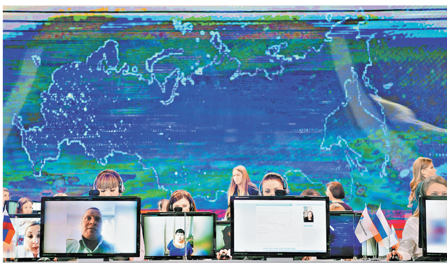
Глава государства убежден, что прямой диалог с гражданами позволяет понять, чем живет страна, и выявить «болевые точки».

Вчера Владимир Путин провел очередную, уже 15-ю по счету, Прямую линию. Разговор в прямом эфире продолжался 4 часа. За это время глава государства ответил на 68 вопросов. Сам президент считает, что пря-