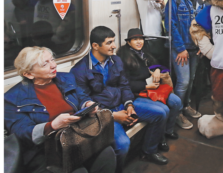
Талисман КК-2017 и ЧМ-2018 Волк Забивака пользуется метро с удовольствием. Для него, как и для болельщиков, проезд бесплатный.

Под пристроим «ястребиного глаза» Новые «фишки» на Кубке конфедераций будут опробованы и непосредственно на футбольном поле. В частности, речь идет об электронной системе определе-