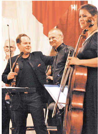
Классика в исполнении международных звезд звучала в Юрьев-Польском и Суздальском районах Владимирской области.