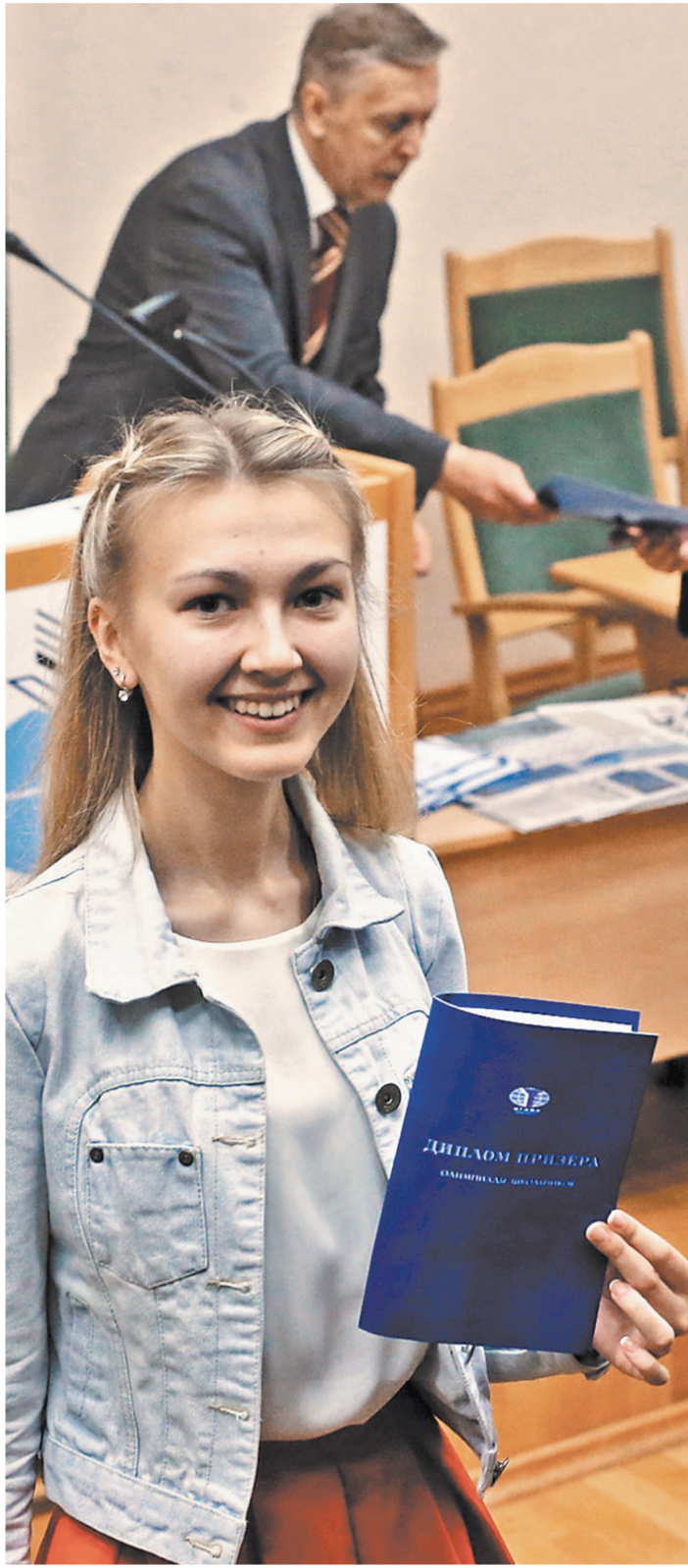
Читаешь «Российскую газету», побеждаешь в конкурсе — учишься в МГИМО.

Фоторепортаж смотрите на сайте rg.ru/sujet/1560