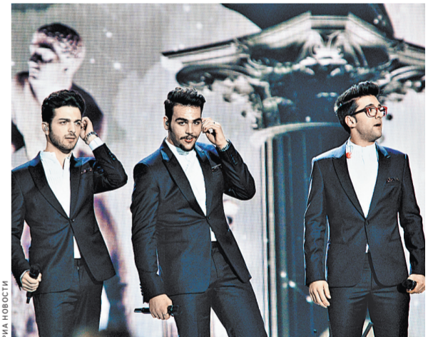
Трио Il Volo («Поле») — новые любимцы девушек и женщин всего мира.

ИНЬАЦИО БОСКЕТТО: Мы дружим с Пласидо Доминго, он наш учитель и наставник во многих вопросах. Собственно, он и подтолкнул нас к идее создания трибюта «трем тенорам». Еще при первой встрече он поделился этой идеей. И, кстати, идея выступления вместе с нами тоже принадлежит ему. Да и вообще за годы, что выступаем, мы получили много советов от опытных артистов. А ведь мы пели и с Барбарой Стрейзанд, Селин Дион, Тото Кутуньо, Эросом Рамазотти... И, кстати, лучший совет, который они нам дали, — это не забывать о скромности, продолжать учиться, стремиться к совершенству, никогда не позволяя себе останавливаться. «Три тенора» — великие музыканты, мы не хотим сравнений, не посягаем на их безмерный талант.