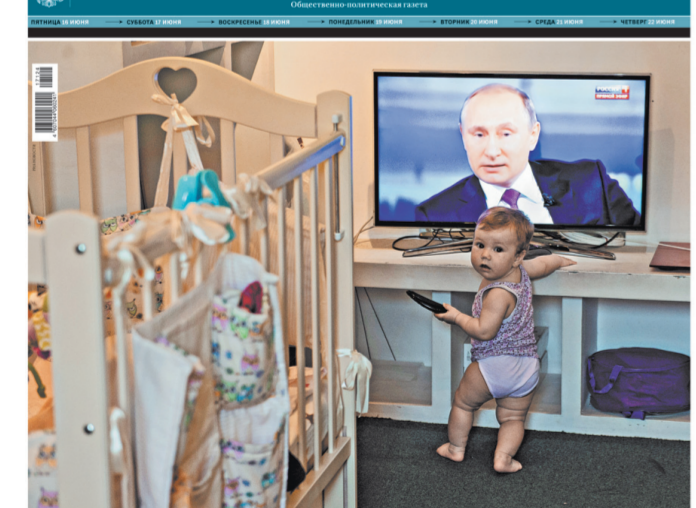
ПРЕЗИДЕНТ Владимир Путин ответил на 68 вопросов.