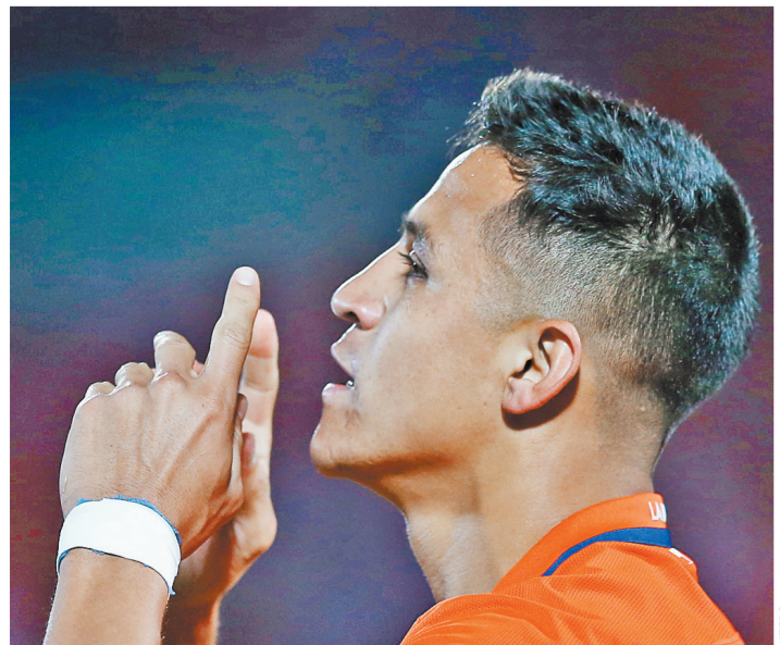
Алексису Санчесу осталось забить всего один мяч, чтобы стать лучшим бомбардиром сборной Чили за всю историю.

Санчес открыл в Токопилье школу и профинансировал строительство пяти футбольных полей. «Когда-нибудь мне бы хотелось вернуться в Чили», — признался как-то Санчес. Но пока он играет за «Арсенал». При этом не исключает вариант с переходом в другой клуб. После блестящего сезона в Англии Санчесом заинтересовались сразу несколько команд. Решать вопросы с будущим Алексис будет уже после Кубка конфедераций.