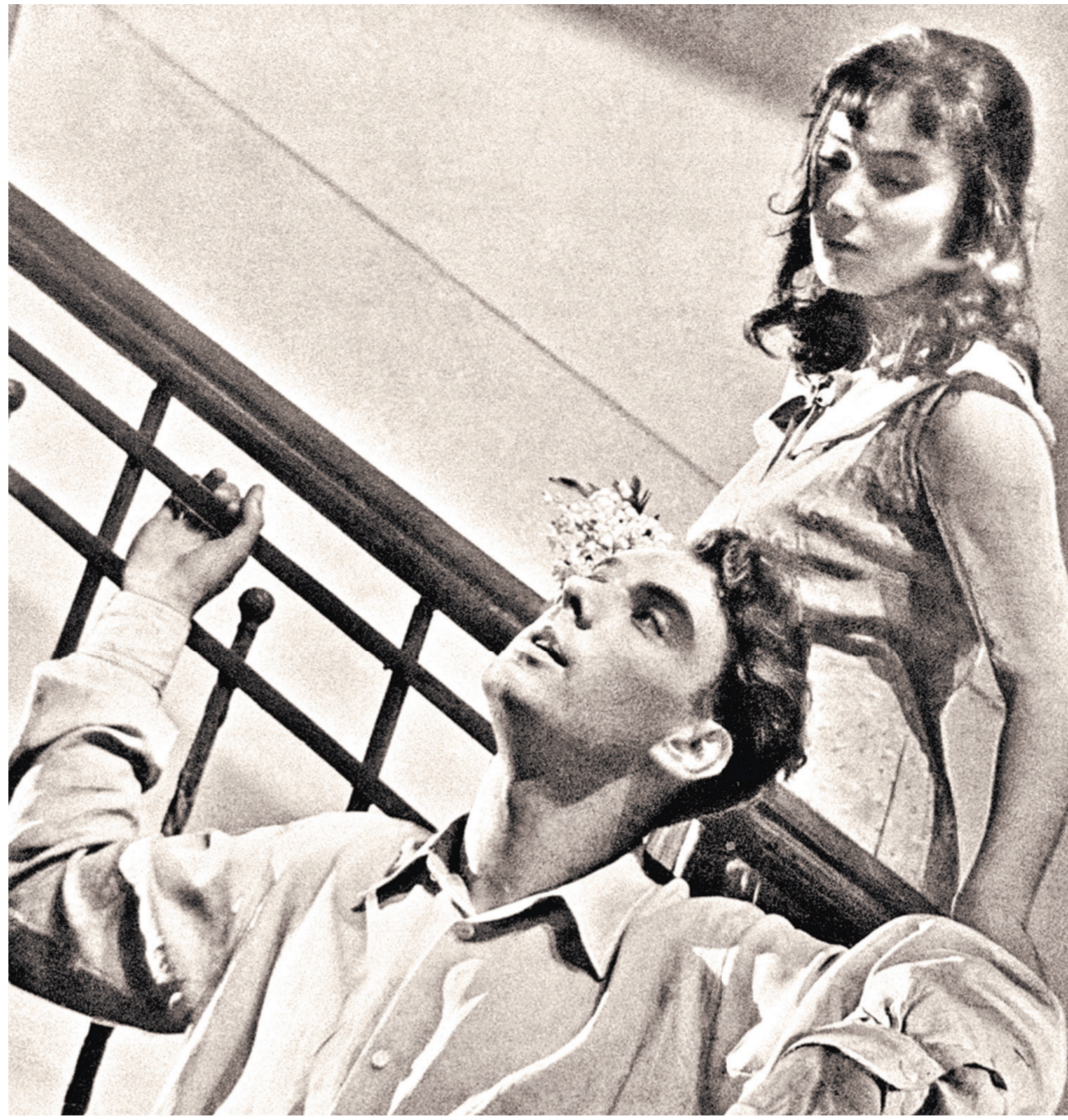
Образ героя Баталова в фильме «Летят журавли» сопровождает нас в картине, а потом — по всей нашей жизни.