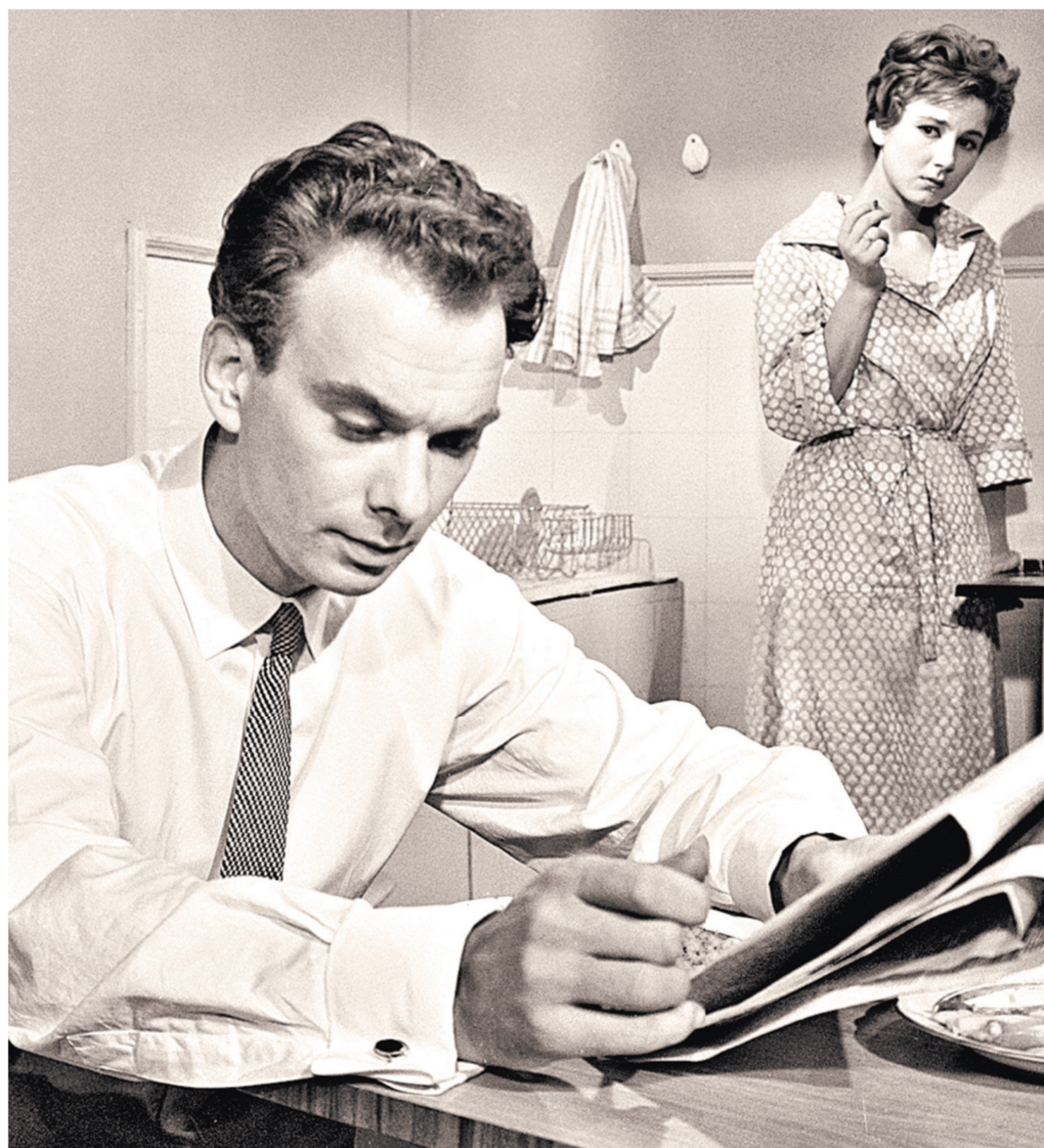
«Девять дней одного года» только в кинотеатрах посмотрели около 25 миллионов человек.