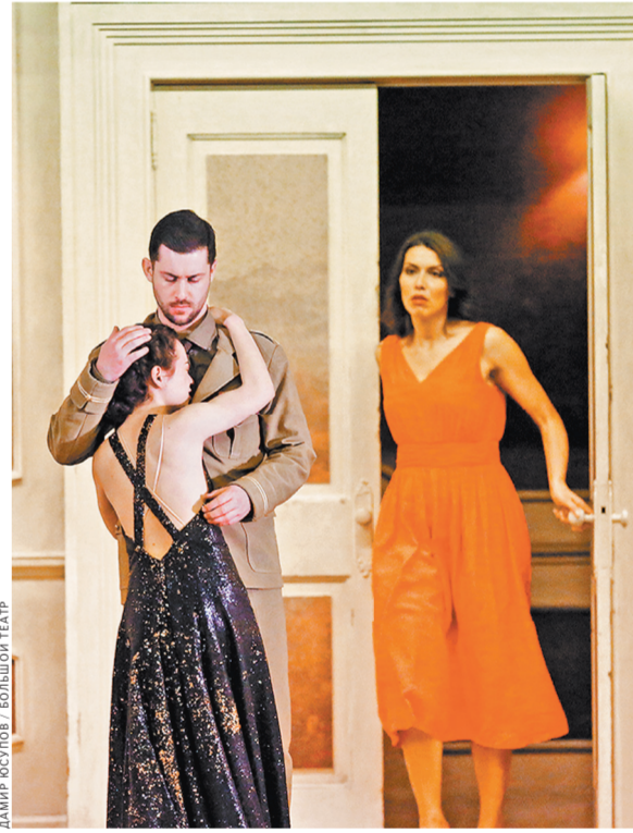
Постановка на Новой сцене Большого оперы-сериа «Альцина» Генделя — кооперация с фестивалем в Экс-ан-Провансе, где премьера спектакля прошла в 2015 году.