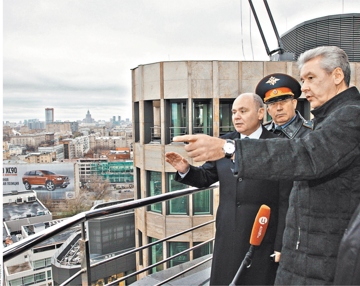
Семь лет назад новый мэр увидел сверху площадь Тверской Заставы грязной, перекопанной, обросшей, как мхом, ларьками и пробками.

Примером перемен можно привести множество. Благоустроенные улицы по всему центру столицы, липы, засохшие еще в начале 2000-х и вернувшиеся прошлым летом на Тверскую, по свежешие Бульварное и Садовое кольца... Что еще изменилось в Москве за эти семь лет? Что поменяется в обозримом будущем? Об этом 25 октября рассказывает сам Сергей Собянин в своем рабочем отчете о проделанной работе перед депутатами Московской городской думы.