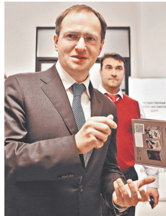
Министр культуры РФ Владимир Мединский на открытии павильона «Книжки».

Куратор проекта рассказывает о нововведениях: «книжный консерж» поможет достать любую книгу из любой точки мира; каждый вечер будут проводиться тематические вечера и бесплатные исторические и литературоведческие лекции; будет действовать книжный магазин с эксклюзивными и редкими произведениями; и самое интересное для книголюбивых — понравившуюся книгу можно будет забрать (принцип бумкроссинга — взамен оставляешь свою книгу). Кафе в стиле «модерн» отделено от читального зала звукопроницаемой — практически — стеной.