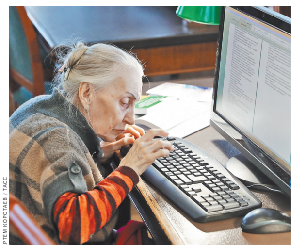
Пожилые хотят общаться в соцсетях, пользоваться онлайн-банком и осваивать новые профессии.

«Студенты» хотели бы выучить иностранные языки и больше узнать об электронных платежных системах