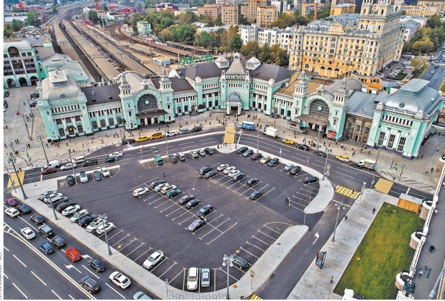
Теперь ту же площадь не узнать. Есть на ней парковки для машин, ходят трамваи, зеленеет скверик с памятником Горькому (на снимке его не видно).