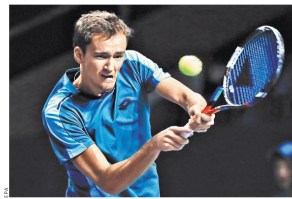
Даниил Медведев считает, что ужасным образом провел последние турниры, но в Москве улучшил качество игры.

МЕЖДУ ТЕМ Светлана Кузнецова, которая сыграла с «Кубка Кремля» из-за травмы руки, 23 октября поедет на Итоговый чемпионат WTA в Сингапуре в качестве второй запасной. Изменения в списке произошли после того, как британская теннисистка Йоханна Конта объявила о досрочном завершении сезона.