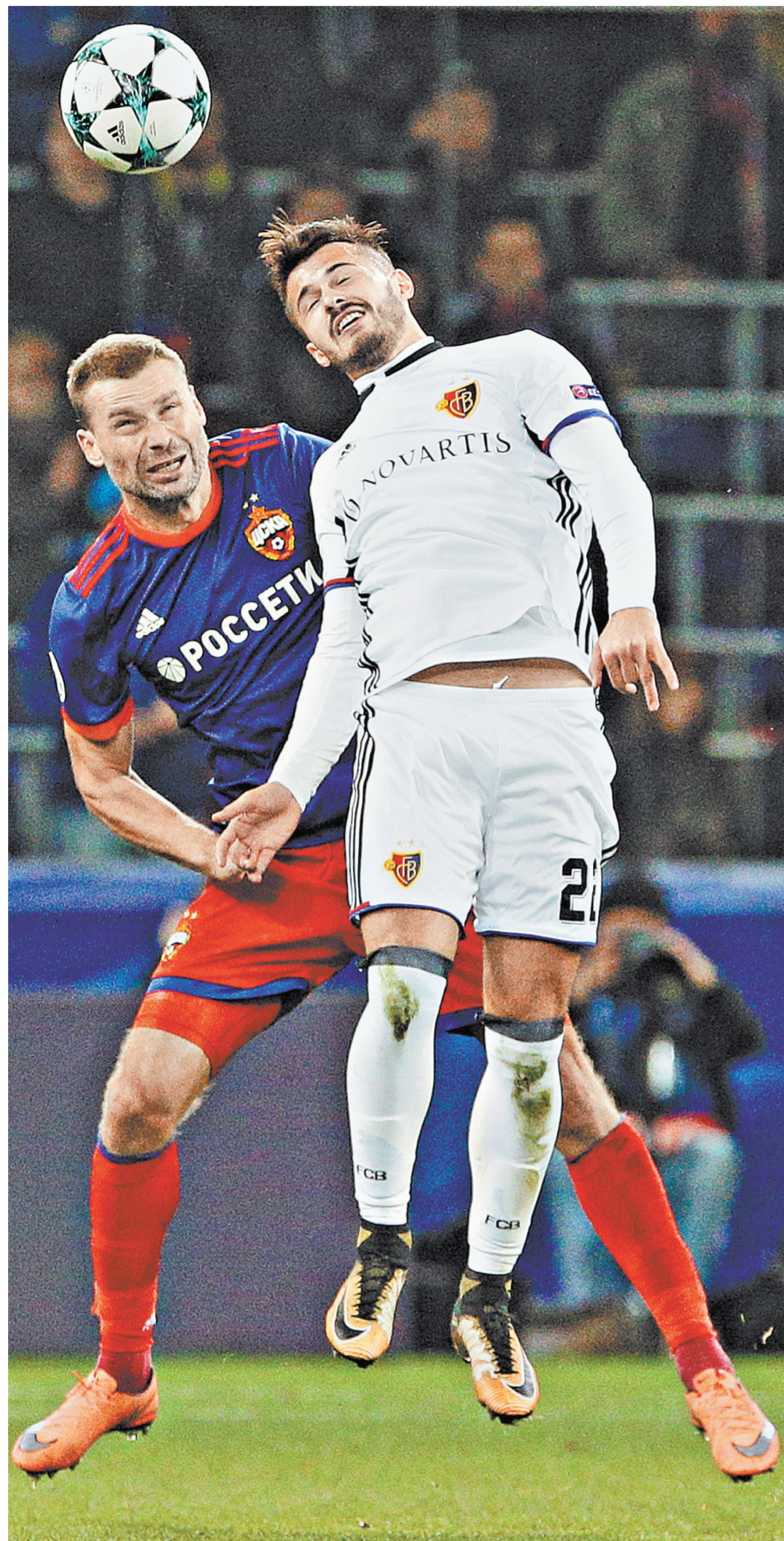
Игроки ЦСКА (в синей форме) не смогли справиться с быстрыми и техничными нападающими «Базеля».