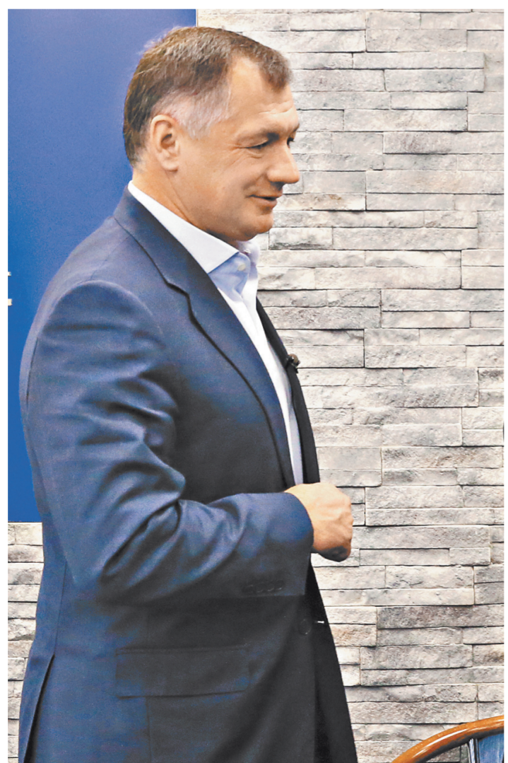
Марат Хуснуллин: Надеюсь, мы справимся с переселением москвичей в новые дома за три «волны».

МАРАТ ХУСНУЛЛИН: Очень хорошими темпами. Постановлением правительства уже утверждены 210 площадок, на которых в ближайшие три года планируется построить порядка 3 млн кв м жилья. Еще по 158 площадкам мы работаем — они могут дать дополнительно 2,5 млн «квадратов». То есть в ближайшем будущем поя-