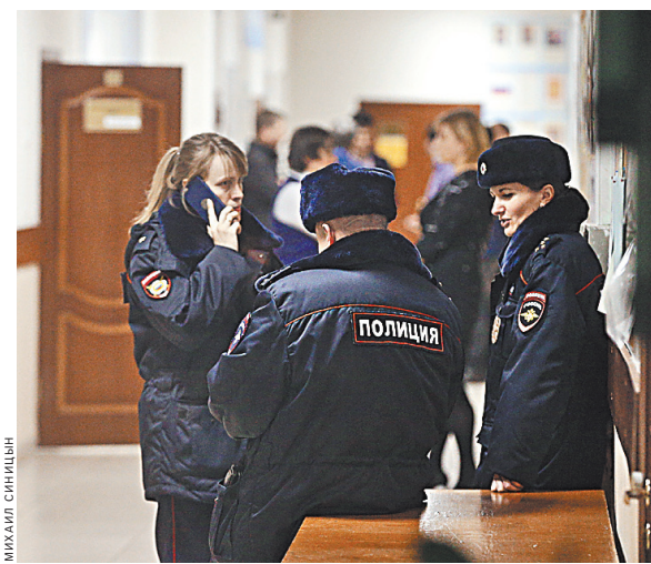
Что подтолкнуло студента к кровавой расправе над педагогом, сейчас выясняют следователи.

Оперативники вчера опросили руководство колледжа, коллег убитого педагога и однокурсников студента. Также первые показания дала мать подозреваемого в убийстве педагога ученика.