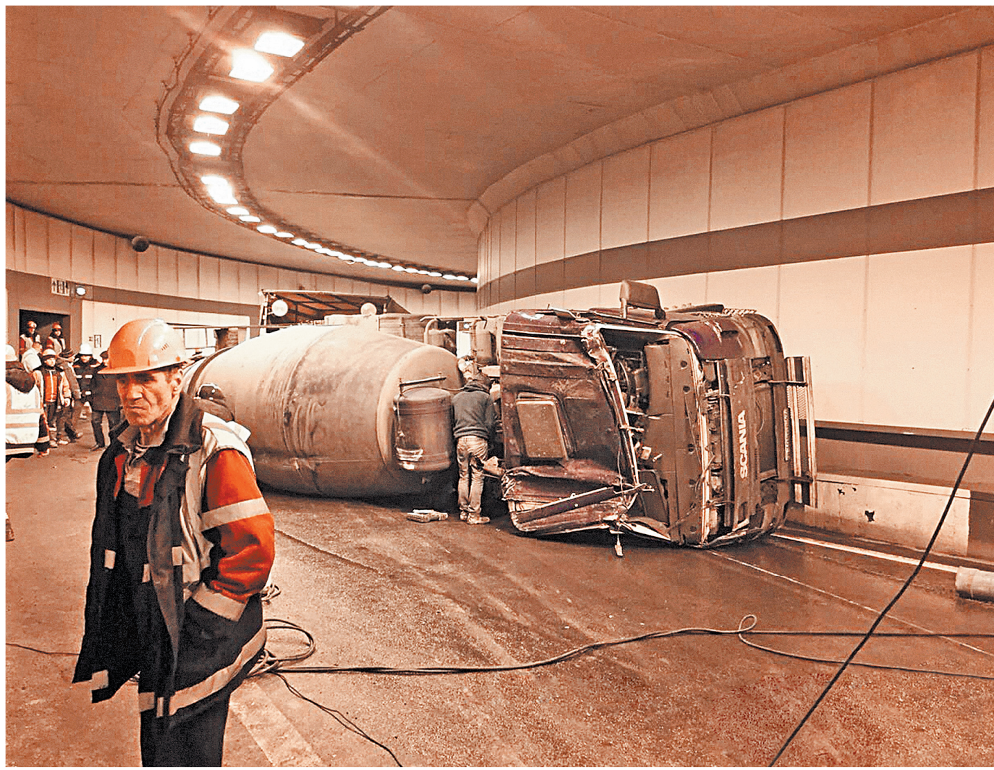
Также он напомнил о законопроекте минфина, в котором предлагается ввести залог за автомобиль нетрезвого водителя.

Когда наберется административная практика, когда будет понятно, как работает эта норма, тогда можно будет говорить о дополнительных наказаниях. Например, лишать прав, отправлять под административный арест или на общественные работы тех, кто повторно совершил такое нарушение. Но для этого должна быть уже собрана необходимая база.