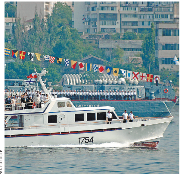
На смену таким катерам связи придут современные комфортабельные и красивые морские яхты.

Он предназначен для доставки членов командного и инспекторского состава на корабли, стоящие на рейде или находящиеся в районах проведения учений. И хотя он войдет в состав Военно-морского флота, в его облик нет ничего военного, скорее он напоминает прогулочную яхту.