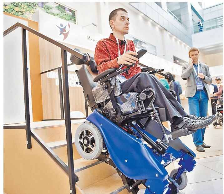
Кибатлетика — это преодоление трасс, где моделируются бытовые ситуации, с которыми ежедневно сталкиваются инвалиды.

В Минпромторге России уделяют много внимания производству продвинутой средств реабилитации. Сегодня не идет речи о том, чтобы искусственная рука или нога лишь визуально заменяла утраченную конечность. Главное — новые устройства должны