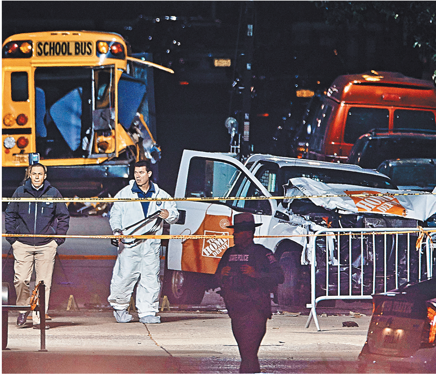
Полиция и спецслужбы осматривают машину террориста, брошенную им после столкновения со школьным автобусом. На снимке справа — убегающий убийца, державший в руках пистолеты для пейнтбола.

1 → Выскочив из автомобиля с оружием в обеих руках, он выкрикивал «Аллах акбар». Позже полиция обнаружила на месте инцидента пневматический пистолет и ору-