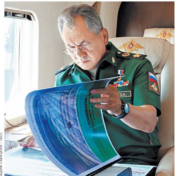
Сергей Шойгу жестко контролирует выполнение графика поставок в армию и на флот новой техники и вооружений.

Доклад о том, как на предприятии выполнялся этот заказ, Шойгу слушал в закрытом для прессы режиме.