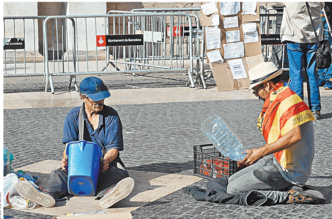
На площади Сант Жауме несут вахту только два сторонника независимости Каталонии — бьют по земле пустыми бутылками и гремят жестяными банками.

О недавних манифестациях теперь напоминают лишь металлические ограждения да граффити, изображающие слово Si