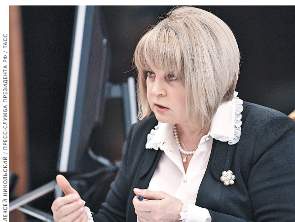
Злата Памфилова пригласит наблюдателей на участки в учреждениях с особым режимом посещения.

На заседании ЦИК также принял постановление о порядке агитации на телевидении и радио. Согласно действующему законодательству она ведется в течение 28 дней и завершается в полночь перед «днем тишины» накануне выборов. Предполагается, что голосование пройдет 18 марта. Исходя из этого Центризбирком постановил, что «бесплатное эфирное время предоставляется на каналах общероссийских и региональных государственных организаций телерадиовещания по рабочим дням в период, который начинается с 17 февраля 2018 года и заканчивается в ноль часов по местному времени 17 марта 2018 года».