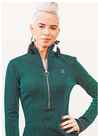
Лариса Долина, широко известная по астральным хитам вроде «Погоды в доме», ныне основательно вернулась к джазу, с которого и начинала в юности. Поет и в сопровождении Биг-бэнда Игоря Бутмана. Поэтому не случайно, что приз в номинации «За вклад в развитие джазовой культуры в России» вручили именно ей. В том числе и по совокупности заслуг, поскольку Долина — редкая джазовая артистка, выпустившая несколько лет назад альбом и в США. Награду ей передал лидер, клавишник поп-группы «АСтудио» Байгалы Серкебаев, который потом и сам вылезал сыграть вместе со своим новым проектом The Jigits. Многие ли знали, что он знает толк и в такой музыке?