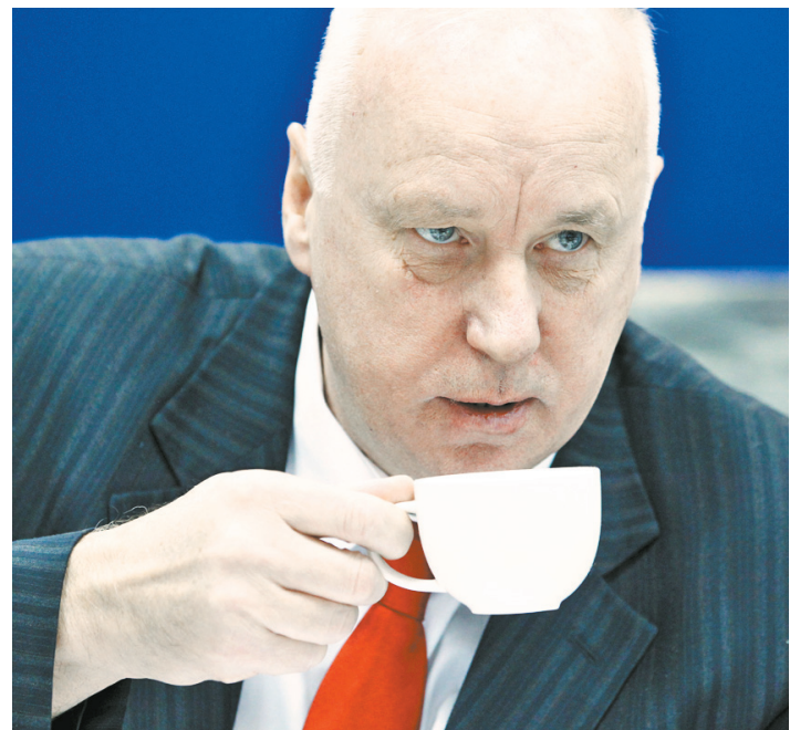
Александр Бастрыкин: Наказывать за ложный звонок надо жестче.

Но главная опасность представляют искусно спланированные «программы» ложных сообщений о бомбах, как мы видим, состоящие из десятков и сотен одновременных «сигналов» и имеющие очевидную цель посеять среди нас панику, дестабилизировать общество и государство. Поэтому вполне обоснованно введение повышенной ответственности за корыстные цели при совершении рассматриваемого преступления и особо при совершении данного преступления в соучастии, по предварительному сговору или организованной группой. Вместе с тем хотелось бы предостеречь следственный аппарат от успешных выводов о причастности преступлению того или иного лица. Последние технические достижения в области обеспечения анонимности в Интернете с легкостью позволяют подставить в качестве злоумышленника совершенно постороннего гражданина. При любом усилении уголовной ответственности существенно растет и цена судебной ошибки. Достаточно ли в стране высококвалифицированных экспертов? Насколько надо увеличить штат соответствующим экспертным организациям? Задачей мило-либо этим вопросом одновременно с актуальной законодательной инициативой?