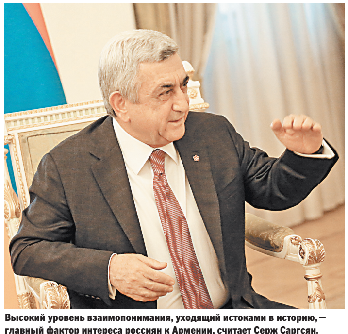
Высокий уровень взаимопонимания, уходящий истоками в историю, — главный фактор интереса россиян к Армении, считает Серж Саргсян.

СЕРЖ САРГСЯН: Не могу сейчас назвать точные сроки, но принятию этой концепции абсолютно ничего не мешает. Думаю, это вопрос нескольких месяцев. Каких-то кардинальных изменений в принятии концепции не произойдет, потому что отношение к русскому языку в Армении, повторы, всегда было доброжелательным.