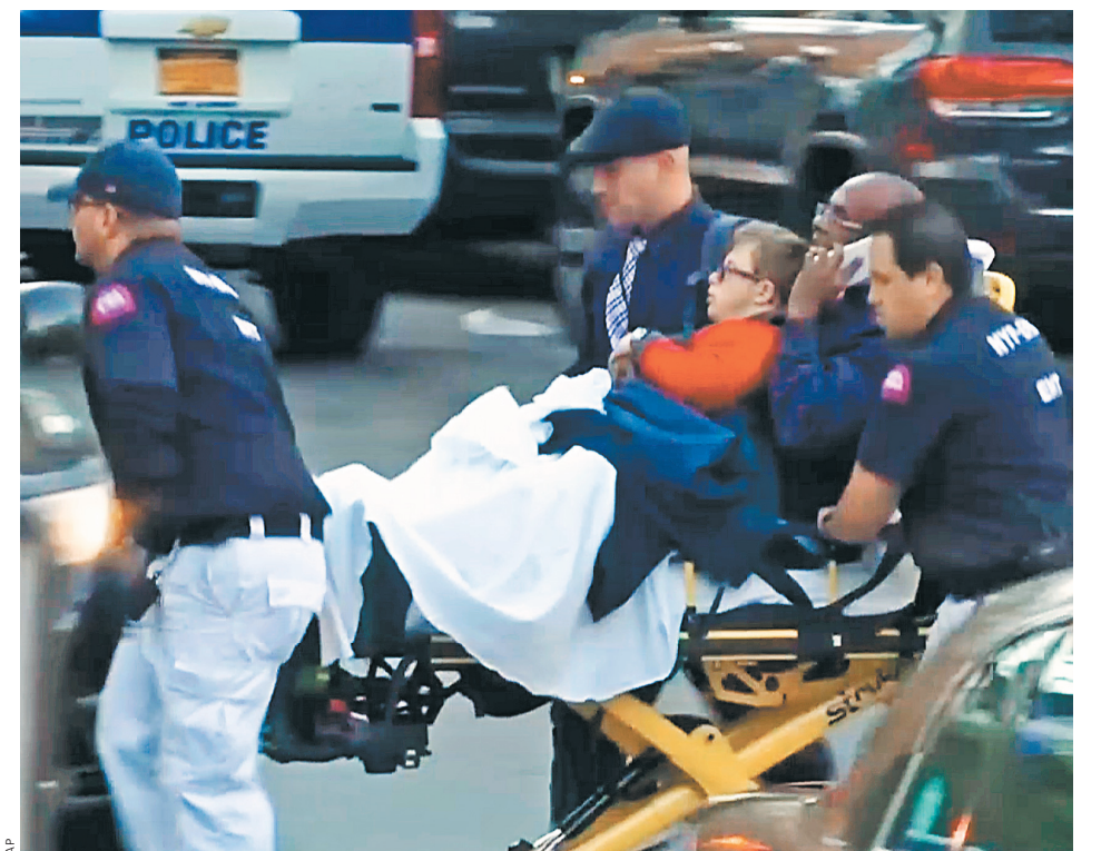
В результате теракта в Нью-Йорке 8 человек погибли, более десяти получили ранения.

ПРАВО Александр Бастрыкин сделал громкие заявления об усилении борьбы с коррупцией и телефонным терроризмом