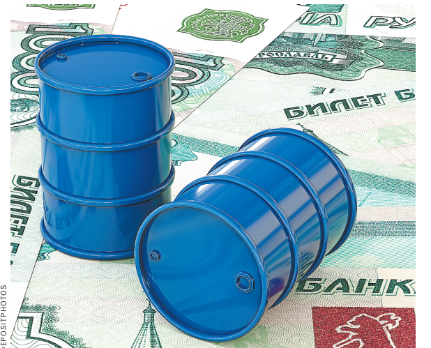
Курс российского рубля в последнее время все меньше зависит от мировых колебаний цен на «черное золото».

В ближайшие дни наша валюта может укрепиться до отметки в 57,7 рубля за доллар и до 67,4 рубля за евро