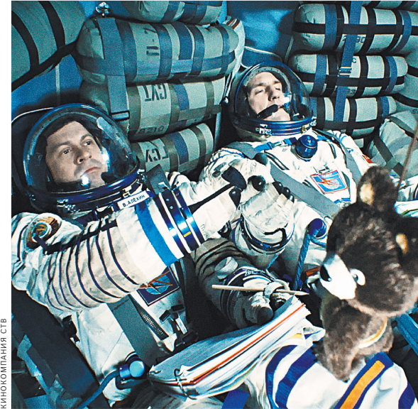
Фильм «Салют-7» — один из самых ожидаемых на фестивале в Польше.

МАЛГОЖАТ ШЛЯГОВСКА-СКУЛЬСКА: Ездим на российские кинофестивали: на Кинотавр в Сочи, на Московский международный кинофестиваль, в Выборг на «Окно в Европу». К тому же многие режиссеры и продюсеры знают о нашем фестивале и сами присылают заявки. Я думаю, что могу сказать без ложной скромности: «Спутник» — самый масштабный смотр российского кино в мире. В других странах такие фестивали представляют 20–30 фильмов из России. А мы ежегодно показываем 130–140 лент — художественных, документальных, анимационных. Столько людей обращались просьбами показать классику, причем именно Сергея Эйзенштейна, что решили провести его картину как «Александр Невский», «Броненосец «Потемкин», «Иван Грозный», «Октябрь» и так далее, причем в сопровождении живой музыки.