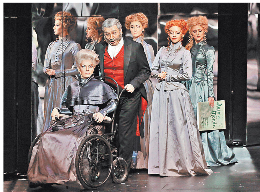
В зеркально-черном обрамлении сцены появляются персонажи — Мышкин, Рогожин, Настасья Филипповна.