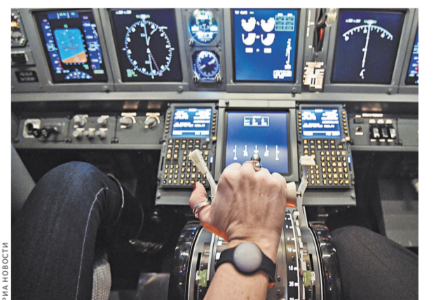
Самолеты стали летающими компьютерами, защитит которые от хакеров планирует минтранс.

Кроме того, Россия на международном уровне предлагала создать сеть авиационного Интернета, с помощью которой самолеты в небе будут «общаться» друг с другом. Это поможет в поиске пропавших бортов через запись информации других самолетов или потока данных, которые они передавали в момент исчезновения судна в центр организации воздушного движения.