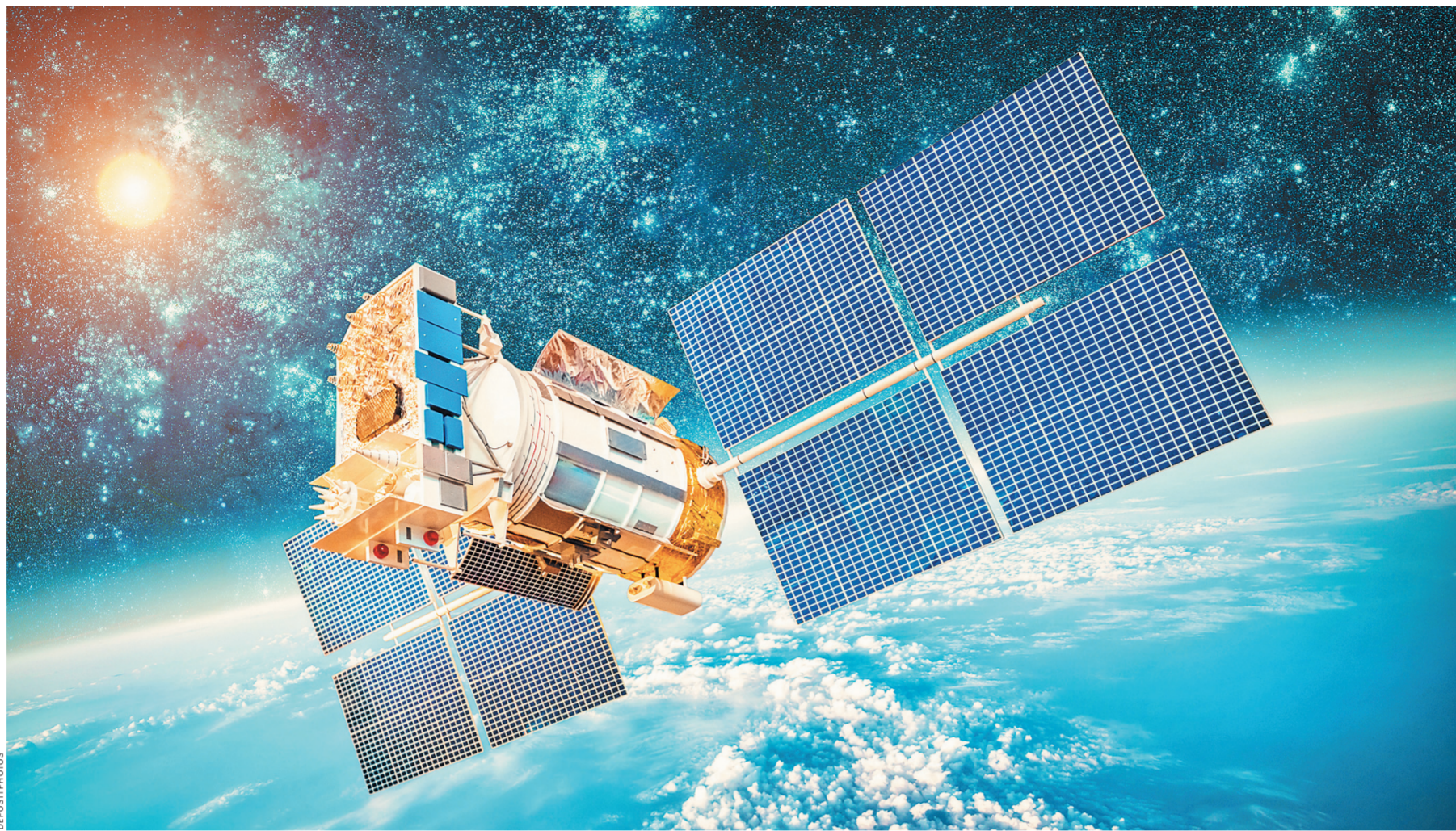
Индия тратит на космос уже более 1,2 миллиарда долларов в год и в рейтинге космических держав пропалась на пятом месте после США, Китая, России и Японии.