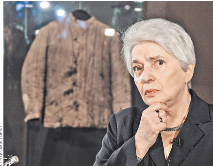
«Я была первоиздателем и редактором всего, что писал в те годы Александр Исаевич».

предстоит изучать, работали плотно, в четыре руки. К следующему лету Солженицын уже определил фронт работ и целенаправленно просидел в архиве два месяца. Часов по шестнадцать каждый день читал, делал выписки к написанию «Марта Семнадцатого», и перед ним обнажились огромные пласты прежде не изученных материалов. В СССР они были ему попросту недоступны. А в Гуверовскую «башню» мог прийти любой исследователь и прочесть исторические документы. Другое дело, что там, как и в большинстве архивов, до сих пор большое количество запечатанных коробок с неописанными материалами. Элементарно не доходят руки. Герберт Гувер, который еще в 1919 году пожертвовал Стэнфордскому университету значительную сумму на создание библиотеки и архива, с 1918 по 1923 годы возглавлял американскую организацию помощи (АРА), помогавшую Европе и России после разорений Первой мировой войны, а затем и во время нашего голода в Поволжье. При его прямом содействии из советской России было вывезено множество бесценных документов, в том числе дореволюционных и раннесоветских печатных изданий. Не только из Москвы и Петрогра-