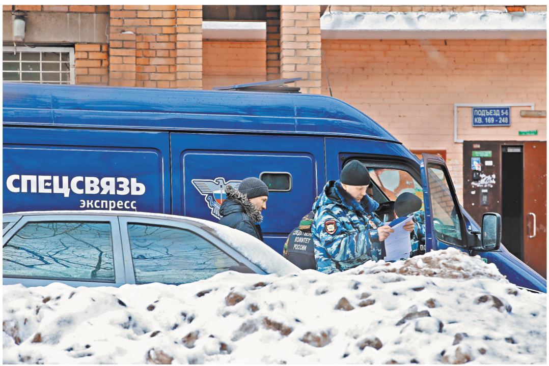
Трое налетчиков переоделись в дворников, но вместо лопат взяли в руки метлы.

Видео нападения на инкассаторов в Москве смотрите на сайте rg.ru/art/1367862