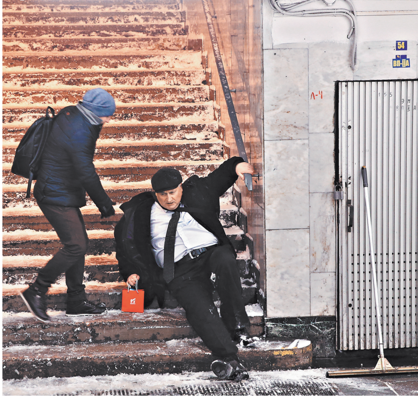
Нужно поддержать тех, кто находится в самом низу социальной лестницы, и увеличить их зарплату.

Но одновременно с этим работодателям было предоставлено право заказывать аттестацию рабочих мест частным компаниям. В итоге количество таких рабочих мест значительно уменьшилось и часть работников лишилась права на вход на досрочную пенсию. Те же, кто сохранил это право, но был близок к возрасту досрочного выхода на пенсию, не мог получить за короткое время от работодателей дополнительных перечислений, ко-