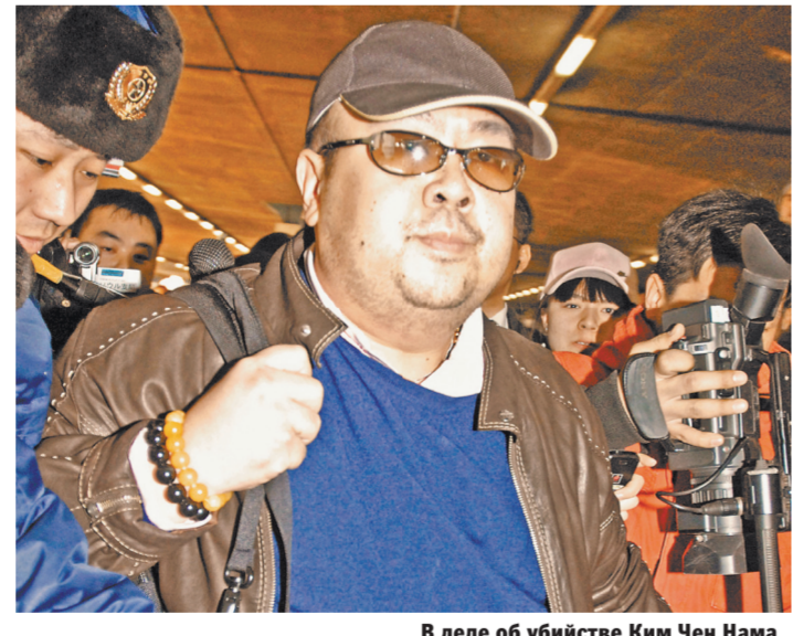
В деле об убийстве Ким Чен Нама еще много неясных деталей.