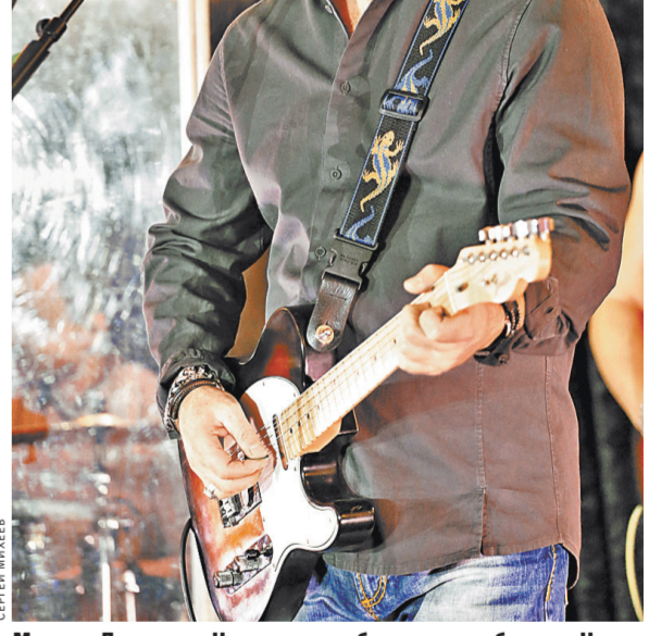
Максим Леонидов: Название для будущего альбома — «Над. Над суетой, над обыденностью, над пошлостью, над землей...

Максим Леонидов: Эти времена прошли. Мы не занимаемся розыгрышами и не играем в деревню с Писельсовым и Грозомоздовым, как играли в молодости. Далекие песни мы написали с Колей вдвоем, но и многие — по отдельности. Например, «Близ бродячих собак» — это исключительно Колина песня, хотя подписано «Леонидов — Фоменко». А «Ленинградское время» или «Домой» — это песни мои.