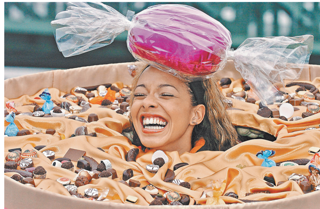
Российские кондитеры готовы к новым рекордам, чтобы завалить мир своими сладостями.

Тем не менее повод для радости есть, поскольку 420 тысяч тонн — это рекордный объем поставок сладостей за новейшую историю России, поясняет аналитик. Россия экспортирует свои