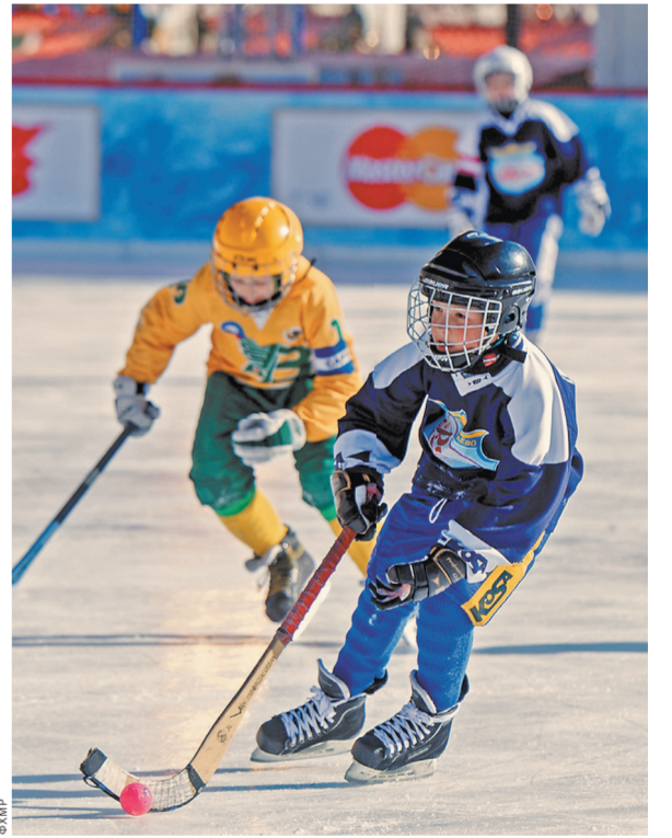
Занятия спортом помогают подрастающему поколению укрепить не только тело, но и дух.

А уже на этой неделе команда, составленная из учеников воскресных школ, сыграет на катке у стен Кремля вновь.