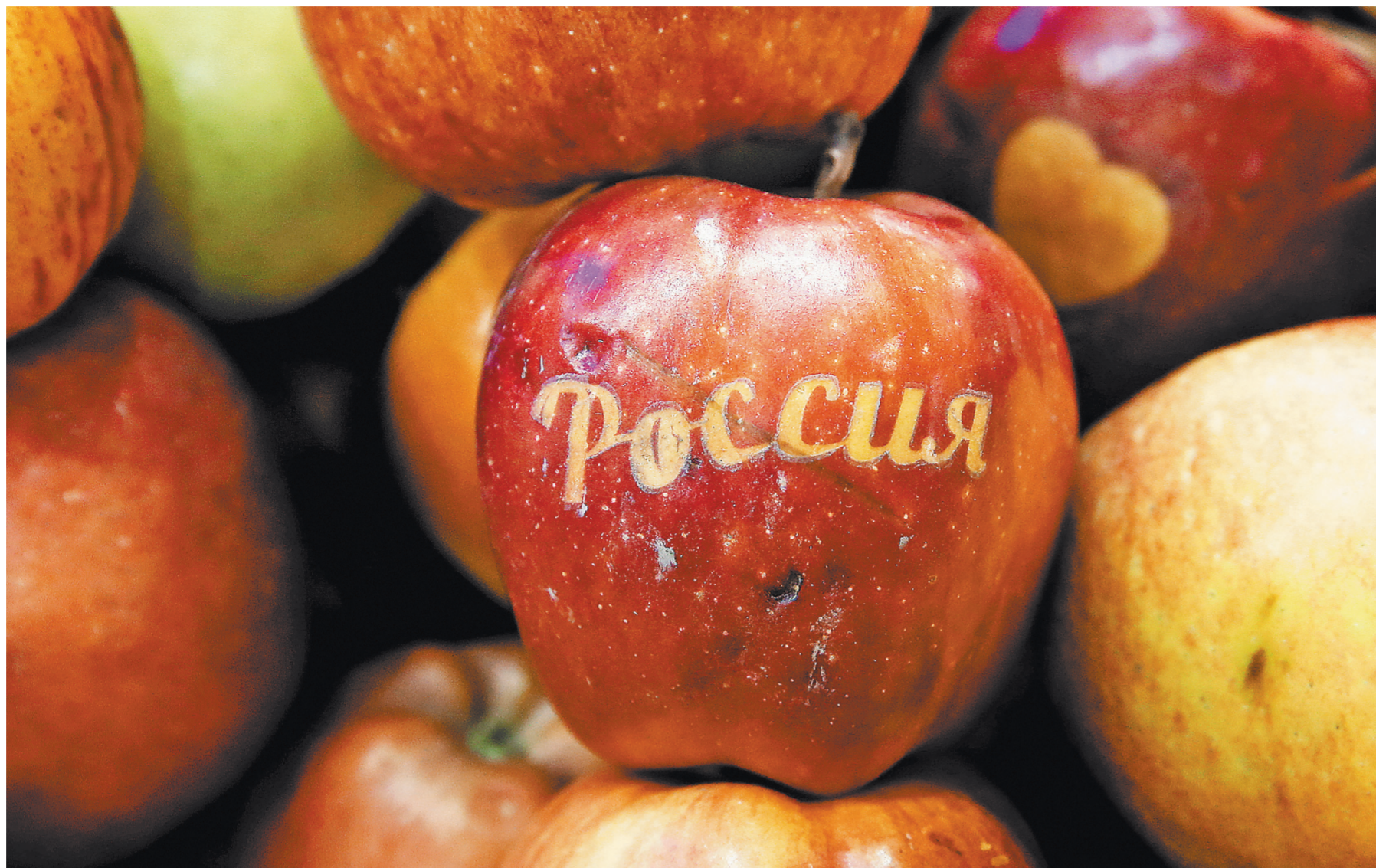
ВАЛЕРИ ШАНЮКИН / ГАС