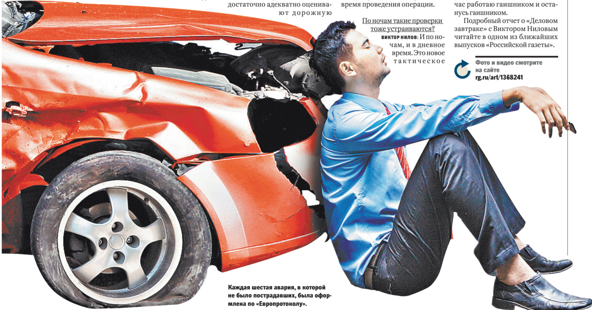
Каждая шестая авария, в которой было пострадавших, была оформлена по «Европротоколу».