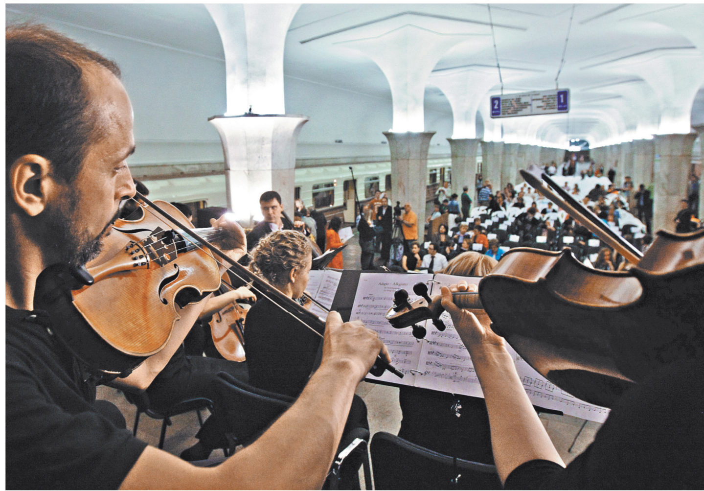
Концерты в столичной подземке — давно не редкость.