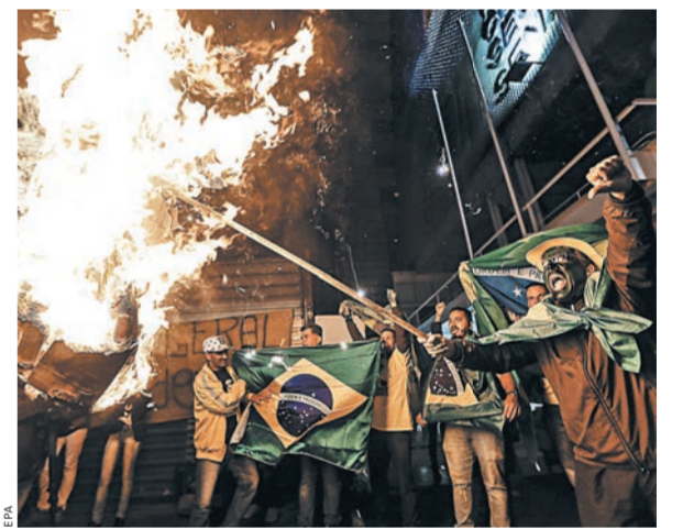
В Бразилии у населения есть запрос на сильную руку на вершине власти.

Болсонару известен крайне консервативными взглядами, которые он отстаивал, не стесняясь самых жестких выражений. Вот только некоторые из его высказываний. О сексуальных меньшинствах: «Пусть мой сын лучше погибнет в автокатастрофе, чем я увижу его встречающимся с парнем». О методах борьбы с криминалом: «Я за пытки, и люди вокруг тоже». В адрес коллеги-депутата: «Ты настолько уродливый, что я даже насильно тебя не стал бы». Он также предлагал ввести обязательную медикаментозную кастрацию виновных в сексуальном насилии, называя потомков рабов «недостойными потомства», резко критиковал беженцев из стран Африки и Гаити, а также представителей нехристианских религий. За бескомпромиссную риторику конкуренты навесили на Болсонару все мыслимые негативные ярлыки — диктатор, фашист, расист, гомофоб, сексист. Все это не помешало его стремительному взлету. Комментаторы отмечают, что избирателям не обязательно нравиться такой стиль Болсонару или они поддерживают все его сумасшедшие высказывания. Дело в другом. Бразильцы глубоко разочарованы правящим классом, который в последние годы провалился на всех уровнях власти и продемонстрировал полную неспособность решить наиболее проблемные, наоборот, усугубив их. А правящий класс увлечен внутренней борьбой и переводит стрелки, не желая ни признавать фундаментальные про-