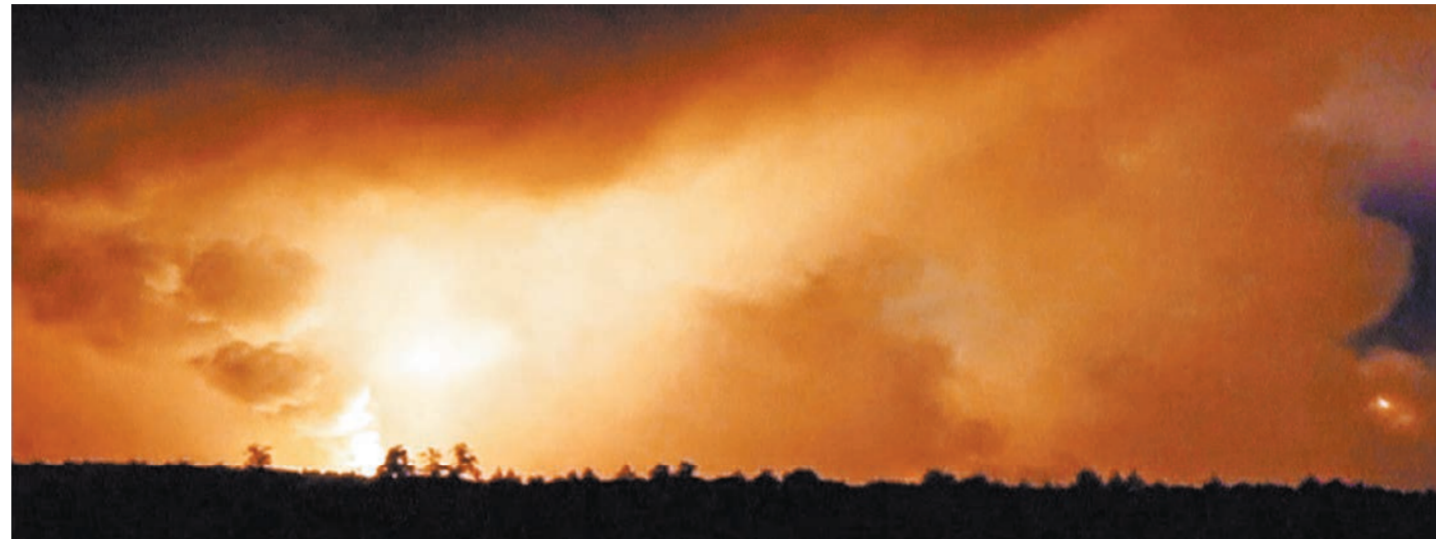
Взрывы и пожар на складе под Черниговом начались глубокой ночью.

дельные политики и министры по привычке продолжают безапелляционно обвинять «страну-агрессора» — среди них министр инфраструктуры Омелян и «гуманитарный» вице-премьер Кириленко. Эти же люди год назад, после пожара на арсеналах в Калиновке, тем же дружным хором настаивали на диверсии, но следствие пришло к выводу, что причиной пожара и взрывов стало курение на посту. Однако рациональное объяснение путающе частым пожарам на украинских арсеналах — не детонировавшими в стране остались всего два аналогичных объекта — должно существовать. И оно уже неоднократно озвучивалось, в том числе украинскими экспертами и политиками: пожар — идеальный способ скрыть недо-