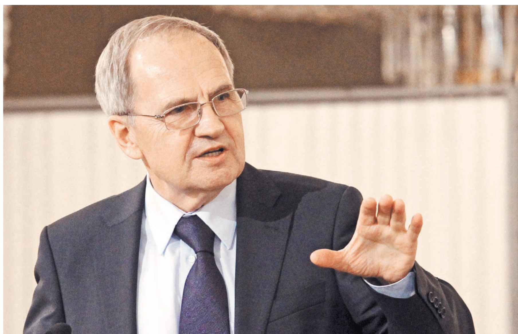
Валерий Зорькин, Председатель Конституционного суда России

Акцент Заложенный в Конституции глубокий смысл позволяет адаптировать этот текст к меняющимся социально-правовым реалиям