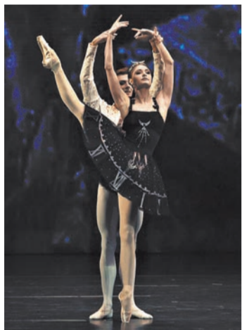
По Kremlin Gala можно сложить впечатление о тенденциях в международном балете.

Самым странным в юбилейном Kremlin Gala стало то, что организаторы полностью отказались от хореографии самого Петипа. Вероятно, тем самым они хотели акцентировать: несмотря на то, что старый балетмейстер дожил даже до эпохи кино, мы не можем точно определить, что в сохранившихся па-де-де принадлежит ему, а что — его поздним редакторам. Программа оказалась заполнена преимущественно второстепенными поделками второстепенных хореографов, в которых не разглядеть было достоинств Марсело Томаса, Люсии Лакарры, Роберто Болле — танцовщиков высшей лиги современного балета.