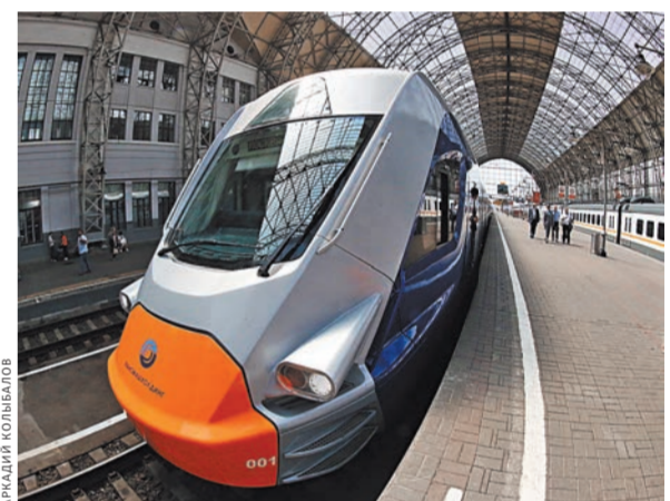
Кроме яркой внешности у «Иволги» много других преимуществ: от USB-розеток до отсутствия тамбуров.

«При подготовке технического задания на закупку поездов для Московских центральных диаметров, которое департамент транспорта разрабатывал вместе с ЦППК, мы проанализировали востребованность зарядок в поездах «Ласточка» на Московском центральном кольце. В результате мы пришли к выводу, что в поездах МЦД их должно быть больше», — рассказали в пресс-службе столичного дептранса.