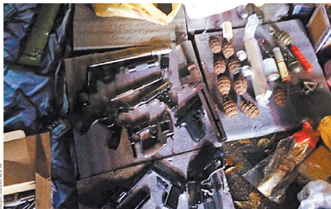
Во время обысков были изъятые 36 СВУ, свыше 1300 граммов взрывчатого вещества, две гранаты, а также 19 «стволов»: пистолеты ПМ, Люгер, самодельные револьверы, винтовка «Мосина», различные обрезы ружей.

Задержание подпольных оружейников проходило в Санкт-Петербурге и Петрозаводске. Трех задержанных членов группы по