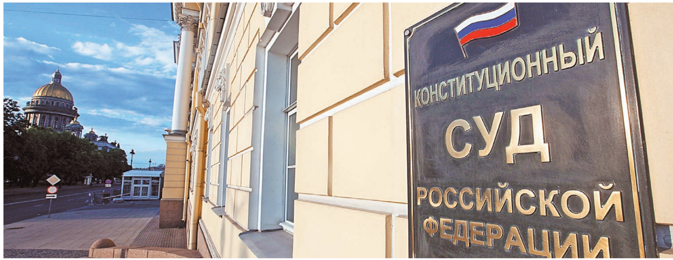
Судья по характеру жалоб в Конституционный Суд, главным источником напряженности в обществе является в том числе недостаточная защита социальных прав граждан.

Наиболее болезненно и остро воспринимается обществом крайне несправедливое распределение бремени проводимых в стране экономических реформ, свидетельством которого в первую очередь является чрезмерное социальное расслоение. По данным официальной статистики, децильный коэффициент (отношение доходов 10% наиболее богатых к доходам 10% наиболее бедных) в России один из самых высоких в мире и приближается к 17 единицам. По неофициальным авторитетным оценкам, масштабы социального расслоения в стране еще выше. За чертой бедности находится свыше 20 млн россиян. В этой связи нельзя не отметить, что год назад мы отмечали столетие революционных событий 1917 г., которые, как сейчас ясно, были порождены прежде всего глубоко