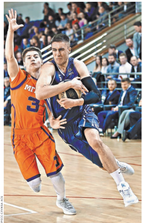
В Студенческой Лиге с каждым годом растет и качество баскетбола, и количество болельщиков на трибунах.

Из принципиальных новизн сезона отметим создание высшего мужского дивизиона «Центр», который объединит дивизионы «Север-Запад», «Золотое кольцо» и «Черноземье».