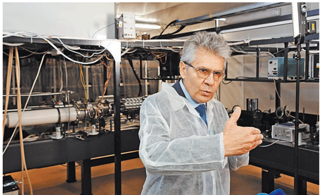
Академик Александр Сергеев: в мегапроекте XCELS мы планируем коллаборацию с зарубежными коллегами.

— Сейчас создается несколько проектов класса 200 ПВт — румынская, венгерская и чешская установки. В Шанхае установка достигла мощности в 5 ПВт, но пока использовать ее практически невозможно. Например, в Корее есть установка мощностью в 3–4 ПВт. Если посмотреть на динамику строительства, сейчас близко к завершению строительство установки ELI в Румынии. XCELS — установка другого уровня мощностью в 200 ПВт. Такой лазер приведет нас в область совсем других физических параметров, например будет преодолен порог импульсивности. Мы попадем в другой мир, который еще никто никогда не видел. Это касается движения частиц, и того, как они будут друг с другом взаимодействовать. Это мир, в котором одновременно присутствует и мощное лазерное излучение, которое ускоряет частицы, и мощное гамма-излучение, которое частицы производят, а также рождается вещество и антивещество при взрыве в вакууме. Таким образом, мы втащим Вселенную в нашу лабораторию.