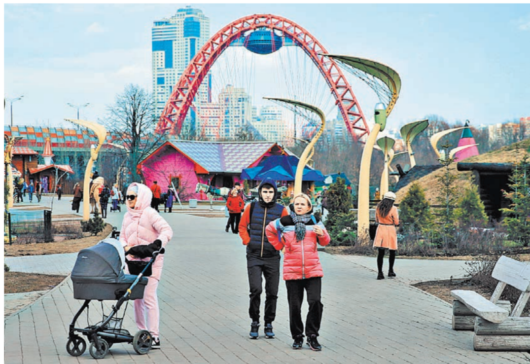
Москва занимает второе место среди крупнейших мегаполисов мира по доле парков в городском пространстве.