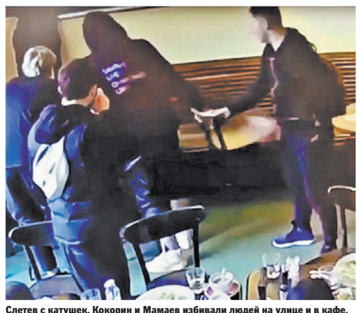
Слетев с катушек, Кокорин и Мамаев избивали людей на улице и в кафе.