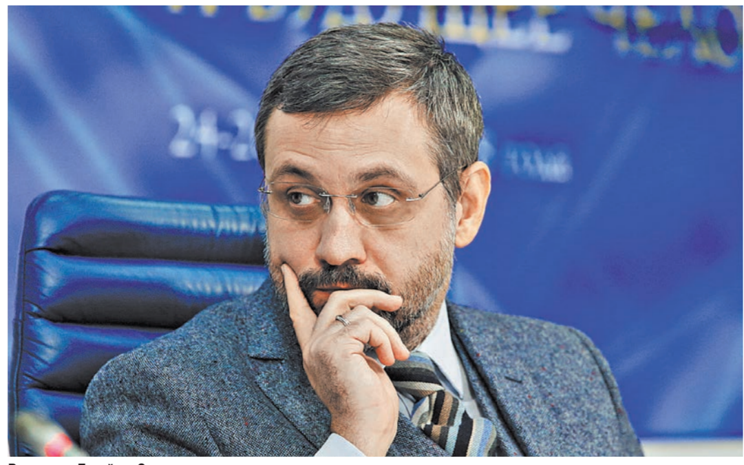
Владимир Легойда: Ситуацию еще можно направить в правильное русло.

По всем вопросам просим обращаться по адресу: 115035, г. Москва, Кадашёвская наб., д. 30, офис 14. Телефон Единого контакт-центра ООО «СК «Капитал-Лайф»: 8 800 500 35 53. Настоящее уведомление публикуется на основании статьи 26.1 Закона РФ от 27.11.1992 г. № 4015-1 «Об организации страхового дела в Российской Федерации».