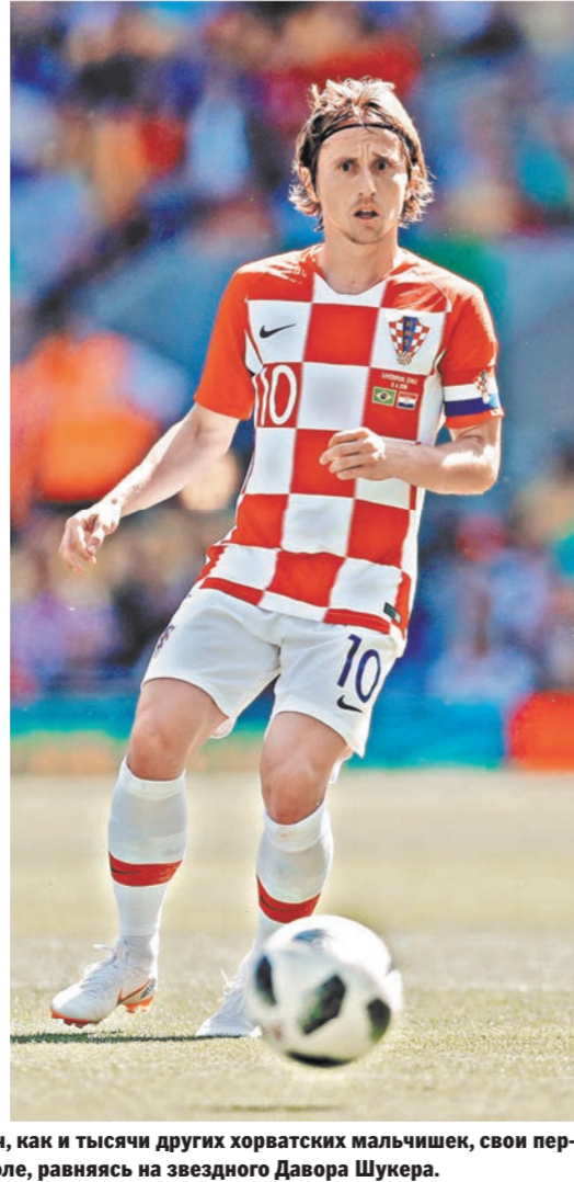
Самый лучший игрок чемпионата мира-2018 Лука Модрич, как и тысячи других хорватских мальчишек, свои первые шаги в футболе делал в обычной сельской спортшколе, равняясь на звездного Давора Шукера.