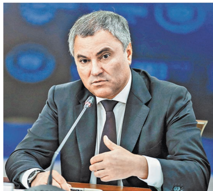
По оценке Вячеслава Володина, саммит «создает основу многоуровневой парламентской дипломатии».

С критикой в адрес политики США выступил и председатель Госдумы Вячеслав Володин. «Саммит Евразии должен совместно выработать меры противодействия «эгоистичным действиям» администрации США в сфере экономики и договориться о переходе в торговых взаимоотношениях на национальные валюты, призвал иранский спикер. Председатель Госдумы в ходе визита в Турцию ранее также высказался за такой переход. «Сам США сделали многое для того, чтобы пошатнуть положение доллара и породить к нему недоверие», — сказал Володин в интервью турецкому телеканалу TRT.