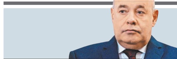
Михаил Швыдкой, доктор искусствоведения