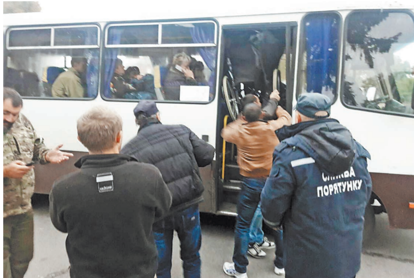
С места катастрофы были эвакуированы 12 тысяч человек.

стачу единиц хранения, образовавшуюся из-за нелегальной продажи вооружений и боеприпасов. У этой версии есть косвенные доказательства: арсенал в Балаклее взлетел на воздух за два дня до приезда туда инспекции НАТО, проверяющей соблюдение Украиной договора об обычных вооруженных силах в Европе (ДОВСЕ). Удивительным образом масштабный пожар на арсеналах в Лозовой совпал с плавачным для Тбилиси окончанием военной авантюры в Южной Осетии. Предполагалось, что именно с этих складов режим Ющенко поставил в нарушение всех договоров вооружения социально близкому грузинскому президенту Саакашвили. О том, что Украина после 2014 года стала главным нелегальным поставщиком оружия не только в Европу, но и на Ближний Восток (в том числе запрещенной в РФ группировке ДАИШ), писали в разное время европейские издания и даже The New York Times. Наконец, в июне Еврокомиссия опубликовала доклад о реализации стратегии по борьбе с незаконной торговлей оружием, в котором Украина наряду с Косово прямо называлась крупнейшим нелегальным поставщиком оружия в ЕС. Поэтому в украинских социальных сетях вчера была популярна шутка: «Почему взорвал-