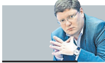
Андрей Исаев, первый заместитель руководителя фракции «Единая Россия» в Государственной Думе