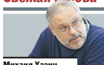
Михаил Хазин экономист, публицист

ЛИЧНО я довольно настороженно отношусь к этой единой биометрической системе («РГ», 1-я и 3-я полосы). Все, что где-то у кого-то хранится в электронном виде, может быть похищено злоумышленниками и использовано в любых незаконных целях. Да, нам обещают, что база данных будет хорошо защищена. Но мошенники разные бывают. В том числе и довольно грамотные, технически подкованные и способные взломать любую защиту. Это один момент.