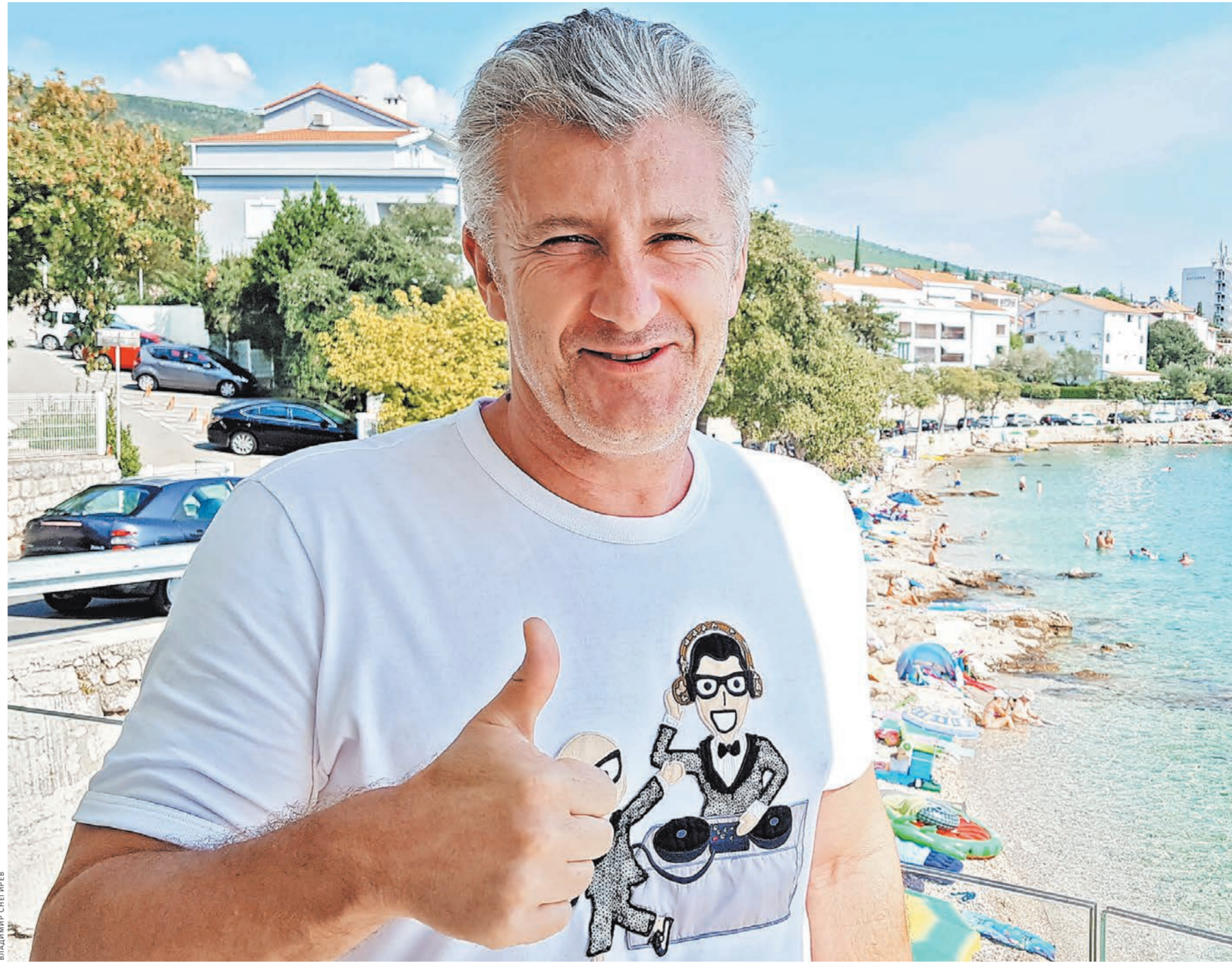
Корреспондент «РГ» случайно оказался вместе с легендарным Давором Шукером в одном отеле на берегу Адриатического моря. Это ли не повод для увлекательной беседы?

— Приятно, конечно, это слышать. Однако нас больше интересует другое, — слегка приземлил Давора известный поли-