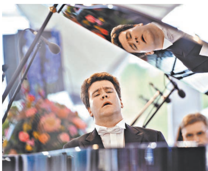
В Театре Елисейских Полей Денис Мацуев исполнил Второй фортепианный концерт Сергея Рахманинова.

В стенах культового театра прозвучали увертюра к опере Михаила Глинка «Руслан и Людмила», «Серенада для струнного оркестра» Петра Чайковского, Второй концерт для фортепиано с оркестром Сергея Рахманинова. Всемирно известному пианисту и Уральскому молодежному оркестру удалось рассказать парижской публике о нашем культурном наследии и об идее всемирной выставки «на универсальном языке человечества — языке музыки».