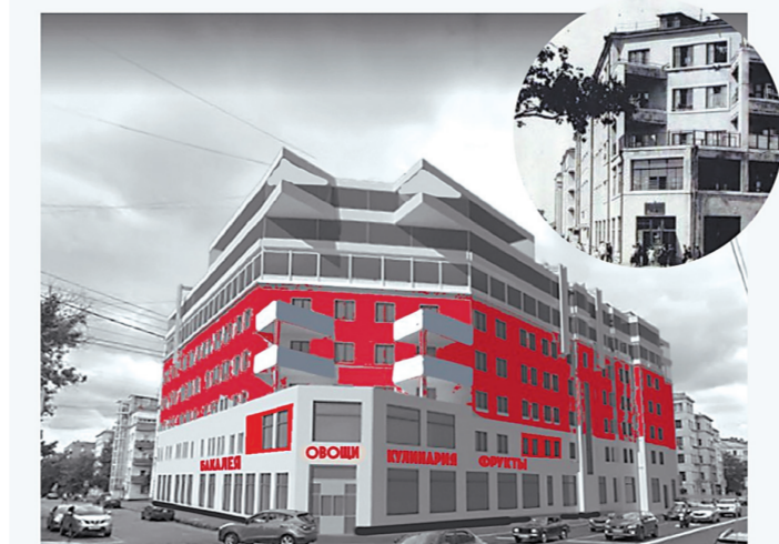
Рабочие поселки должны стать частью городской среды. Часть из них превратится в творческие кластеры, а другие войдут в туристические маршруты.

Конструктивистские поселки в Москве появились в 20-х годах прошлого века. Пытались решить жилищную проблему, советы строили быстро и много, вдома селами работая с фабрик и заводов, военных и творческую интеллигенцию.