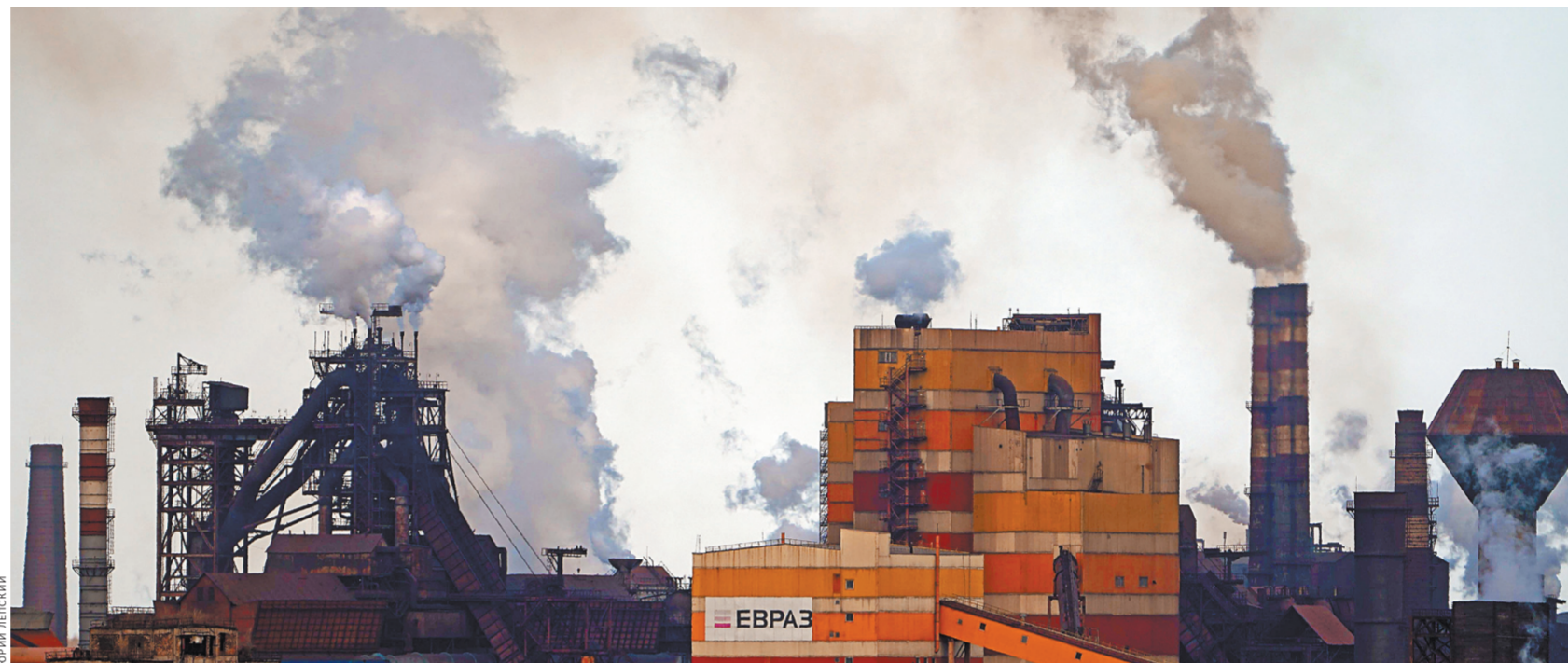
На этом фоне и по сей день живут в моем городе творения Палладио.