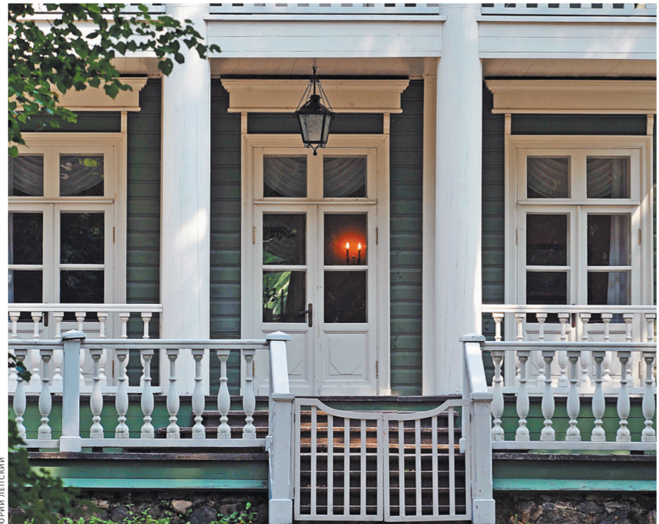
И Пушкинский дом в Петровском — тоже в палладианском стиле.