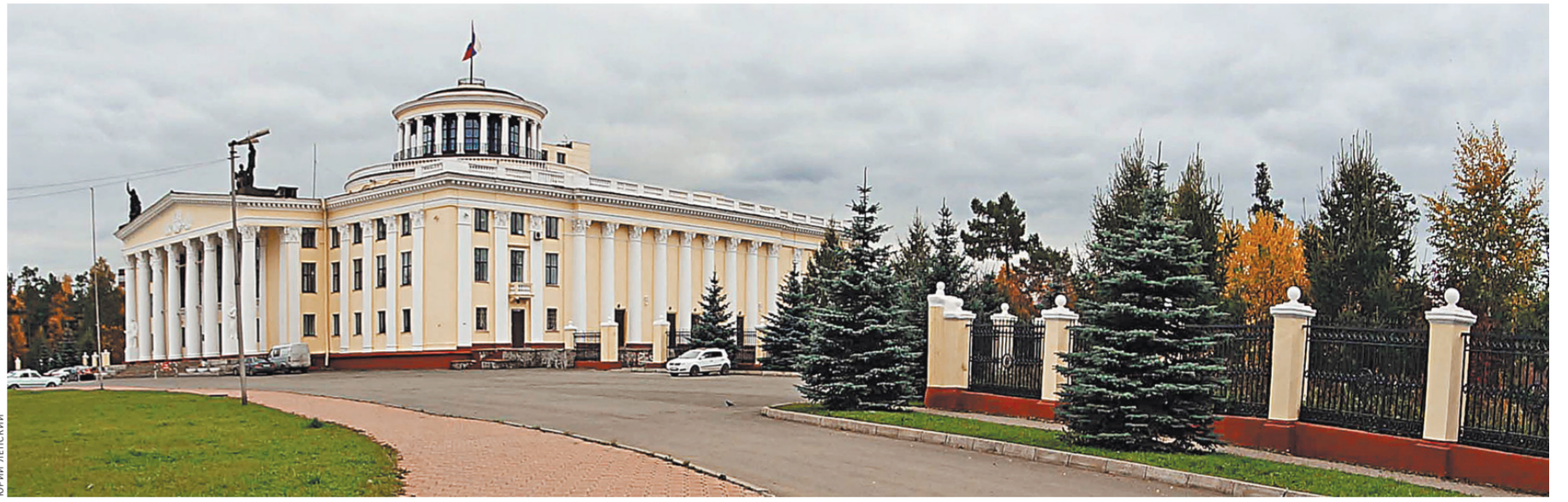
Наш Дворец металлургов построен по его лекалам.