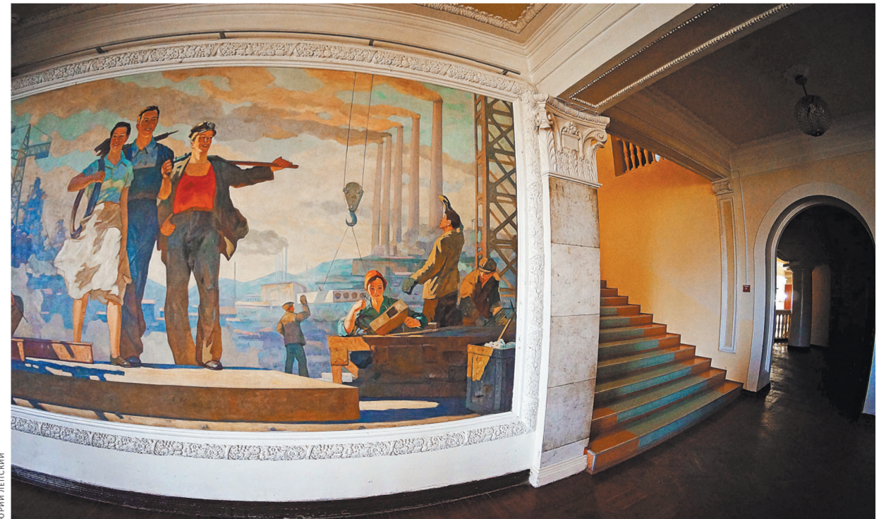
Анфилады и потайные уголки нашего Дворца металлургов.