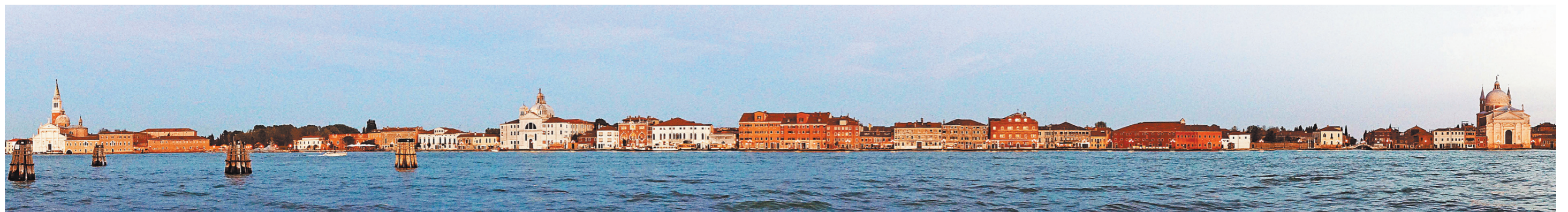
Вот и венецианский пролив Джудекка. Крайние — справа и слева — церкви, построенные Андреа Палладио.