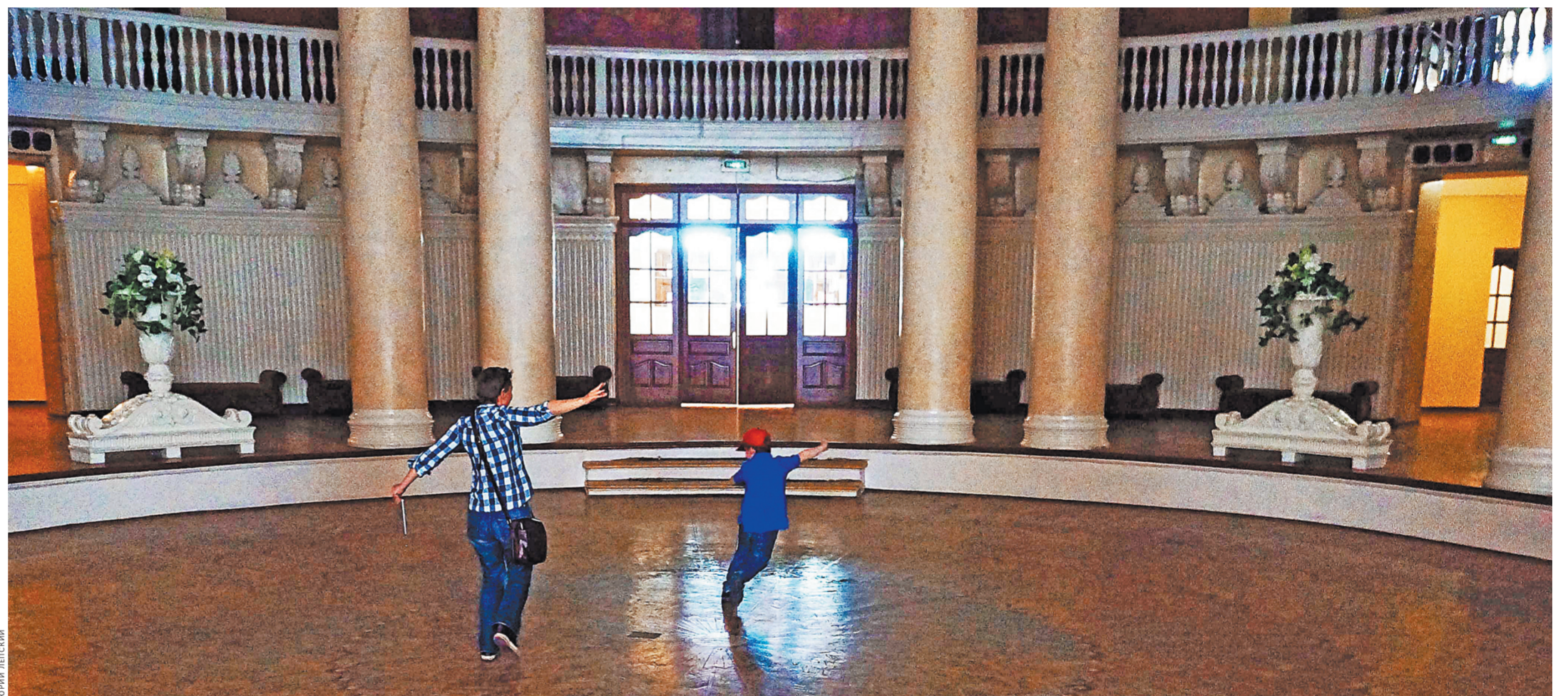
Мой выпускной бал прошел здесь много лет назад. Вальс мои дети уже не танцуют.