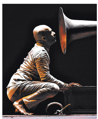
Сцена из спектакля Xenos. Акрам Хан смог рассказать о хрупкости в агрессивном мире здесь и сейчас.

Показав в данс-спектакле, что они думали и чувствовали, казалось невыполнимой задачей, но Акрам Хан опирался на проверенное сочетание катхака (один из стилей индийского танца) с contemporary dance и команду единомышленников. Саундтрек написал проверенный на «Жизели» Лео Вентилья, собравший в плотный поток традиционную индийскую музыку, переключив на плачу, звуки взрывов и накрывающую зрителя католическую молитву в финале. Исполняет все оркестр с поющими раги амери-