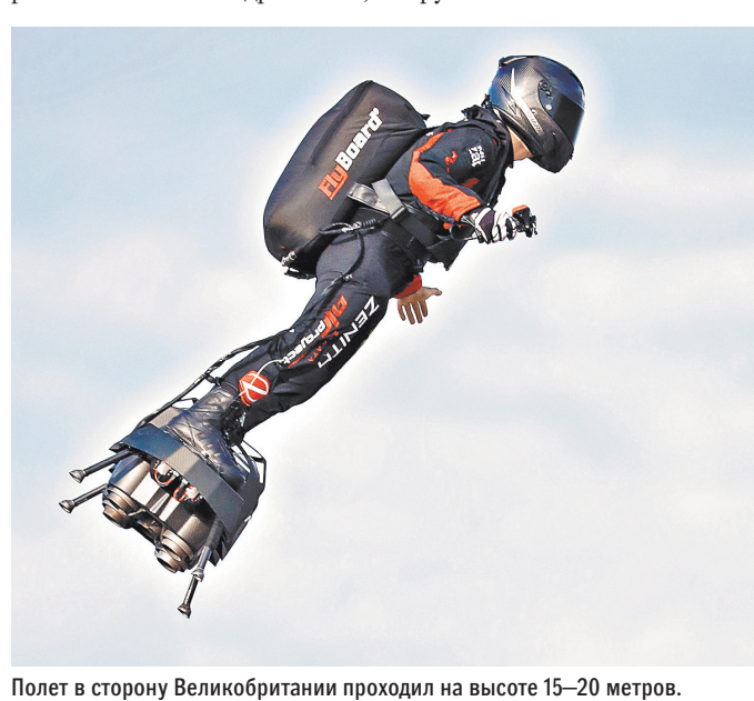
Полет в сторону Великобритании проходил на высоте 15–20 метров.

Отметим, что Фрэнки Запата, в прошлом чемпион мира и Европы по гонкам на гидроциклах,