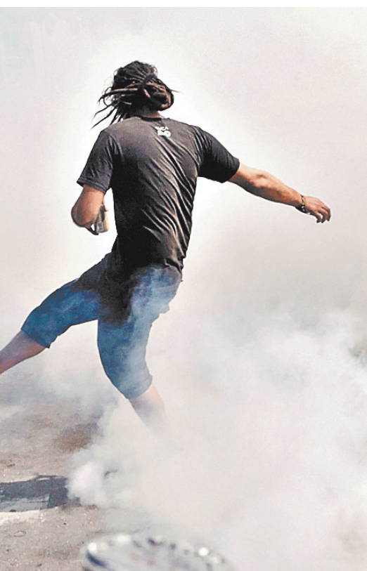
Еще более строг к нарушителям закон в Швеции, где согласовывать выступления надо не менее чем за 7 дней. Здесь организаторам незаконных митингов грозит до четырех лет тюрьмы, а рядовым участникам — до двух лет тюрьмы. В соседней Финляндии не слаще. Те, кто отправился на несогласованный митинг, нарушает порядок и не вынимает стражкам порядка, могут получить до 3 лет тюрьмы или 15 тысяч евро штрафа. ●

Но мало где демонстрантов усмиряют столь жестко, как в США. В 2014 году мир поразил кадры силового подавления демонстраций в американском Фергусоне (штат Миссури). Местные жители вышли на улицы в знак протеста против полицейского насилия после того, как белый патрульный расстрелял убежавшего от него темнокожего подростка. Вспыхнули беспорядки, и для разгона толпы власти ввели бронетехнику, использовали светошумовые гранаты и слезоточивый газ. Беспорядки продолжались несколько месяцев, задержаны были сотни человек. Годом позже в американском Кливленде (штат Огайо) полиция задержала более 70 участников акции протеста, которые вышли на улицы после оправдательного вердикта правоохранителю, обвиненному в убийстве двух безоружных человек. Акция в целом проходила мирно, но некоторые ее участники выходили на проезжую часть, создавая помехи автомобильному движению, за что сразу были арестованы. В тот же год страну охватили массовые беспорядки на расовой почве в Балтиморе (штат Мэриленд). Акция переросла в столкновения с правоохранителями. Те отвечали светошумовыми гранатами, задержав свыше 200 человек. Подразделения Национальной гвардии США были введены в Балтимор впервые за почти полвека. Еще один яркий пример — разгон в США акций движения «Захвати Уолл-стрит», выступавшего против социального и экономического неравенства и преследений финансовой элиты. В октябре 2011 года