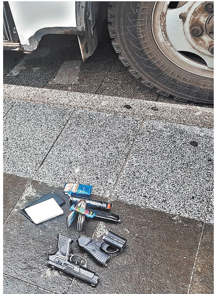
Пистолеты, газовые баллончики, ножи находила полиция у «миролюбивых» участников акции.

Теперь о том, как они добиваются этого. На проведение своей акции 27 июля они даже не подали в мэрию Москвы заявки. 3 августа отказались от предло-