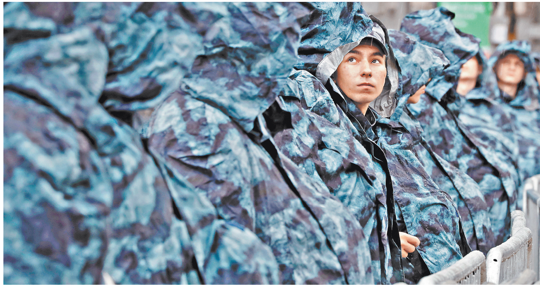
Слова о «ваших сыновьях», которые защищали правопорядок во время акции, отражали позицию Росгвардии, которая не делит горожан на «своих» и «чужих», а честно исполняет свой долг.

Полиция и Росгвардия и на этот раз действовали аккуратно, но жестко. Удивительно: но даже