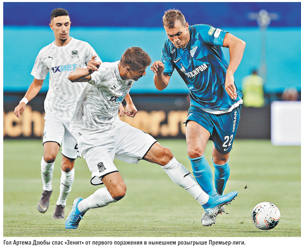
Гол Артема Дзюбы спас «Зенит» от первого поражения в нынешнем розыгрыше Премьер-лиги.

Опросный лист можно скачать на сайтах префектуры СВАО города Москвы и управы Останкинского района города Москвы.