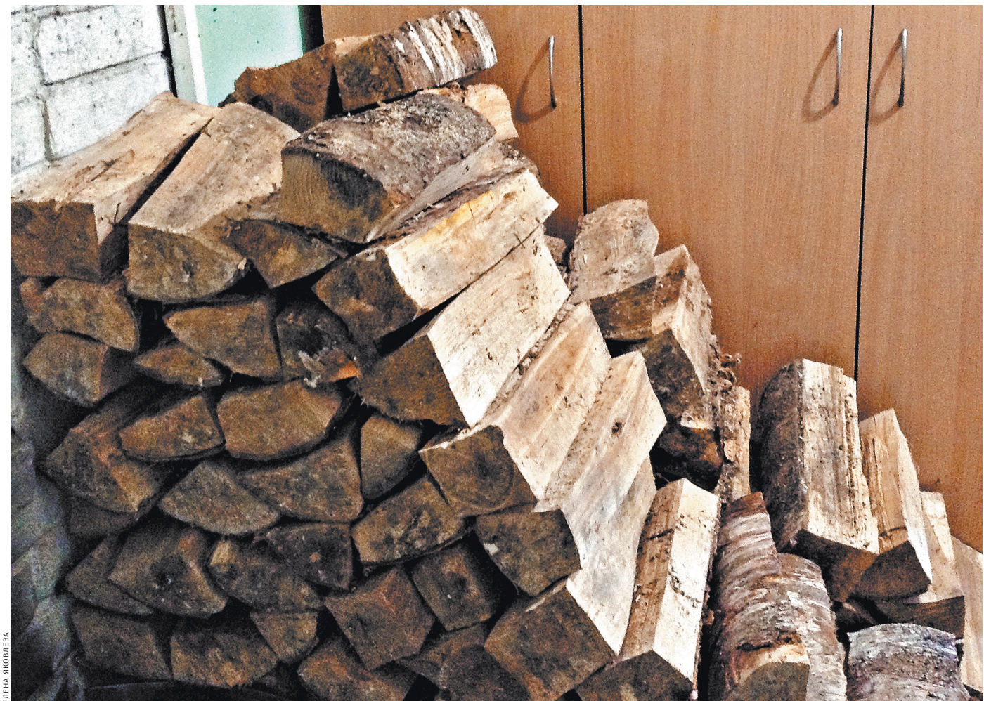
Аккуратные высокие стопки дров лежат возле шкафа, потому что сарай затопило.