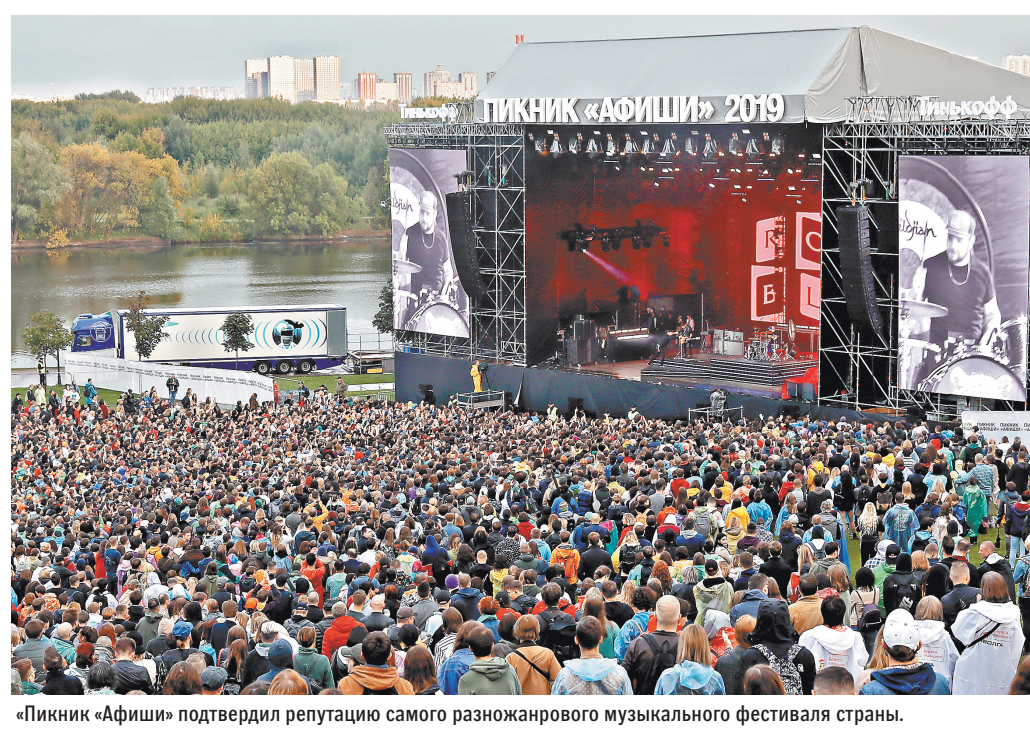
«Пикник «Афиши» подтвердил репутацию самого разножанрового музыкального фестиваля страны.