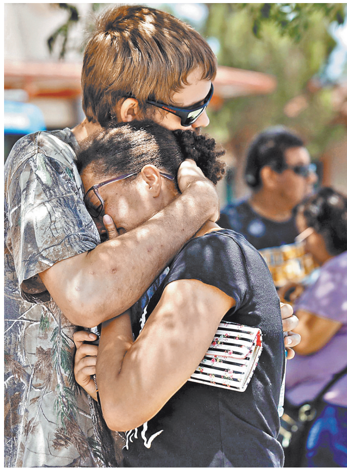
Преступник приехал в Эль-Пасо, за тысячу километров от его родного дома, чтобы убить как можно больше мигрантов.