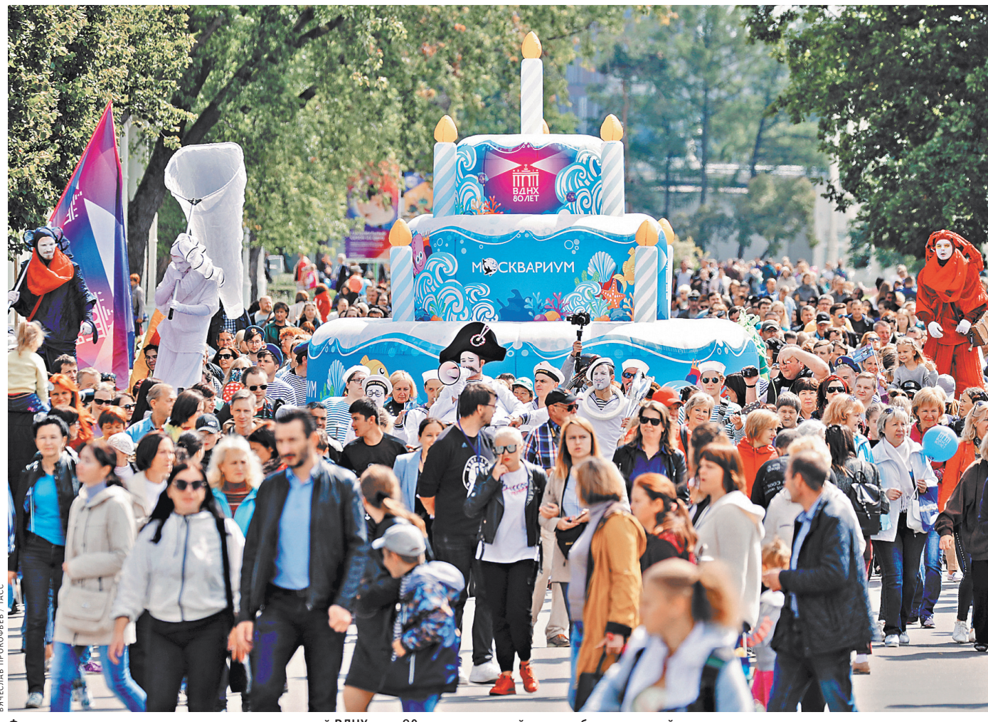
Фирменным угощением для десятков тысяч гостей ВДНХ стал 80-килограммовый торт к юбилею главной выставки страны.

Уощений — для желудка и души — было много и на ВДНХ, выставка отмечала свой 80-лет-