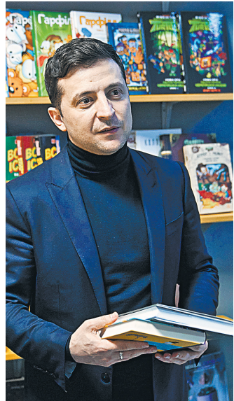
Если дело и дальше так пойдет, то Зеленский распорядится и книги сжигать.

Президент Украины Владимир Зеленский вслед за продлением запрета российских социальных сетей и сайтов подписал указ и о санкциях против российских музеев, институтов, вузов, предприятий и фондов. В список тех, с кем предписано прекратить любые контакты и аннулировать все действующие формы сотрудничества, попали Эрмитаж, ГМИИ им. Пушкина, Институт востоковедения РАН и МГУ. Зачем Зеленский под этим подписался, уже третий день гадают его бывшие избиратели.