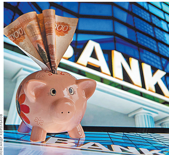
Российские банки одобрили больше 800 тысяч заявлений заемщиков о реструктуризации кредитов.

18 мая после двухмесячного карантина распахнут двери для верующих итальянские церкви во главе с Собором Святого Петра в Ватикане. Накануне открытия в ватиканской базилике были проведены дезинфекционные работы, которые затронули все поверхности от полов до алтарей.