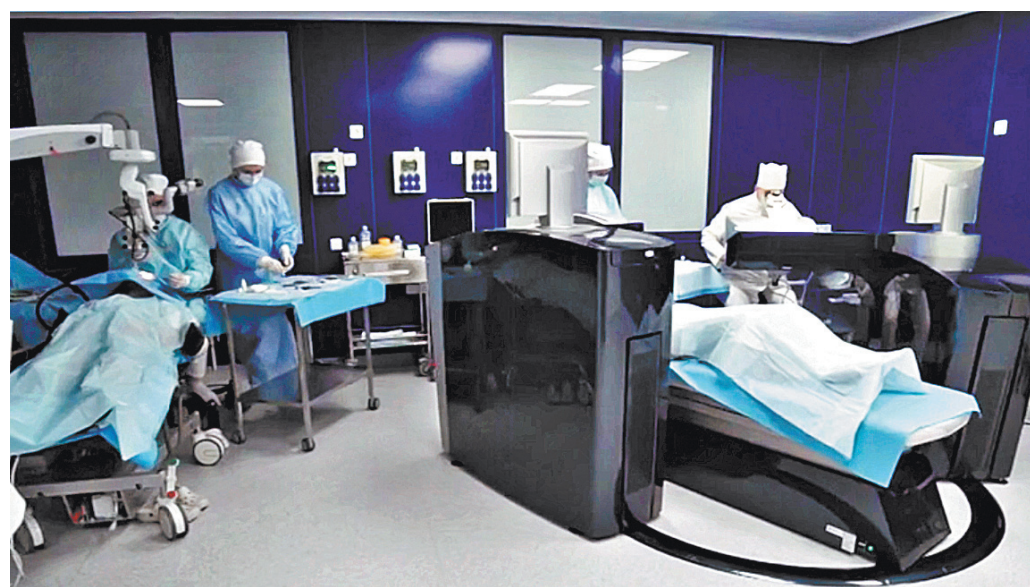
Врачи и медсестры прошли переподготовку в Военно-медицинской академии им. Кирова в Санкт-Петербурге.