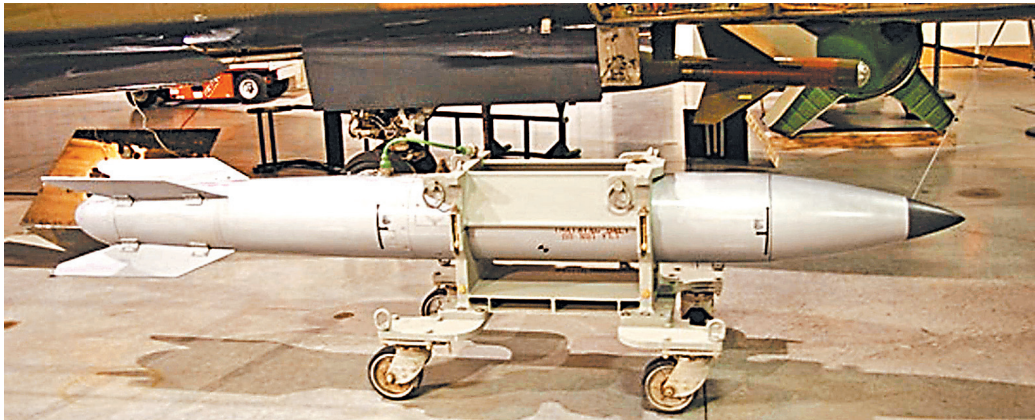
Около двух десятков вот таких атомных бомб В61 находятся в ФРГ. Их США могут перебросить в Польшу.

Впрочем, попытка СДПГ, которую в этом вопросе поддерживают представители левых и зеленых политсил Германии, ввести эту чувствительную тему в общественный дискурс вызвала резкий окрик со стороны «старшего партнера». В частности, американский посол в Германии и одновременно