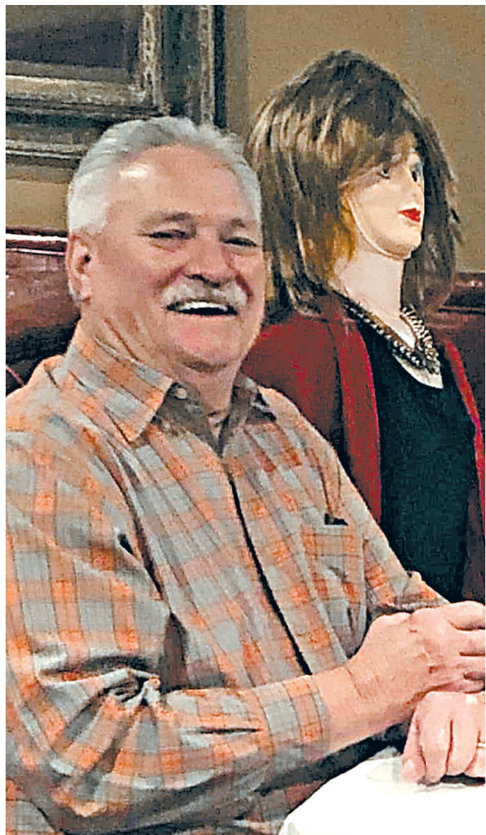
Таким оригинальным способом ресторана в американском Гринвилле (штат Южная Каролина) решила обеспечить соблюдение социальной дистанции клиентов и при этом избежать мрачности из-за пустых столиков. За них предпринимательница усадила... куклы в человеческий рост. Изысканные дамы с кавалерами, мило беседующие подружки — издалека их можно принять за настоящих людей. Завсегдатаи ресторана рады сыграть в эту игру, которая, по их признанию, поднимает им настроение в непростые времена.