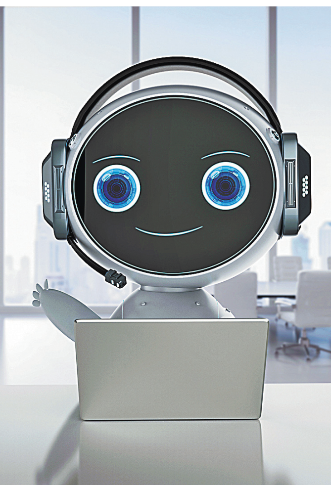
Эмпатия — пока слабое место ботов.