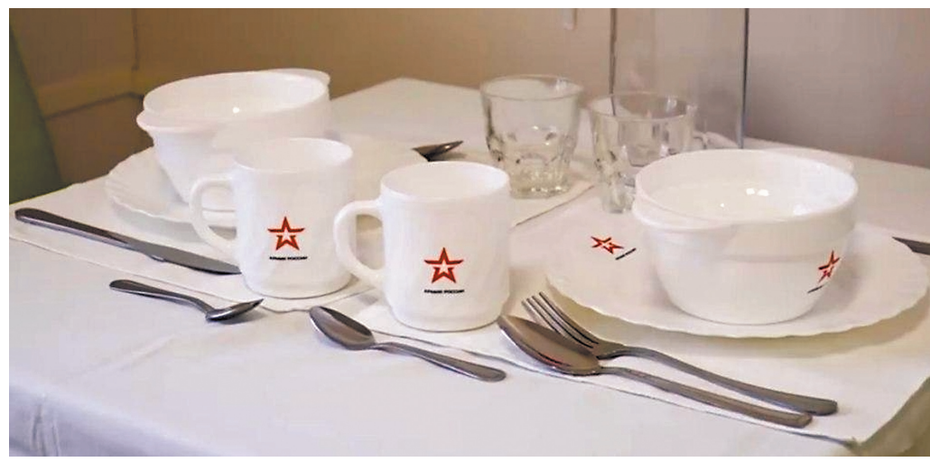
При необходимости медцентры могут быть развернуты в любом регионе за несколько недель.