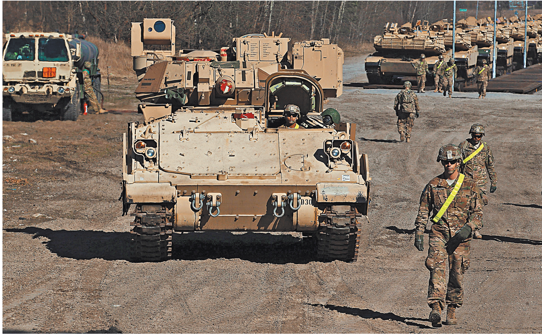
Американские танки М1 «Абрамс» в последние годы стали частыми «гостями» в Польше, где они принимают участие в военных маневрах.

На авиабазе Бюхель в районе Рейнланд-Пфальца складированы около 20 тактических свободнопадающих ядерных авиа-