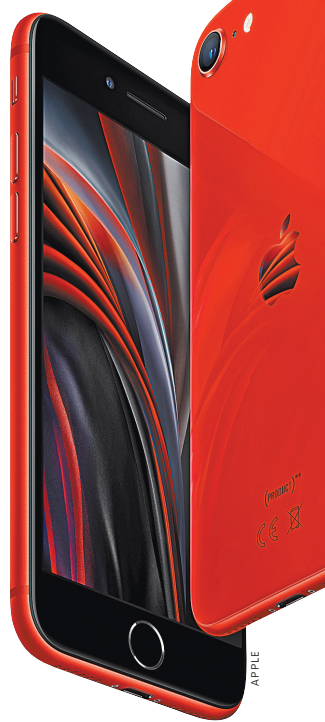
Стеклянное «яблочко» переехало в центр смартфона.

Интересные фишки Смартфон поддерживает eSIM. Вы не найдете ни один аппарат этой же ценовой категории, который обладает поддержкой данной технологии. В первую очередь eSIM оценят путешественники — практически в любой стране мира вы сможете подключить к местному оператору. Также стоит отметить и поддержку нового стандарта Wi-Fi — Wi-Fi 6. В iPhone SE заявлена и защита от воды по стандарту IP67, но купить телефон в ванной или в море все же не стоит.