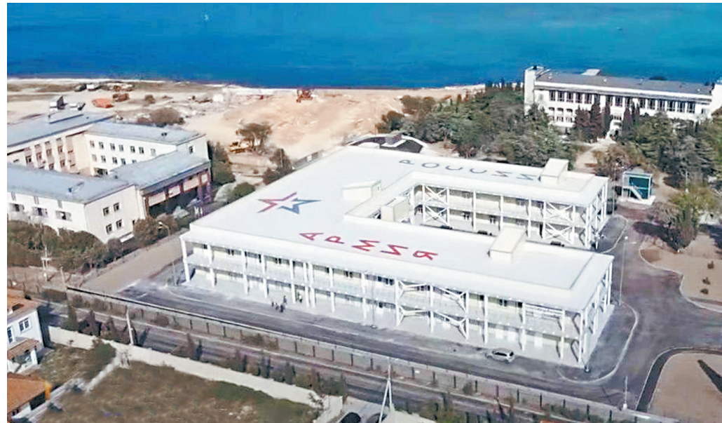
Все госпитали — капитальные сооружения, рассчитанные как минимум на полвека эксплуатации.