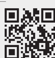
Последние новости о коронавирусе — на сайте «РГ».

За 17 мая в России зарегистрировано 9709 подтвержденных случаев коронавирусной инфекции COVID-19, из них в Москве — 3855 случаев. Всего в России зарегистрировано 281 752 случая коронавирусной инфекции. С начала эпидемии выздоровели 67 373 человека. Скончался 2631 человек.