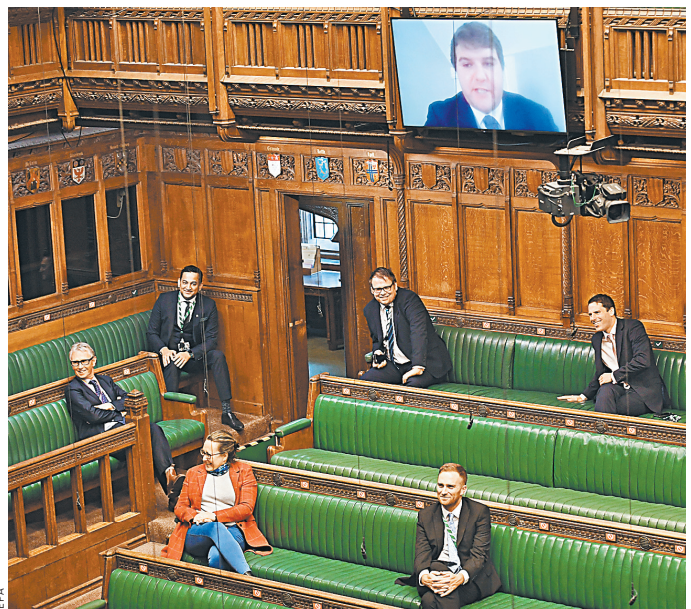
Британские слуги народа посетили идею своего возвращения в Палату общин крайне опасной.