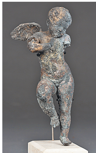
Донателло «Танцующий амур» (1500–1525). ГМИИ им. А.С. Пушкина.

Сюжет этой истории начинается в мае 1945 года. Вскоре после взятия Берлина три этажа с музейными сокровищами в бункере в парке Фридрихсхайн в советской зоне оккупации сгорели. Первый по-