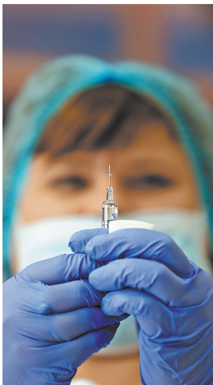
Помочь в создании вакцины можно, просто оставив компьютер включенным.