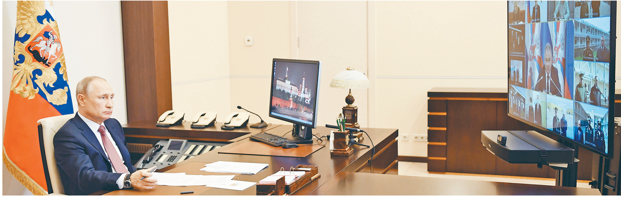
Владимир Путин поблагодарил руководство Минобороны, строителей и военнослужащих, пожелал успехов медикам, а также призвал держать на самом высоком уровне готовности специализированный коечный фонд в регионах.

При необходимости медцентры могут быть развернуты в любом регионе за несколько недель, отметил он и попросил правительство с Минобороны рассмотреть возможность распространения практики и поделиться с регионами технологиями. Кабинет также должен проанализировать необходимые для строительства требования и процедуры и представить предложения по их упрощению. «Рано или поздно эпидемию мы поборем, она закончится, но перед нами и сегодня, и на будущее стоят масштабные задачи по развитию инфраструктуры здравоохранения в регионах», — пояснил Путин. «Мы много раз это обсуждали: всякие СНИпы-хрипы и призывающиеся к этому виду деятельности квазиучастники процесса... Послушайте, их нужно зачищать в конце концов, надо навести там порядок», — призвал он. «И то, как отработало министерство обороны, — замечательный пример того, как можно организовать работу и по срокам, и по качеству», — похвалил президент.