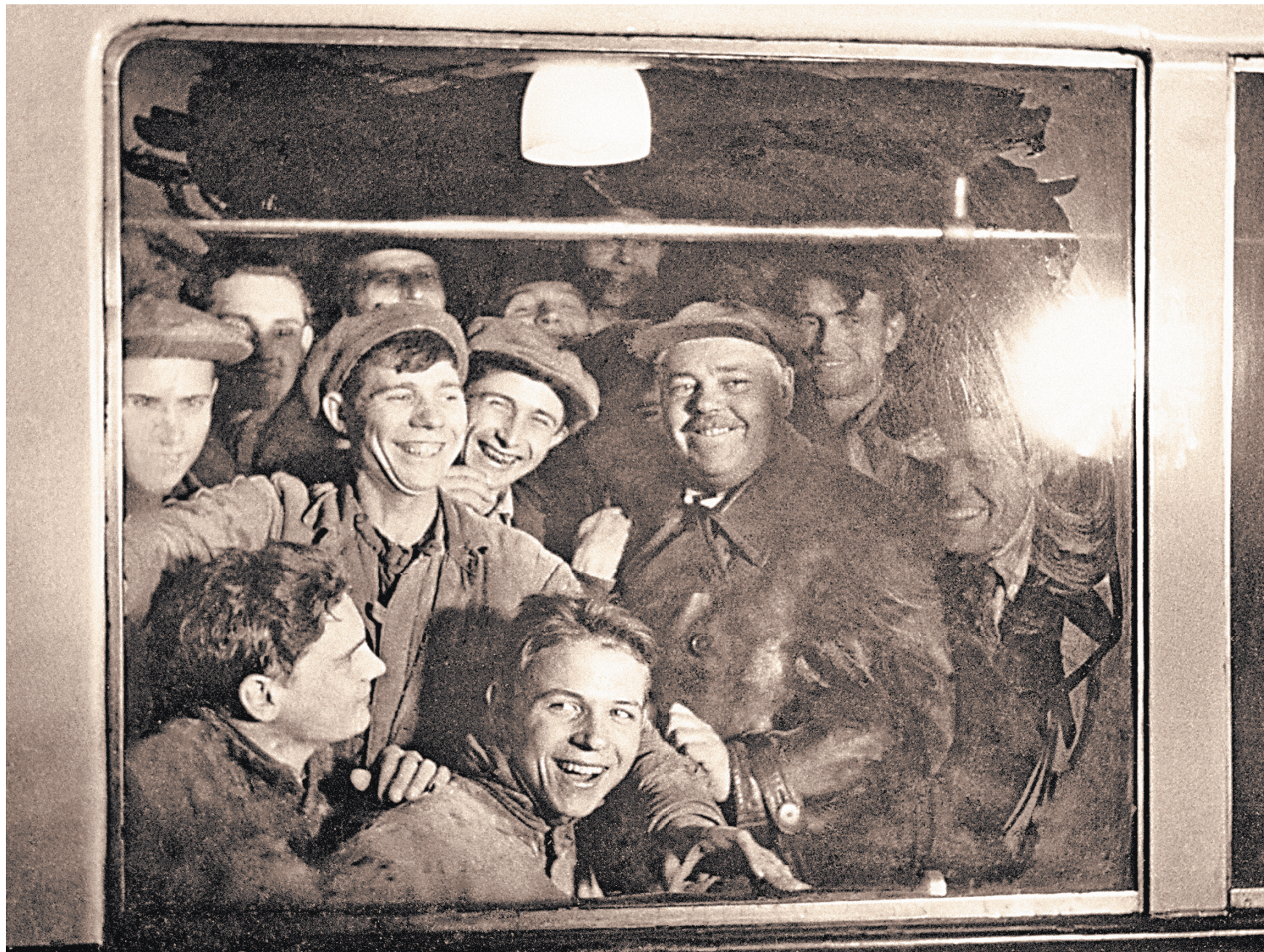
«Буржуэ замашки были — покатайтесь в автомобиле! А поезду с Танею в метрополитанию!» — лучше Маяковского никто не опишет состояние умов и сердец перед открытием подземки.