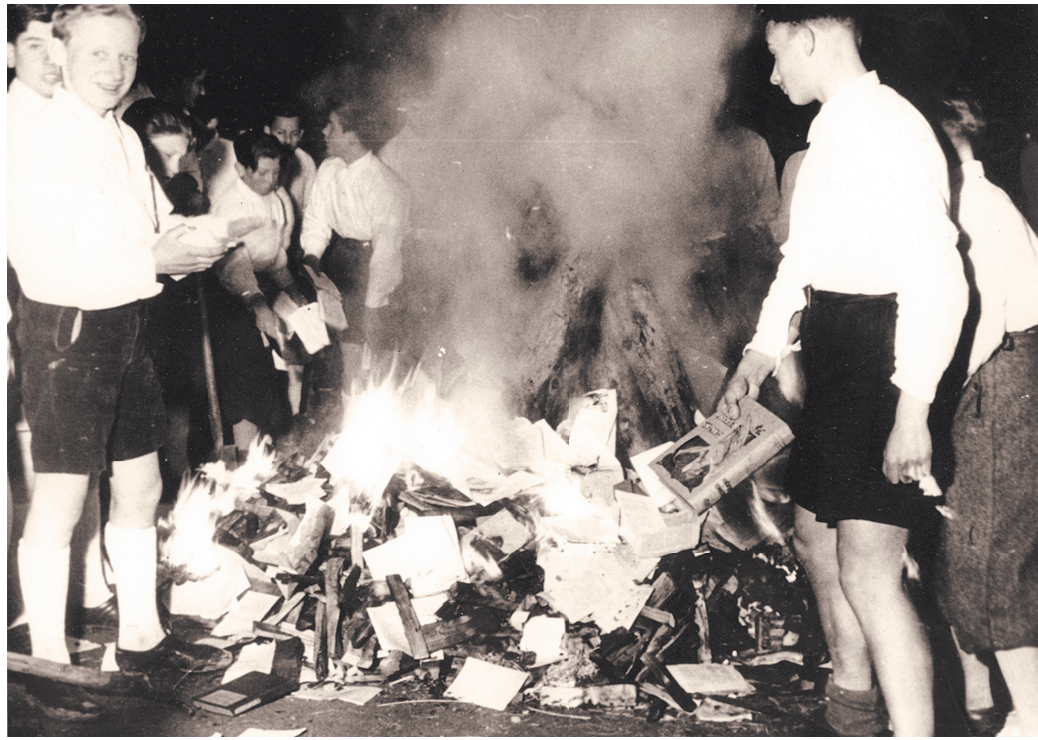
Так, довольно улыбаясь, уничтожали книги члены «Гитлерюгенд» — молодежной организации НСДАП.

Официальные власти и элита стран Запада также смотрели на проявления этого варварства отстраненно и даже снисходительно. К чему привел этот «безобидный» фанатизм, всем хорошо известно. В современном