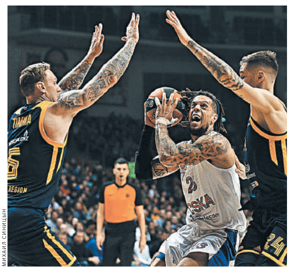
Столичные армейцы на чужой площадке смогли преодолеть многие защитные построения подмосковного соперника.

18.25. УНИКС (Казань) — «Химки» (Московская область). Единая лига. Регулярный чемпионат. Прямая трансляция.