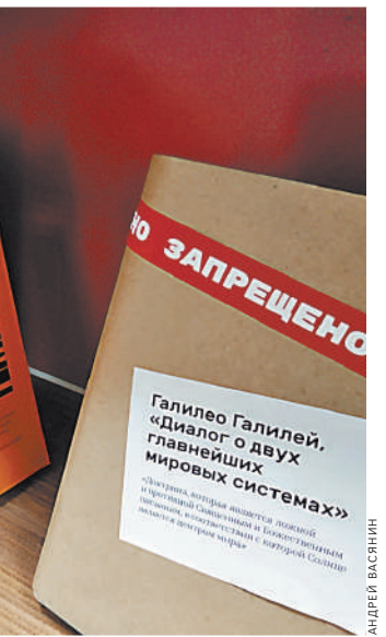
ГАЛИЛЕО ГАЛИЛЕИ «Диалог о духе, главнейших мировых системах»