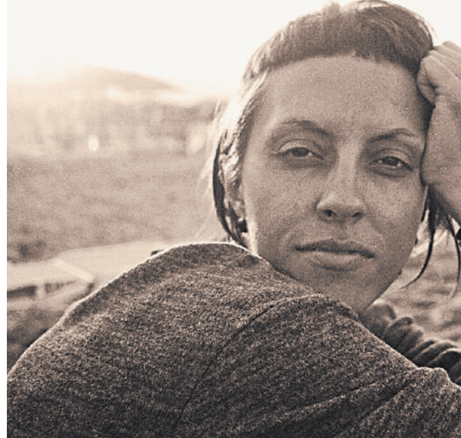
Пятнадцатиминутный фильм сделал дебютантку в анимационном кино всемирно известной.