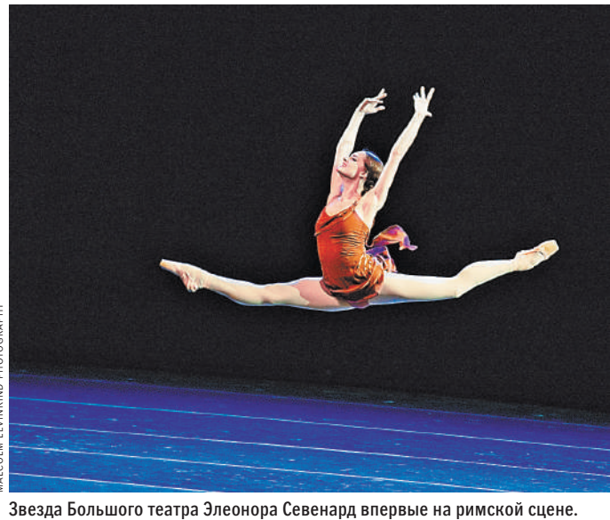
Звезда Большого театра Элеонора Севенард впервые на римской сцене.

«Для меня участие в гала-концерте в Риме — в городе, являющемся столицей мирового искусства, в котором творили великие Микеланджело и Рафаэль, является очень важной и ответственной миссией», — поде-