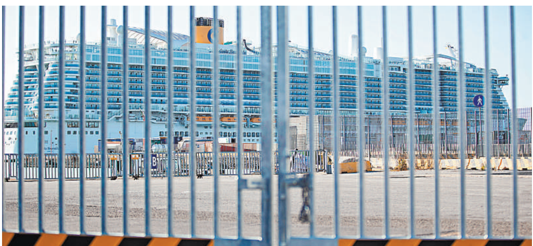
На борту заблокированного лайнера Costa Smeralda находятся шесть тысяч пассажиров и тысяча членов экипажа.

На борту круизного лайнера Costa Smeralda, который временно задержан в порту Чивитавеккья, находятся граждане России, об этом сообщает пресс-служба посольства РФ в Италии.