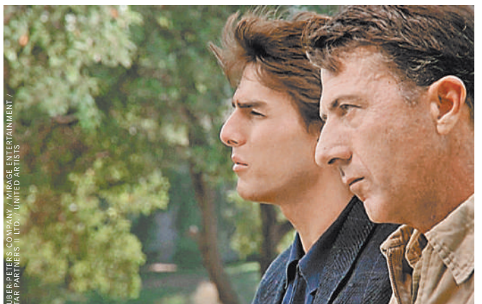
Драма «Человек дождя» принесла Циммеру первую номинацию на «Оскар» за лучшую музыку к фильму. А взял он статуэтку за «Короля Льва».

Стоит только вспомнить названия фильмов, к которым он написал музыку: «Пираты Карибского моря», «Король Лев», «Человек дождя», «Кунг-фу панда», «Темный рыцарь», «Миссия невыполнима-2», «Кодда Винчи», чтобы быть уверенным в том, что Малая арена, вмещающая 14 тысяч зрителей, наверняка будет заполнена. Ханс Циммер — автор очень разнообразной музыки. Сказочной и озорной, а порой и романтической, как в мультфильме «Король Лев» (где титульную песню исполнил Элтон Джон). Героической, размашистой, а порой и фантастической, как в «Темном рыцаре» и «Гладиаторе». Загадочной и мистической в «Кодда Винчи», и драматической, резкой, порой нежной и душераздирающей на взводе в «Человеке дождя» (том самом, где снимались Том Круз и Дастин Хоффман). Список его саундтреков внушительный, и тур поэтому запланирован впечатляющий. В нем будет звучать не только музыка в исполнении симфонического оркестра. Зрители смогут увидеть и эксклюзивный видеоряд, включающий самые знаменитые сцены из тех фильмов, которые больше всего любит сам автор саундтреков. А среди участников шоу, кстати, заявлены и Лиза Джеррард, вокалистка легендарной группы Dead Can Dance (ее жедем к микрофону в «Гладиаторе»). ●