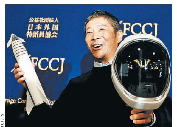
Юсаку Маэдава (на фото) первым купил билет на борт корабля от SpaceX, который совершит полет вокруг Луны.

Впрочем, бизнесмен и раньше не отличался постоянством. Японец уже обещал взять на борт космического корабля 27-летнюю актрису и модель Аямэ Горьки, пока пара не распалась. Напомним, что Юсаку Маэдава участвует в проекте SpaceX Илона Маска. На Луну его доставит самая мощная в мире транспортная система Big Falcon Rocket. Японский миллиардер принимает финансовое участие в создании космического корабля. За сколько он купил билет на борт, до сих пор неизвестно. ●