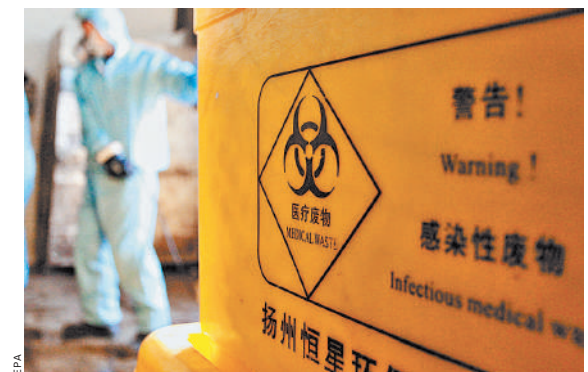
Пока никакого проверенного лекарства от коронавируса не существует.

— Вспышки заболеваний, вызванных коронавирусом, наблюдаются не первый раз. Напомним про атипичную пневмонию в 2002–2003 годах, ближневосточный респираторный синдром в 2012 и 2015 годах, — коммен-