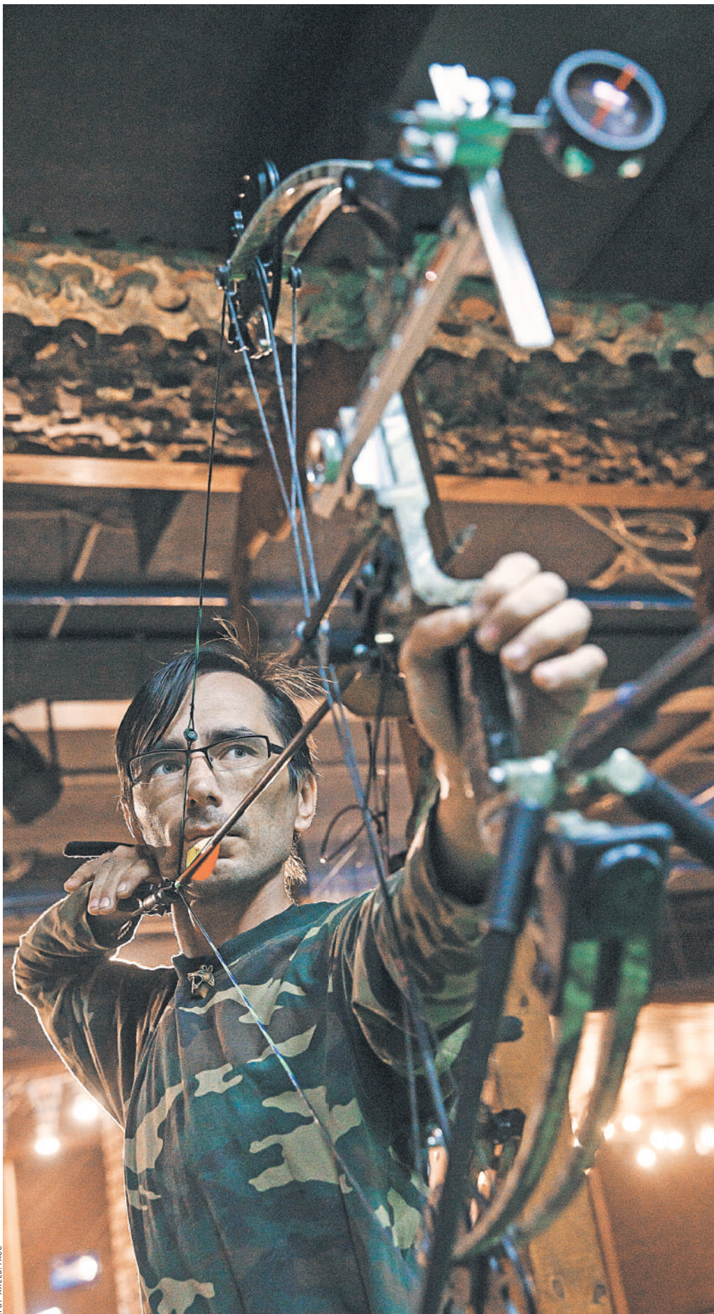
Спортивные и охотничьи луки — серьезное оружие. Они могут оснащаться даже оптическими прицелами.

— Все о личном и служебном оружии rg.ru/sujet/437