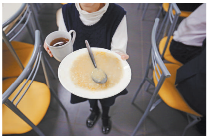
УГОСТИТЬ МАМУ ШКОЛЬНОЙ КАШЕЙ СКОРО СМОЖЕТ КАЖДЫЙ ПОДМОСКОВНЫЙ УЧЕНИК.

том, чем кормят учеников между уроками. И тогда классные руководители начали составлять графики посещения школьной столовой, выделив каждому классу квоту на совместные трапезы с родителями. Готовить, кстати, после этого стали намного лучше.