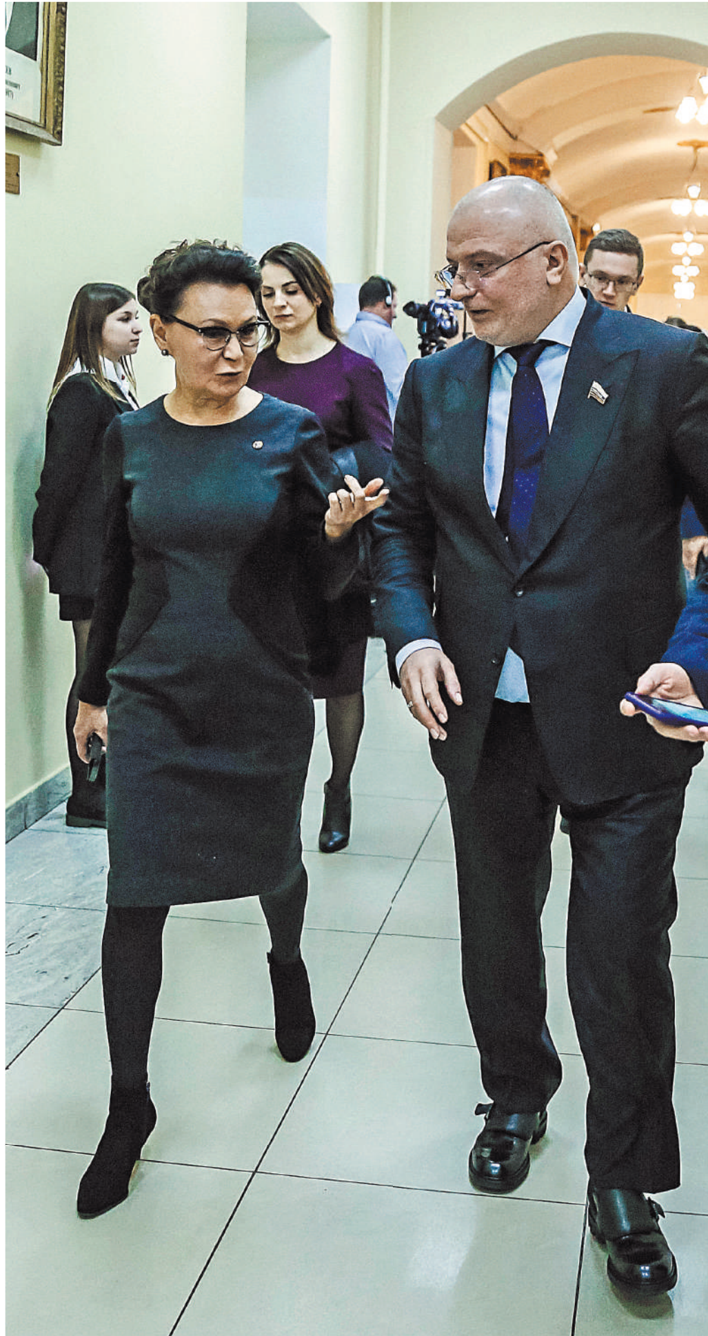
Талия Хабриева и сенатор Андрей Клишас — сопредседатели рабочей группы по изменению Конституции.

В связи с появлением дополнительных полномочий Конституционного суда, его большую включенность в законопроектный процесс, можно ожидать новых обращений от судей Конституционного суда. Каждый год из Конституционного суда в порядке, определенном в За-