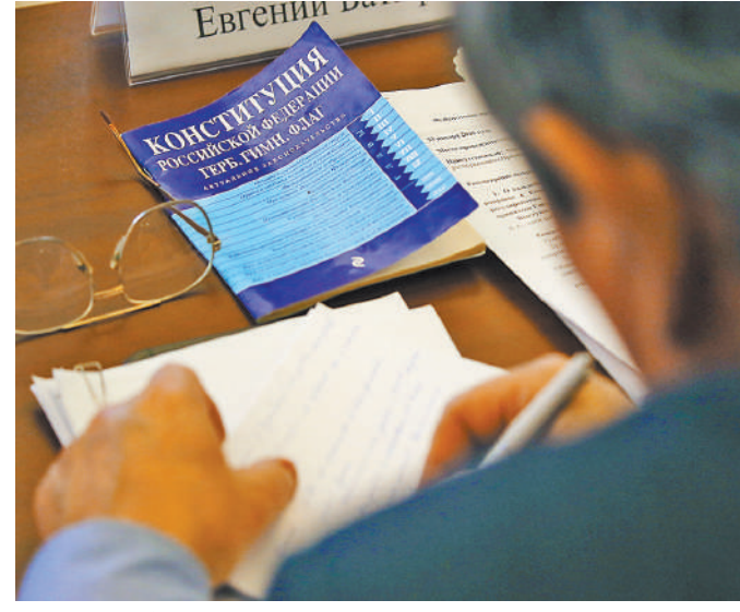
Участники рабочей группы начали дифференцировать предложения не только по главам Конституции, но и по темам.