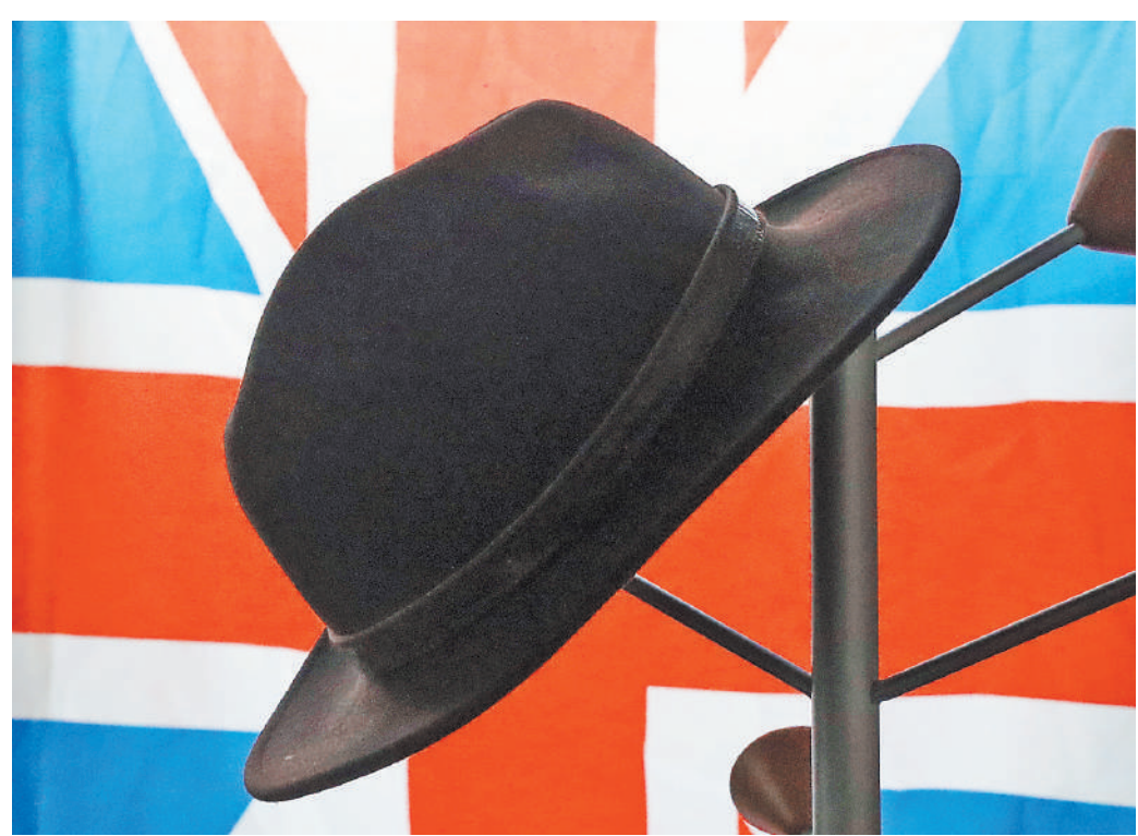
Лондон обретет самостоятельность во внешнеэкономической политике, хотя ее степень будет зависеть от итогов переговоров с ЕС, которые британцам предстоит вести весь год.

и устаревшие ограничения, которые были установлены ЕС. Прекратится применение к российско-британским отношениям двусторонних соглашений между Россией и Евросоюзом. В каких-то аспектах это плюс, в каких-то — минус. Российская сторона готова к своего рода инвентаризации экономического взаимодействия с Великобританией, по итогам которой можно будет судить о том, какие сферы в первую очередь нуждаются в новом двустороннем российско-британском регулировании. По нашей первой оценке, речь может идти о судоходстве, авиаобобщении или — пример из совсем другой области — об обороте расширяющихся материалов. Вопросы, связанные с тарифами, квотами и тому подобными аспектами применительно к торговле конкретными категориями товаров, уже прорабатываются на площадке ВТО. Естественно, это улица с двусторонним движением, и многое будет зависеть от наших британской стороны. По-