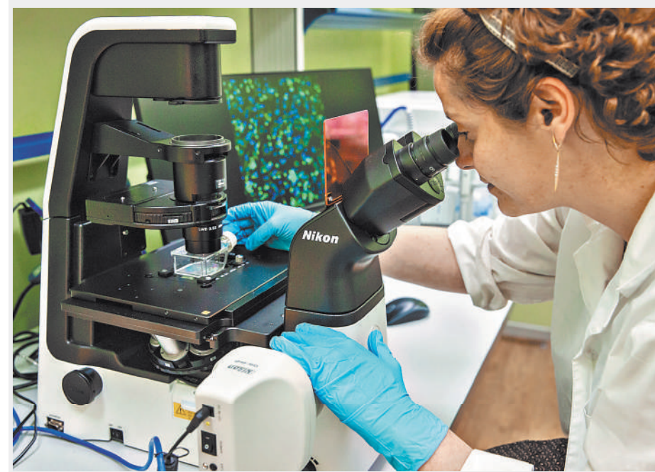
Исследователи всего мира ищут новые эффективные средства противостояния страшному недугу.