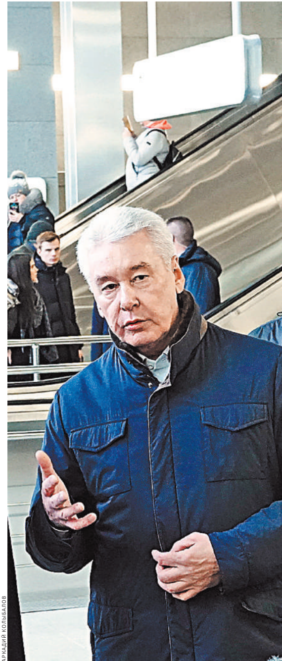
Мэр столицы Сергей Собянин открыл новый транспортно-пересадочный узел на севере города.

Путь от НАТИ до «Лихоборов» для пассажиров стал втрое короче и комфортнее