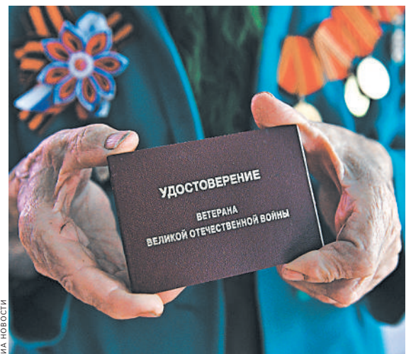
ДЕЛИТЬ ВЕТЕРАНОВ НА СВОИХ И ЧУЖИХ В РЕГИОНЕ НЕ СТАЛИ.