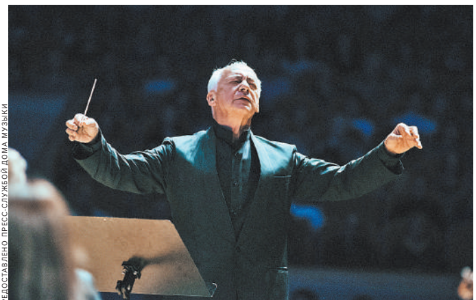
Владимир Спиваков выступит с НФОР в следующем сезоне не только как дирижер, но и как солист.