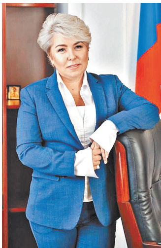
Ирина Гусева: Главная задача власти — комплексный подход к запросам людей.

Правительство РФ обязало власти городов и районов с 2021 года публиковать в интернете планы по благоустройству территорий с учетом практики инициативного бюджетирования. Суть новшества нам прокомментировала первый зампред Комитета Госдумы по федеративному устройству и вопросам местного самоуправления, член фракции «Единая Россия» Ирина Гусева.