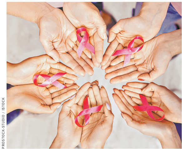
В России рассказывать о своей борьбе с онкозаболеванием пока не принято.