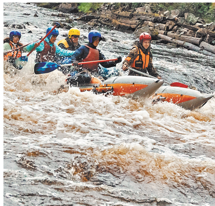
Нацпарки и заповедники в России ежегодно посещают 8–9 млн человек.