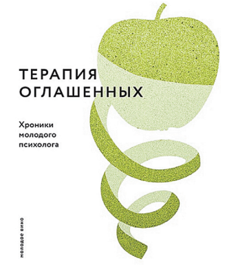
Главная героиня этого увлекательного и мудрого романа—приходской психолог Соня. Что уже необычно.

шить проблемы в семье... И, конечно, совершенствуется в профессии—ходит на супервизии (да, психологи тоже иногда нужен психолог!), где происходит много важных, а иногда комичных ситуаций. Но главное открытие—психологи тоже люди, со своими, казалось бы, неразрешимыми обстоятельствами.