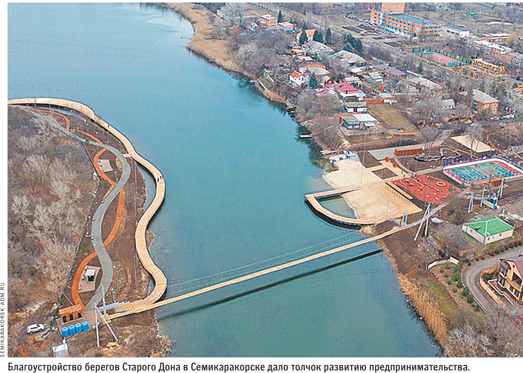
Благоустройство берегов Старого Дона в Семикаракорске дало толчок развитию предпринимательства.

участников зачастую меньше возможностей, в том числе финансовых, для реализации проектов и привлечения инвесторов, чем у крупных городов. Накладываются также и ограничения, связанные с историческим характером поселений. Поэтому конкурс — это действенный инструмент поддержки социально-экономического развития. Высокое качество городской среды повышает капитализацию объектов недвижимости и бизнеса, дает стимул развитию сектора услуг. Кроме того, в городах появляются команды, которые научились работать над комплексными проектами, появляется практика междомственного взаимодействия. Только благодаря победителям IV конкурса, итоги которого подвели в сентябре, будет создано около 10 тысяч рабочих мест, пешеходный трафик на обустроенных территориях составит почти 50 млн человек.