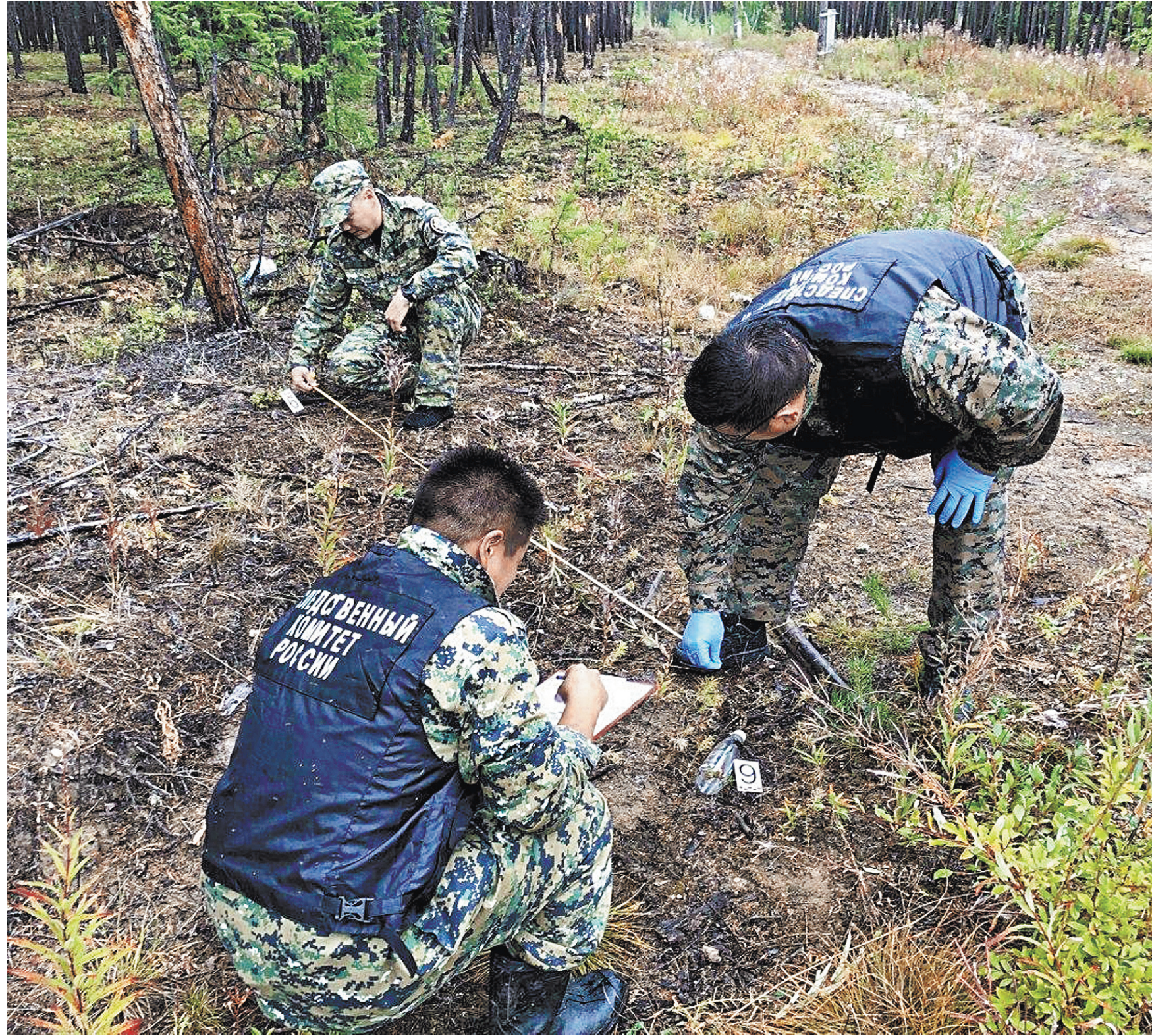
СЛЕДСТВЕННЫЙ КОМИТЕТ РФ

Кроме того, в прошлом году в территориальных следственных органах были созданы уже самостоятельные подразделения, специализирующиеся на раскрытии и расследовании преступлений прошлых лет, а в структуре Главного следственного управления ведомства