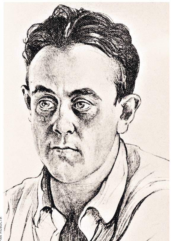
Джон Рид дает нам возможность почувствовать его эпоху.

С Америкой и сейчас, и в прошлом связано много мифов и стереотипов. Журналист, репортер и—да—убежденный социалист Джон Рид не только разрушал мифы об Америке, но и стал настоящим другом молодой Советской России. США в первой половине XX века—это Голливуд и «Кока-Кола», Рокфеллеры и Морганы, президенты Вильсон, Рузвельт и Трумэн. Но еще это и виртуоз короткого рассказа О'Тенри, мастер приключенческих романов Джек Лондон, выдающиеся журналисты Уолтер Липпман и Линкольн Стеффенс. И, конечно, возмутитель общественного мнения, «могилищник» американских газет, преступник, по мнению сената США, борец с американским капиталом—Джон Сайлас Рид.