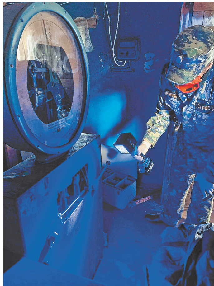
Специальные источники света позволяют экспертам-криминалистам обнаружить следы преступника в самых труднодоступных местах.

Выражаю глубокую признательность ветеранам за активную помощь в воспитании молодых специалистов, передачу им накопленных знаний и богатого опыта. От всей души желаю всем крепкого здоровья, успехов, благополучия! ●