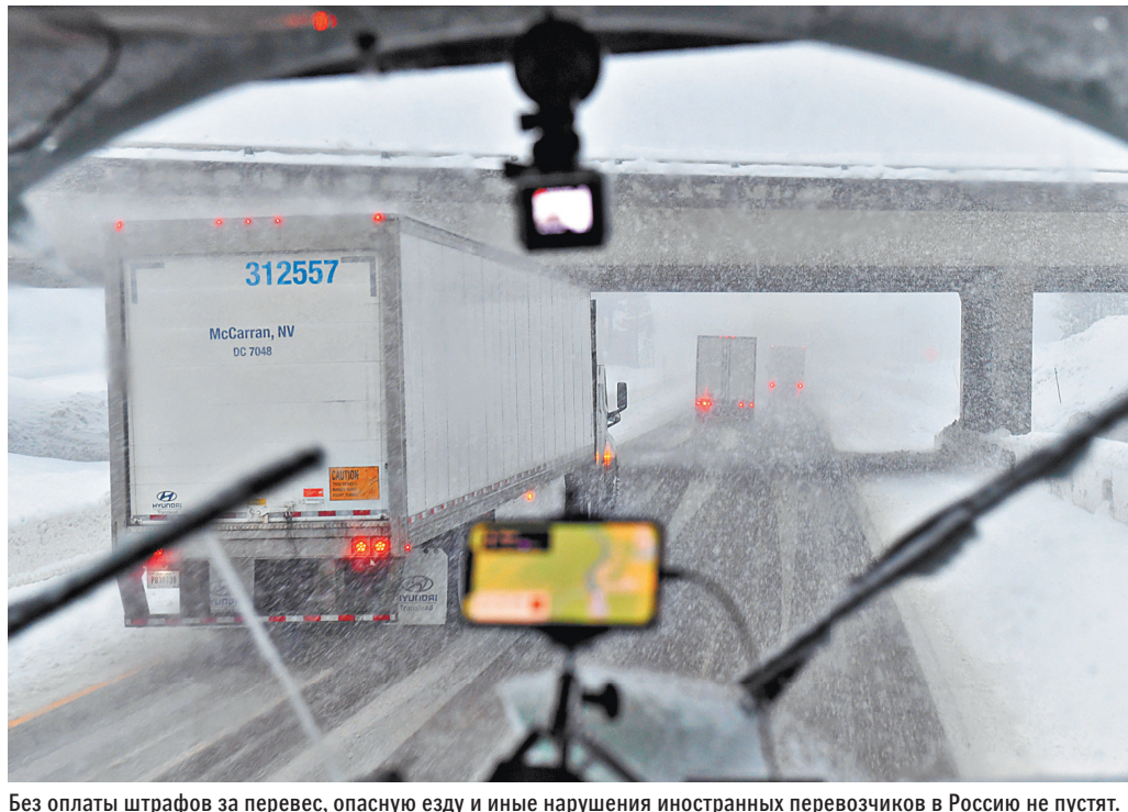
Без оплаты штрафов за перевес, опасную езду и иные нарушения иностранных перевозчиков в Россию не пустят.