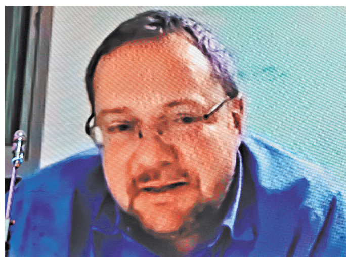
Александр Ильичевский выиграл премию «Большая книга».

Премиальный фонд премии — 5,5 млн рублей. Из них 3 млн получает обладатель первой премии, 1,5 млн — второй, и 1 млн — третьей.