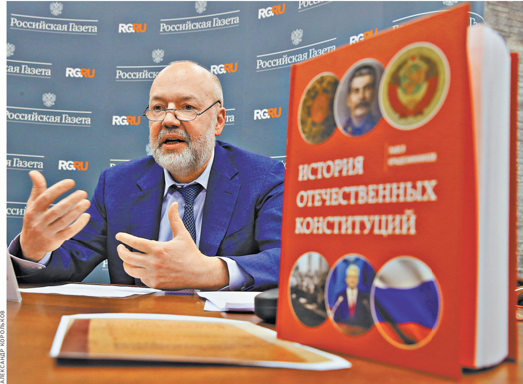
Представляя книгу, Павел Крашенинников подчеркнул, что Конституция — отражение потребности в переменах.

Пандемия наложила свой отпечаток. Презентации предыдущих книг Павла Крашенинникова проходили при полном аншлаге. Но и на сей раз живой интерес к новой книге проявился широко и активно — от Москвы до уральских земель автора и других его читателей.