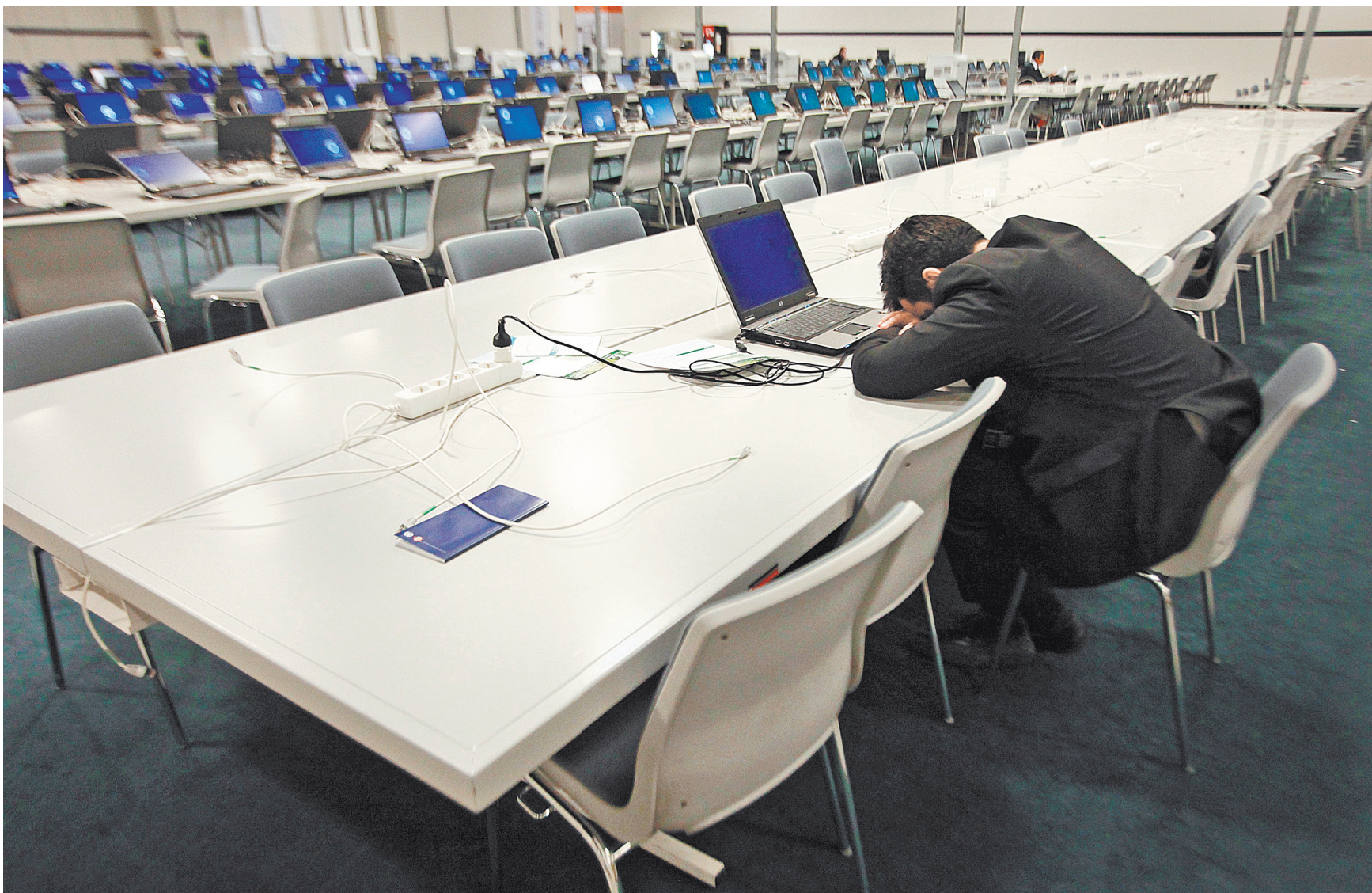
Если человек изначально устроился работать в офис, то «удаленка» не может длиться для него вечно.