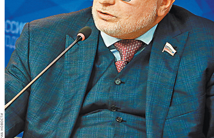
Андрей Клишас уверен: масштабы и значимость работы по реформе Конституции трудно переоценить.

Неприкосновенность прекратившего исполнение полномочий президента в соответствии с предлагаемым регулированием может быть прекращена в случае принятия соответствующего решения Советом Федерации только на основании выдвинутого Государственной Думой обвинения в государственной измене или совершении иного тяжкого преступления, а также наличия заключения Верховного суда, подтверждающего наличие в действиях экс-президента признаков соответствующих преступлений, и заключения