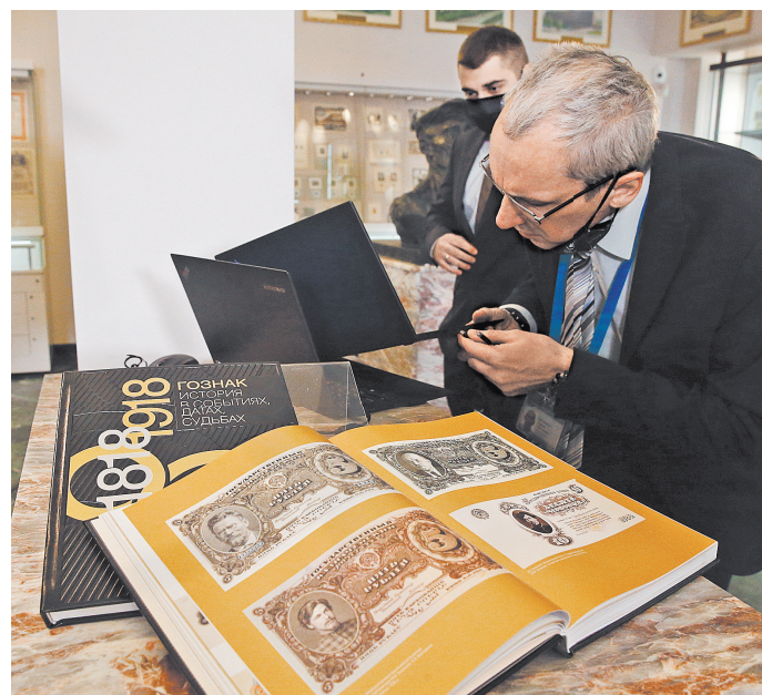
Уже два века Гознак — единственный изготовитель банкнот в России.

Сейчас Гознак готовится к полномасштабному запуску системы прослеживаемости драгметаллов, драгкамней и изделий из них (ГИС ДМДК). Она позволит уже с 2021 года отслеживать происхождение и подлинность всех ювелирных изделий. Система пока работает в тестовом режиме, участникам доступна только часть ее функционала. Постепенно он будет расширяться. Как и любое нововведение, ГИС ДМДК предполагает дополнительные усилия со стороны отрасли, но Пробирная палата и Минфин планируют очень плавный запуск системы без каких-то запретительных шагов на первом этапе, чтобы у отрасли было время адаптироваться, подчеркнул Трачук.