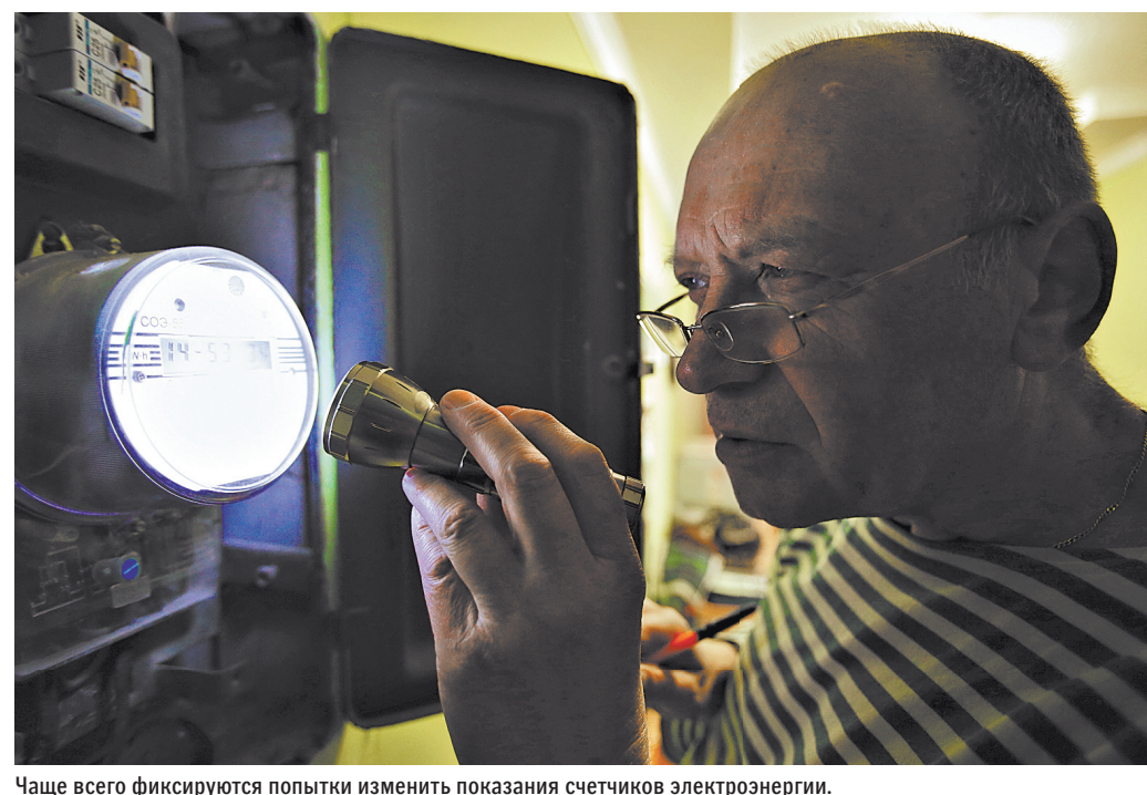
Чаще всего фиксируются попытки изменить показания счетчиков электроэнергии.