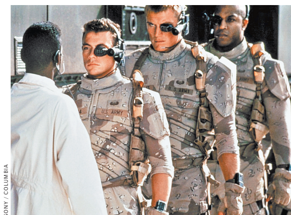
Доклад французской спецкомиссии — шаг к тому, чтобы такие «универсальные солдаты» появились на реальном поле боя, а не только в кино.