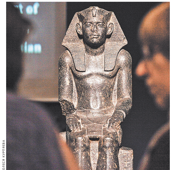
Вернутся ли экспонаты в страны, из которых они были вывезены? Об этом спорят эксперты.

Что это? Раскаяние в колониальных грабежах или передел музейных ценностей? Как теперь быть — заново распределить экспонаты между странами или оставить все как есть? Конечно, сложно оценить происхождение сокровищ в музейных коллекциях без исторического контекста, который чаще всего оказывается негативным. Одни экспонаты оказались в хранилищах вследствие кровопролитных колониальных войн, дру-