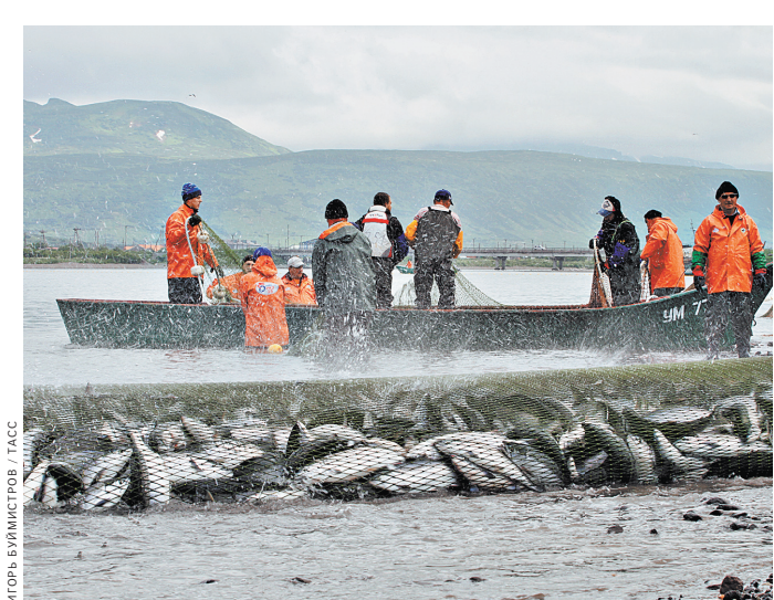
На международном уровне соглашение о противодействии незаконному рыбному промыслу действует с середины 2016 года.

Россия ратифицировала соглашение по предупреждению, сдерживанию и ликвидации незаконного, несообщаемого и нерегулируемого (ННН) рыбного промысла. Соглашение обязывает страны, присоединившиеся к договору, ввести в своих портах меры для предотвращения выгрузки незаконных уловов. Также страны должны обмениваться информацией о судах, уличенных в ННН-промысле или ведущих деятельность, связанную с ними. Документ разрешает отказывать в заходе в порт судам, уличенным в ННН-промысле. По данным Продовольственной и сельскохозяйственной организации ООН (ФАО), на незаконный вылов приходится около 15% объема промышленного рыболовства.