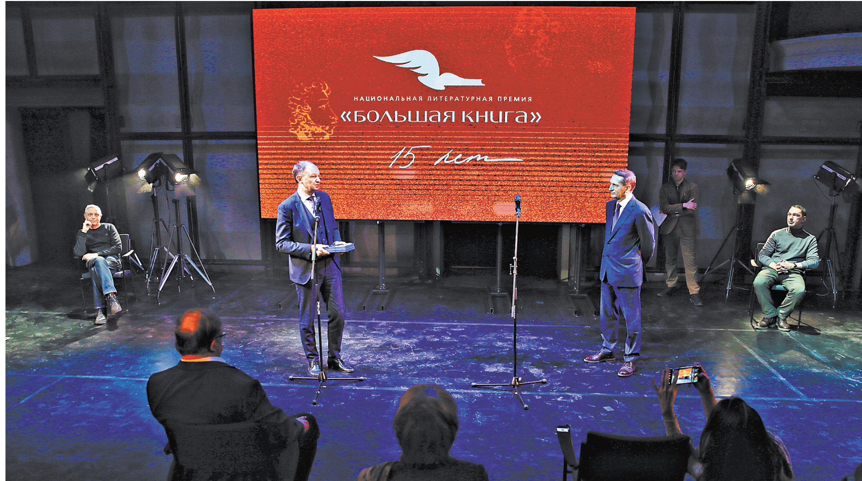
Сергей Нарышкин вручил награду Михаилу Сеславинскому и всему коллективу Роспечати.