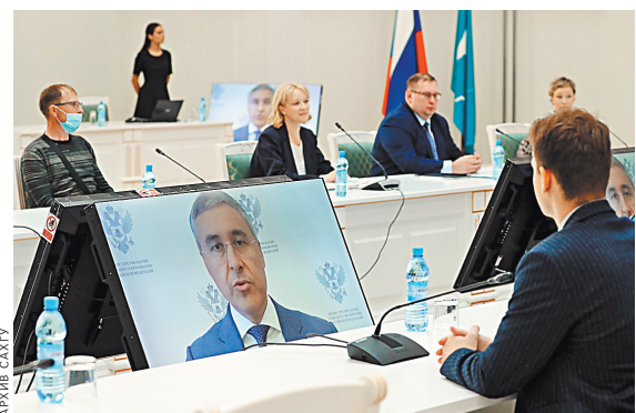
Церемония подписания меморандума о создании мультиуниверситета прошла в СахГУ в видеоформате.