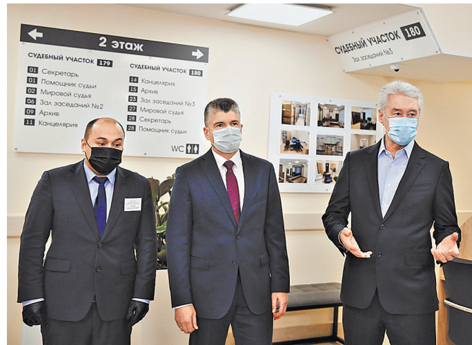
Сергей Собянин осмотрел новое здание для размещения трех судебных участков мировых судей района Раменки.