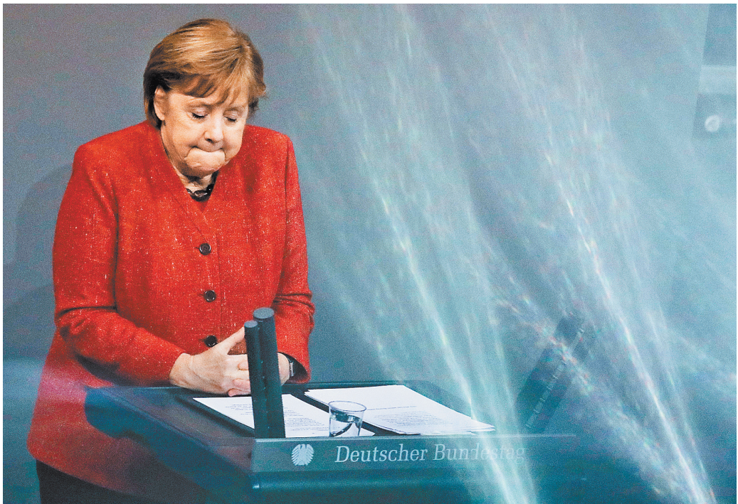
Канцлер Меркель, не скрывая волнения, объявила в будничестве, что немцам предстоит сильнее «затянуть пояс».