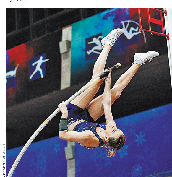
Анжелика Сидорова — обладательница лучшего результата зимнего сезона в мире с прыжком на 4,95 метра.

Что касается Павла Кулижникова, то в начале года он собрал завидную коллекцию медалей. На чемпионате Европы на отдельных дистанциях, который прошел в голландском Херенвене в январе, победил в забегах на 500 и 1000 метров, а также в командном спринте. На февральском чемпионате мира в Солт-Лейк-Сити Кулижников не только взял два «золота», но и установил рекорд мира на дистанции 1000 м (1.05,69). Павел стал первым человеком, выбежавшим из 1 минуты 6 секунд. ●