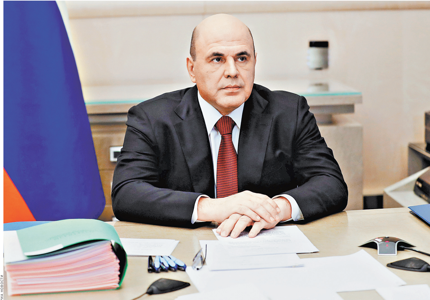
Михаил Мишустин поручил проработать с крупными торговыми сетями проблему роста цен на продукты.

В этой связи руководителям федеральных органов исполнительной власти еще раз напомнили об их прямых обязанностях. Минсельхоз должен следить за ценами сельхозпроизводителей, объемами посевов, производства, поставок на внутренний рынок и на экспорт. Минпромторг наделен полномочиями для отслеживания динамики цен в розничных сетях