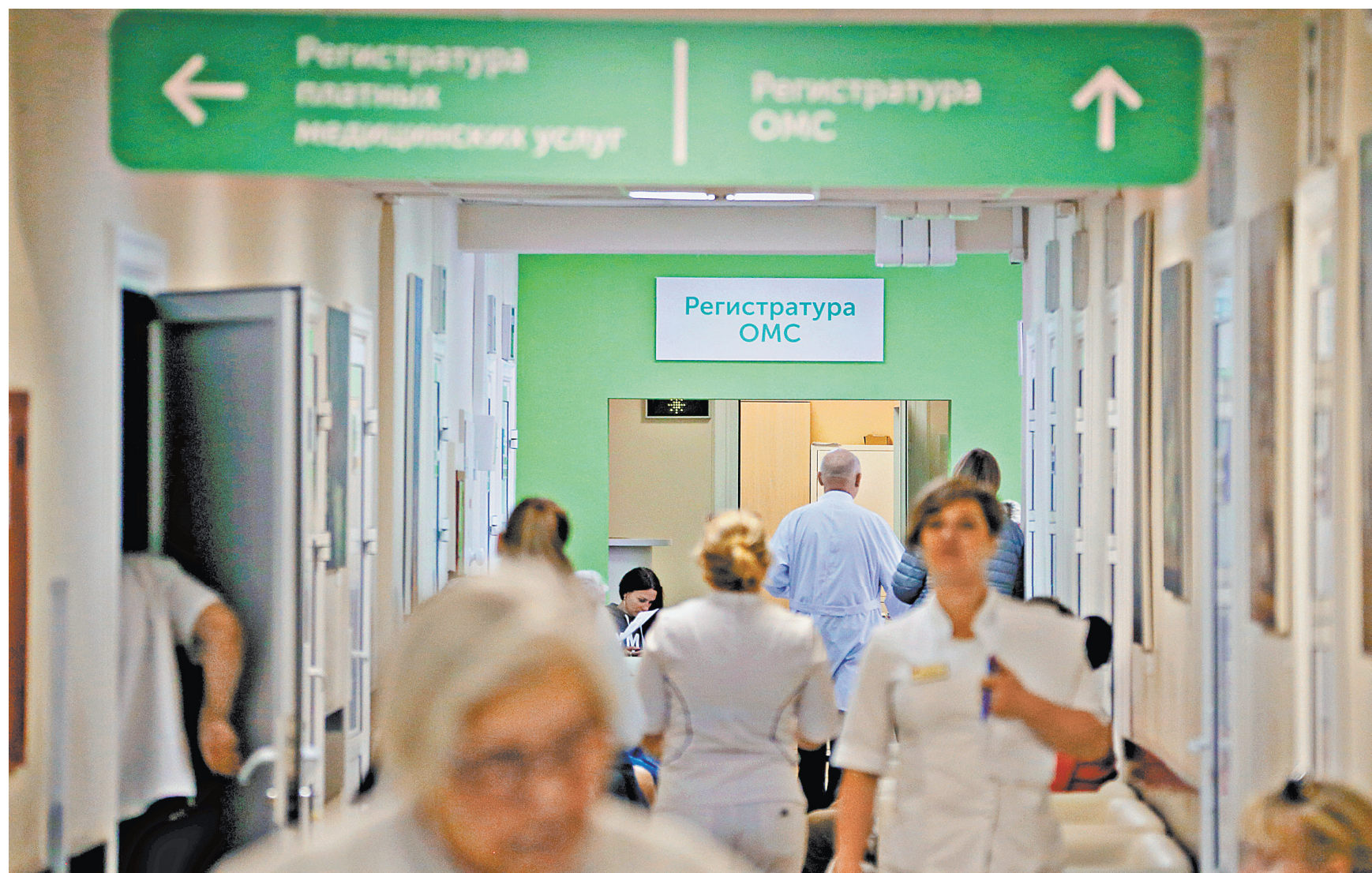
На обеспечение базовой программы ОМС в 2021 году предусмотрено почти 2,3 трлн рублей, это на 51 млрд больше, чем в этом году. В 2022 году она увеличится до 2,4 трлн, а в 2023 году — до 2,5 трлн рублей. Это должно гарантировать доступность медицинской помощи для россиян.