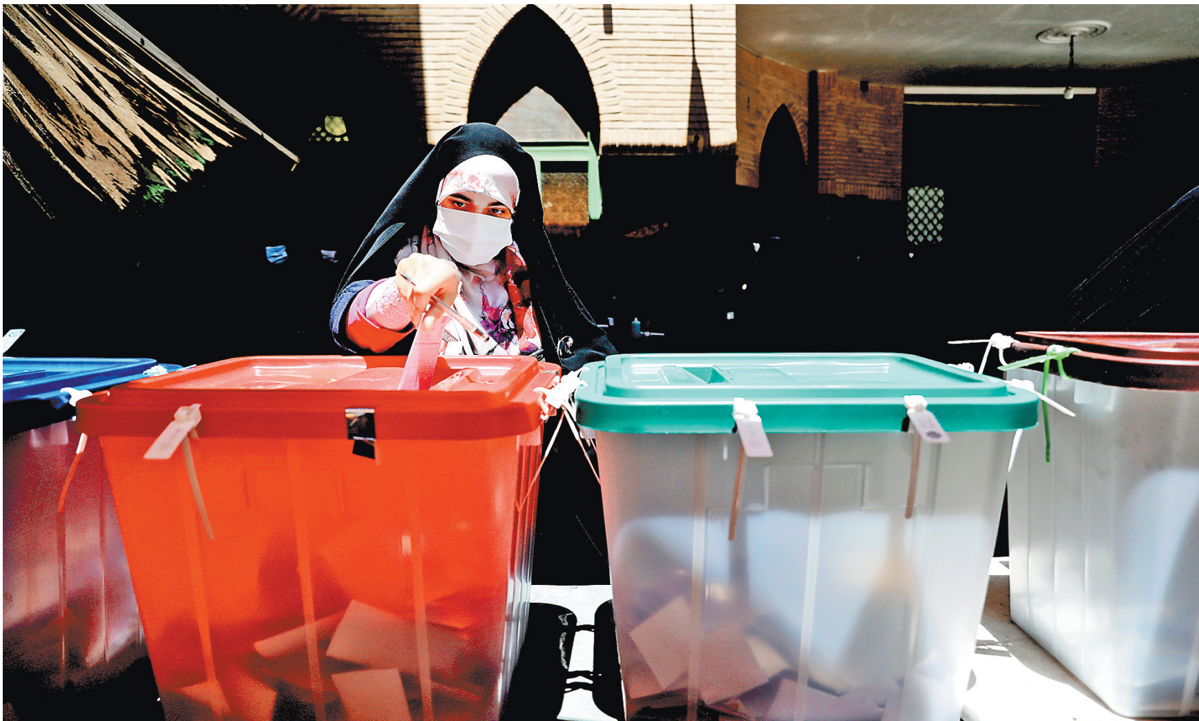
Голосующие выбрали между четырьмя кандидатами. Но главным претендентом считается глава судебной власти Ирана 60-летний Эбрахим Раиси.

Что интересно, экс-президент ИРИ Махмуд Ахмадинежад, который ранее собирался выставить свою кандидатуру на нынешних выборах, но был дисквалифицирован, заявил в день голосования, что не пойдет на избирательный участок, по-