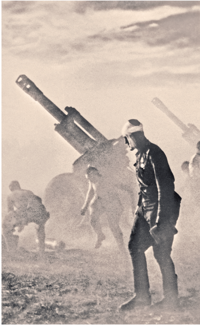
Июнь 1941-го. Артиллеристы в время боя.

Подписка не выгоднее владения автомобилем, так как в ее цену включаются все затраты на содержание и амортизацию автомобиля. ●