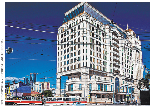
Отель Lotte, построенный «Корпорацией Кошелев» к Чемпионату мира по футболу, стал визитной карточкой Самары.