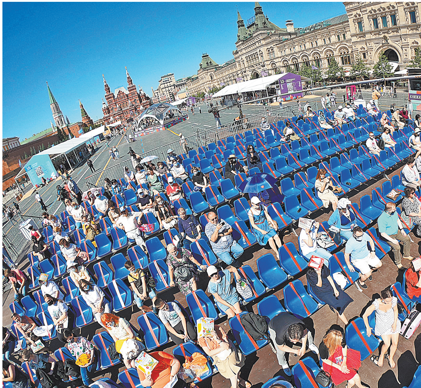
На книжном фестивале «Красная площадь» пришлось соблюдать социальную дистанцию, и читатели охотно выполняли это требование.

Булгаков остается одним из самых известных русских писателей XX века. И толстый том подлинных документов, умело «смишированных» и прокомментированных Виктором Лосевым, — прекрасное дополнение к каноническому корпусу. Несущее, с одной стороны, «резкие черты неподражаемого слога», а с другой — позволяющее понять, «из какого сора...». Включая «сор» в прямом смысле. На который, впрочем, сто лет спустя можно взглянуть без смущения. ●