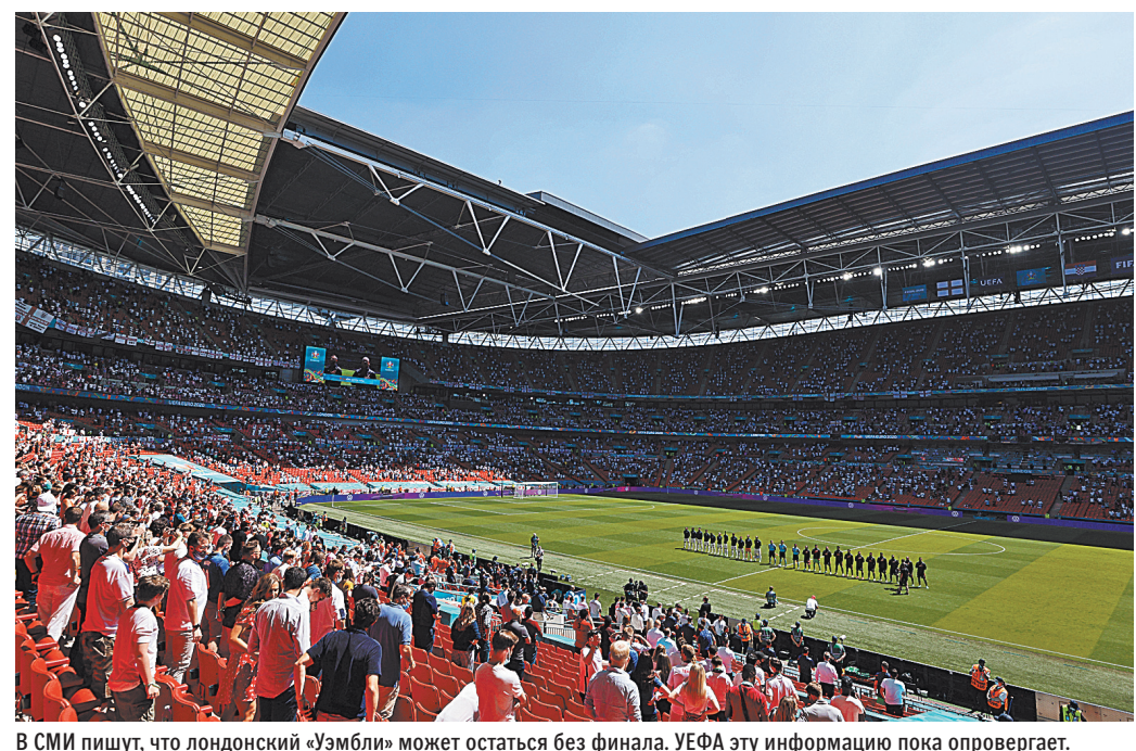
В СМИ пишут, что лондонский «Уэмбли» может остаться без финала. УЕФА эту информацию пока опровергает.

провели между собой сборные Германии и Португалии. На счету бундестим — десять побед, у «европейских бразильцев» — только три.