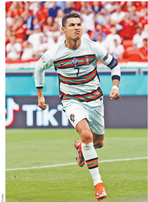
Криштиану Роналду — рекордсмен по числу матчей в финальных стадиях Евро (22) и лучший бомбардир чемпионатов Европы с учетом квалификации (42 гола).

Что касается статистики, то немецкая и португальская команды встречались между собой 18 раз. Германия выигрывала десять раз, а вот «европейские бразильцы» всего лишь три.