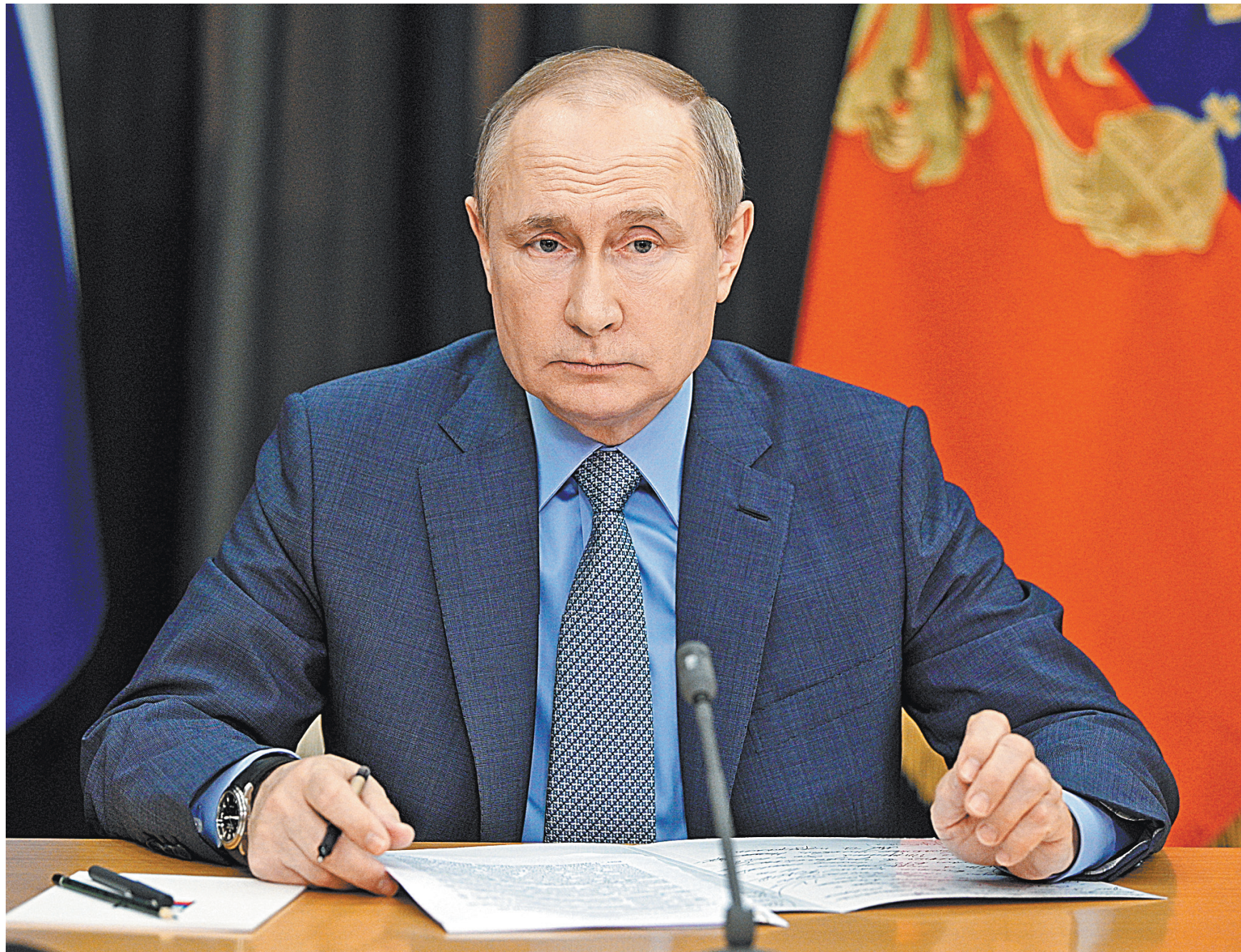
Владимир Путин подписал указ о назначении выборов в Госдуму, а ЦИК утвердил порядок проведения голосования.

— дистанционное электронное голосование. Уже известно, что оно пройдет в семи регионах. Это Нижегородская, Кур-