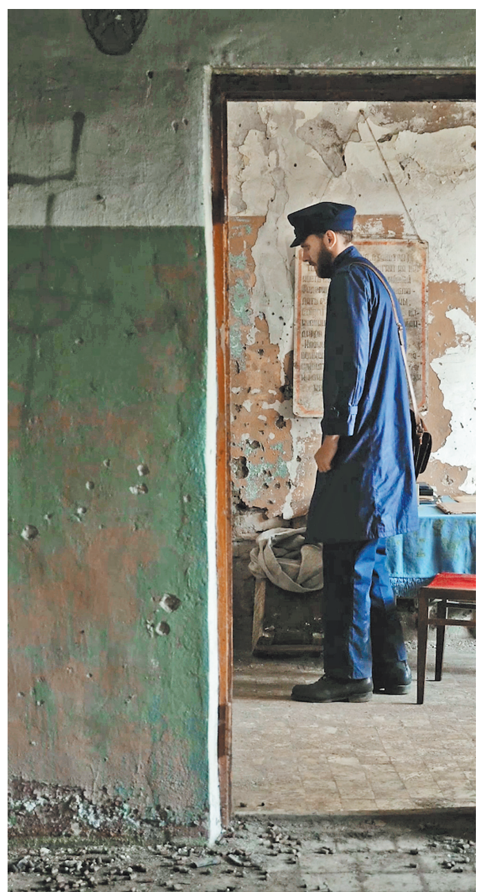
Действие антиутопии происходит в постапокалиптическом мире. Как это ни бессмысленно, герой в мертвом городе продолжает работать покладно.