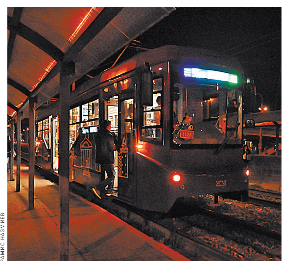
Пассажиры отправляются в путешествие по ночному городу, а экскурсовод рассказывает о малоизвестных фактах из истории Казани.