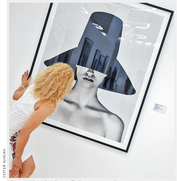
Фотографии Альберты Тибурци о самобытной итальянской моде 80-х впечатляют и современных стильных красавиц.

Выставка «Альберта Тибурци. Блестящая эпоха. Итальянская мода 80-х» открыта в ЦВЗ «Манеж» по 28 июля. А в соседних залах представлено еще четыре любопытных проекта.