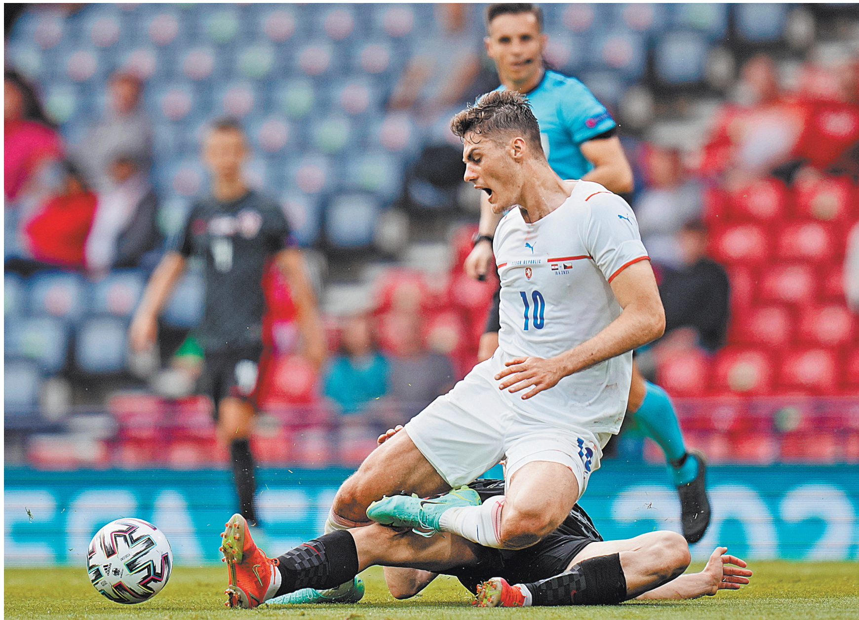
Патрика Шика можно смело назвать одним из главных открытий на старте Евро-2020. Не исключено, что его три гола в матчах с Шотландией и хорватами выведут чехов в плей-офф турнира.

— Мы приехали на Евро уверенными в себе. Думаю, все видели, что мы готовы к турниру. Хорватия будет больше владеть мячом. Нам нужно быть более внимательными, лучше защищаться и стараться не допу-