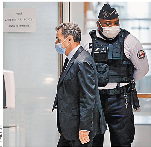
Хождение экс-президента Франции Николая Саркози по мукам продолжается.

Хождение экс-президента Франции Николая Саркози по мукам продолжается. В начале марта по шумевшему делу о «прослушках», где его обвинили в коррупции, Саркози приговорили к тюремному заключению на один год, плюс два года условно. А теперь на только что закончившемся другом судебном процессе прокуратура потребовала наказать его еще шесть месяцев тюрьмы, а также штрафом в 3750 евро. На этот раз речь идет о финансовых нарушениях, допущенных в ходе его предвыборной кампании 2012 года. Суть в том, что ее организацией занималось пиар-агентство «Бигмэлион». Оказалось, что им была потрачена на митинги, собрания, агитплакаты и прочую соответствующую продукцию сумма в 42 с лишним миллиона евро, что почти вдвое превышает разрешенный французскими законами лимит средств на эти цели. Причем, как выясняли следователи, люди «Бигмэлиона» выставляли фальшивые счета по явно завышенным расценкам партии «Союз за народное движение», переименованной позже в «Республиканцы», от которой баллотировался Николай Саркози. Мол, эти деньги тратились на стубу партийные дела. С помощью этой махинации накапливались крупные и, что немаловажно, неучтенные суммы. На процессе Николай Саркози всячески отрицал какую-либо причастность к аферу. Ведь в ту пору он был государством и кандидатом на свое переизбрание, а финансированием предвыборной кампании, как он заявил, занимались другие люди.